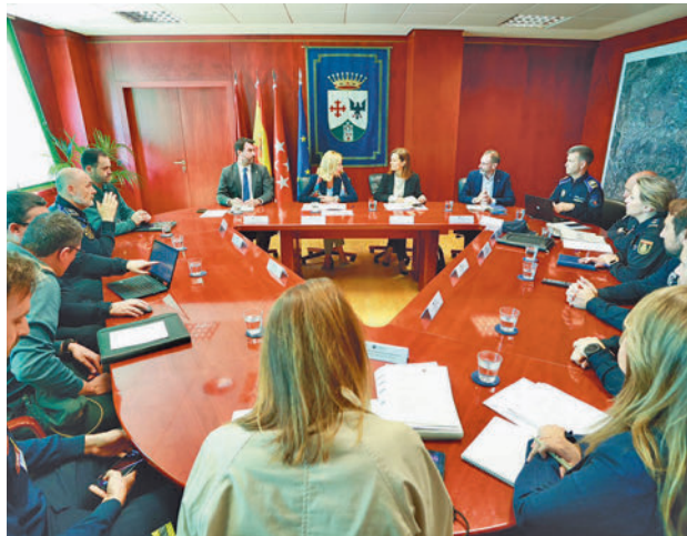
Un momento de la Junta Local de Seguridad

Durante la Junta se ha revisado el plan de seguridad para la celebración de las Fiestas de San Isidro 2024, que el año pasado reunieron a unas 75.000 personas en la localidad, por lo que también han estado presentes miembros de cuerpos de Emergencias, Bomberos y Protección Civil. Para dicho evento se han fijado los recursos tecnológicos y humanos.