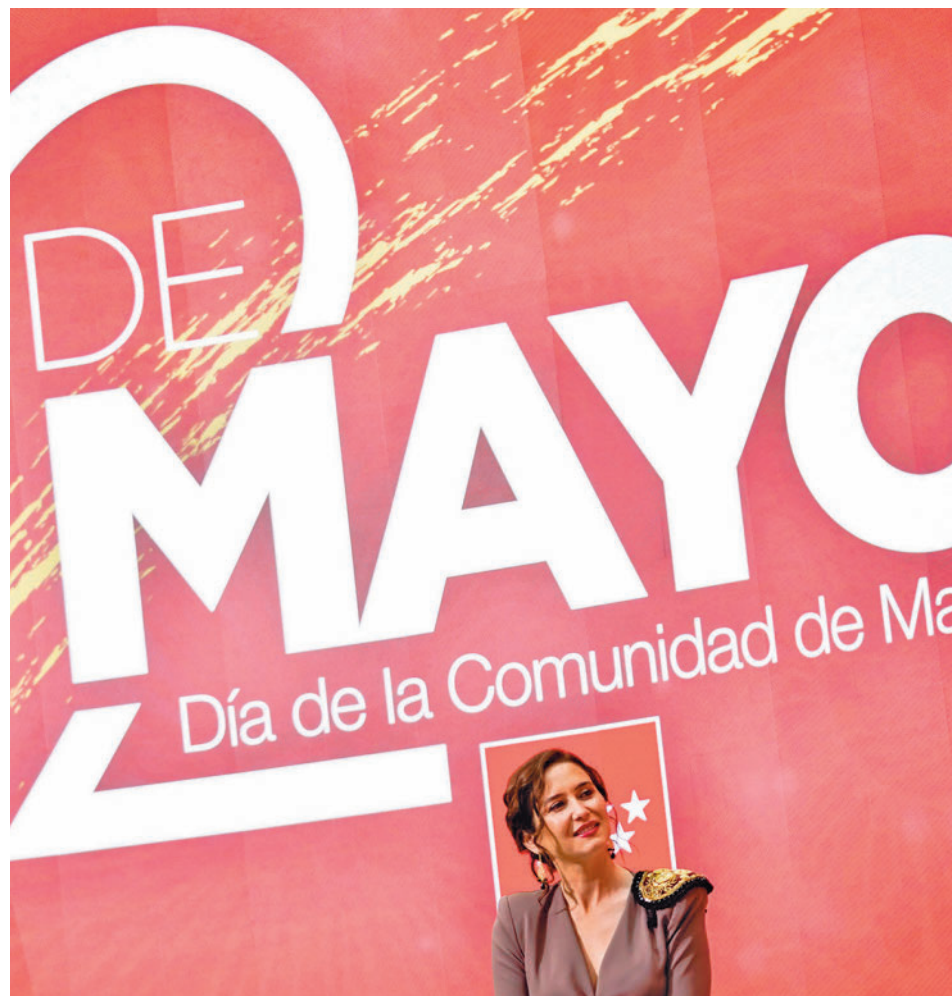
Isabel Díaz Ayuso, durante el pasado Dos de Mayo

El incidente desembocó en una polémica que alcanzó a la política nacional, algo que se agravó debido a que el país se encontraba en