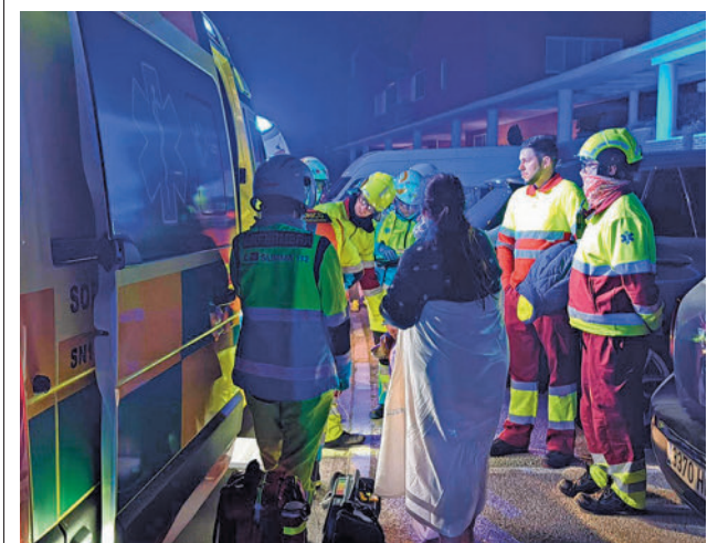
Actuación del SUMMA 112

El objetivo es poner al ciudadano en contacto con la naturaleza, pero también que se convierta en un punto de encuentro para el vecino, especialmente para las personas mayores y las personas con capacidades diferentes, aseguran fuentes de la formación, quienes explican que estos espacios son jardines que contienen elementos para la interacción sensorial y la socialización, así como módulos o áreas en las que se pueden realizar talleres orientados a la estimulación, orientación y socialización.