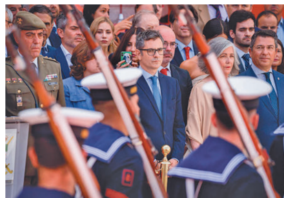
Félix Bolaños, durante el pasado 2 de mayo

Al margen de la entrega de la Gran Cruz, la celebración del Dos de Mayo volverá a contar con los eventos tradicionales, como la ofrenda floral a los héroes de 1808 en el cementerio de La Florida o la parada militar que se realiza en la Puerta del Sol.