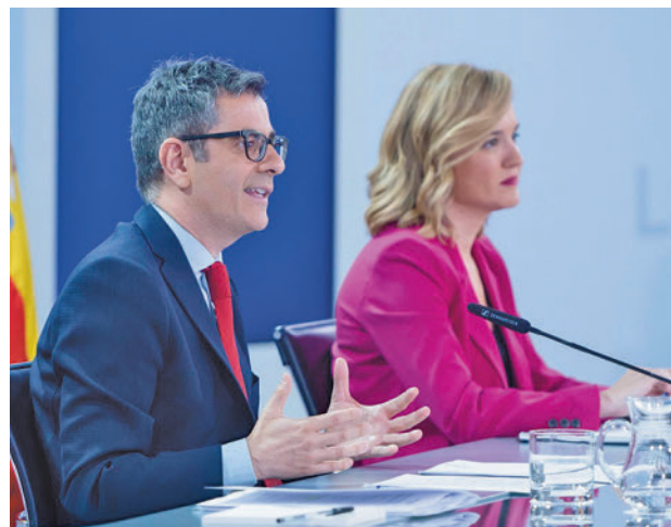
Rueda de prensa tras el Consejo de Ministros

El objetivo de esta reforma es tener “un control efectivo y periódico de los antecedentes por delitos sexuales o de trata”, señaló el ministro de Presidencia, Justicia y Relaciones con las Cortes, Félix Bolaños. “Hemos detectado casos de personas que después de estar trabajando con menores, y haber aportado el certificado, cometían delitos de esta naturaleza”, ha admitido Bolaños, quien ha resaltado que con estos cambios “se previene con mucha más eficacia que haya personas, delincuentes sexuales, que pue-