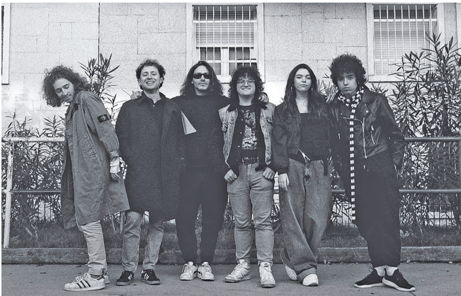
Foto de la formación actual de la banda madrileña