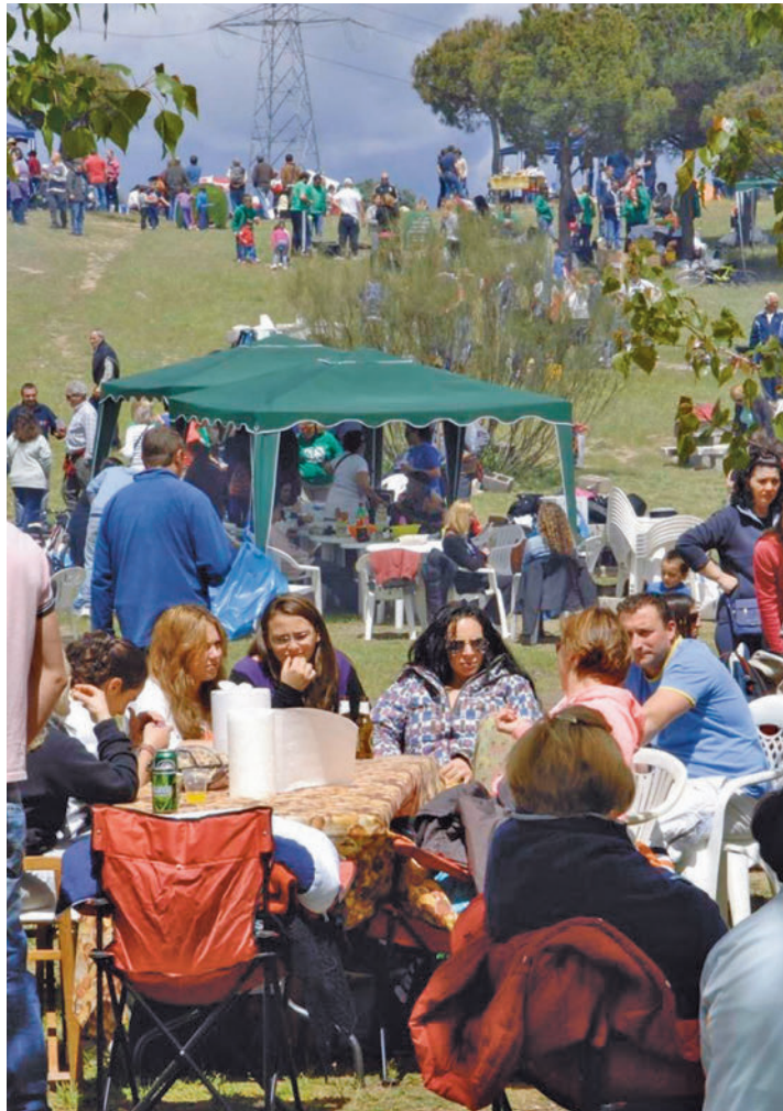
Foto de archivo de la romería en el parque de La Marina

Sin salir del ámbito musical, el edificio Gloria Fuertes