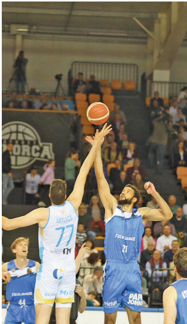
Otra victoria importante del Fuenlabrada FEB

Eso sí, el calendario reserva al cuadro fuenlabreño tres rivales de enjundia. Para arrancar, este sábado 27 (18:30 horas) llega al Fernando Martín un Guuk Gipuzkoa Basket que busca terminar en cuarta o quinta posición para contar con el factor can-