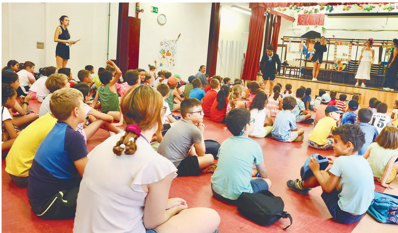
AYTO DE ALCOBENDAS