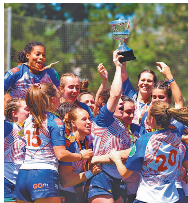
Celebración del nuevo éxito FEDERACIÓN DE RUGBY

Este domingo (18:30 horas), los colegiales recibirán a un Cáceres Patrimonio de la Humanidad que ya está descendido y solo se juega el honor. Melilla, de nuevo en casa (domingo 5), y Oviedo completan el calendario de un Movistar Estudiantes que si asegura el factor cancha se enfrentaría al noveno clasificado del 'play-off' por haber ganado la Copa Princesa.