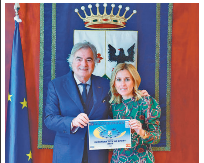
El presidente de ACES Europa, junto a la alcaldesa