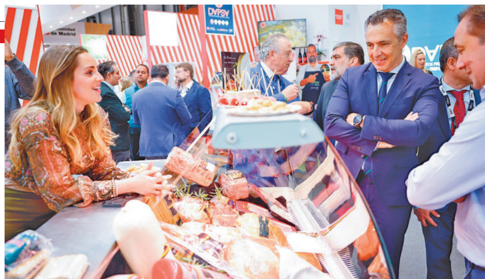
Novillo contempla algunos de los productos madrileños

El Ayuntamiento de Madrid, por su parte, aprovechó el evento para dar a conocer los productos de sus mercados municipales. “Madrid está,