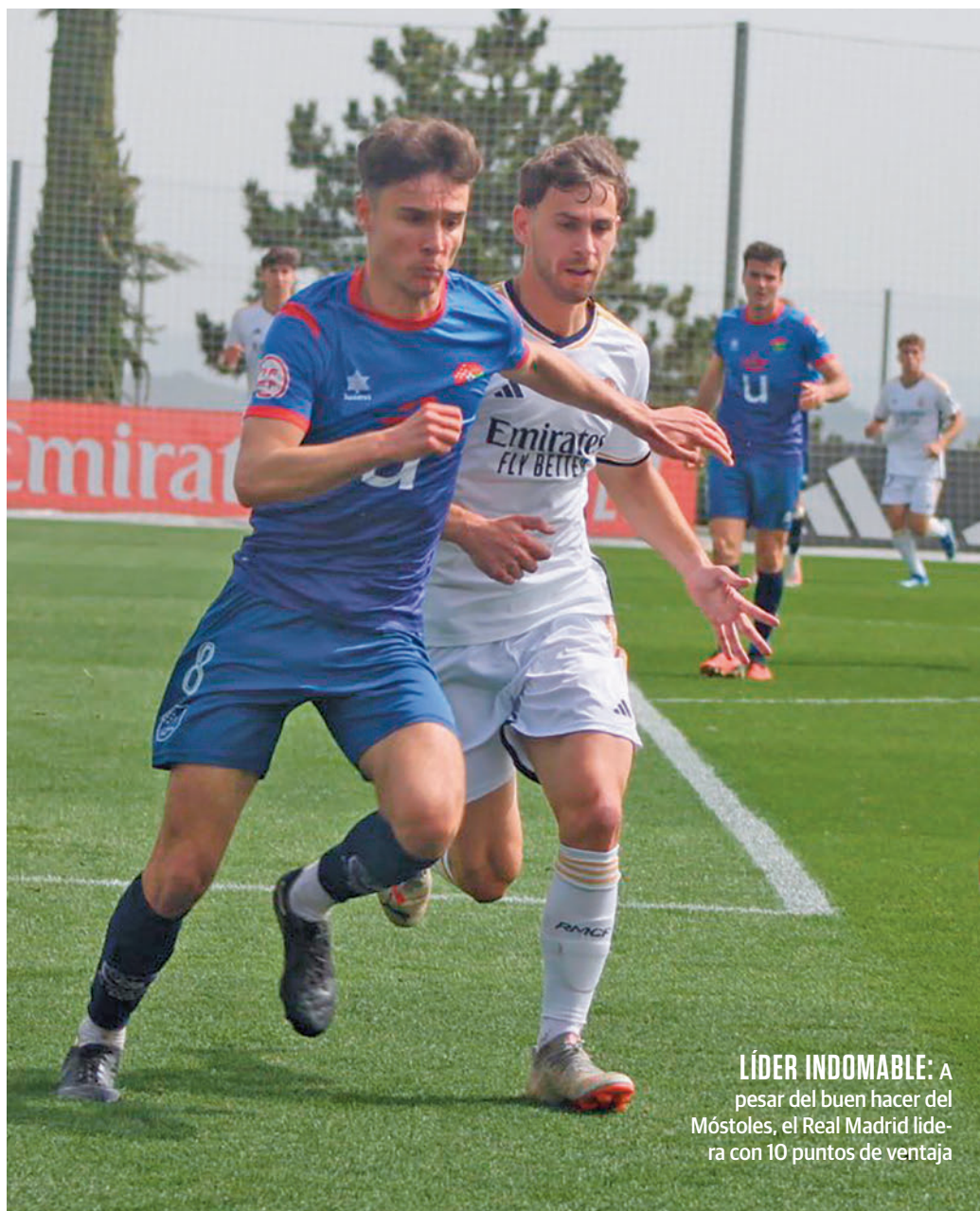
LÍDER INDOMABLE: A pesar del buen hacer del Móstoles, el Real Madrid lidera con 10 puntos de ventaja

Con el Móstoles (o el Real Madrid C) ya clasificado, los otros tres billetes para la promoción de ascenso tienen varios pretendientes. El que mejor lo tiene es el Leganés B, tercer clasificado con 9 puntos de ventaja cuando solo quedan 12 en juego. Más méritos deberán hacer cuarto y quinto clasificados, Tres Cantos y Las Rozas, ante la pujanza de Alcalá, Alcorcón B y Moscardó. Este domingo, dos enfrentamientos directos: Tres Cantos-Las Rozas y Alcorcón B-Alcalá. Un poco más abajo aparecen dos equipos, Galapagar y Paracuellos MX, que tienen la quinta plaza a tres y cuatro puntos, respectivamente, pero que tampoco