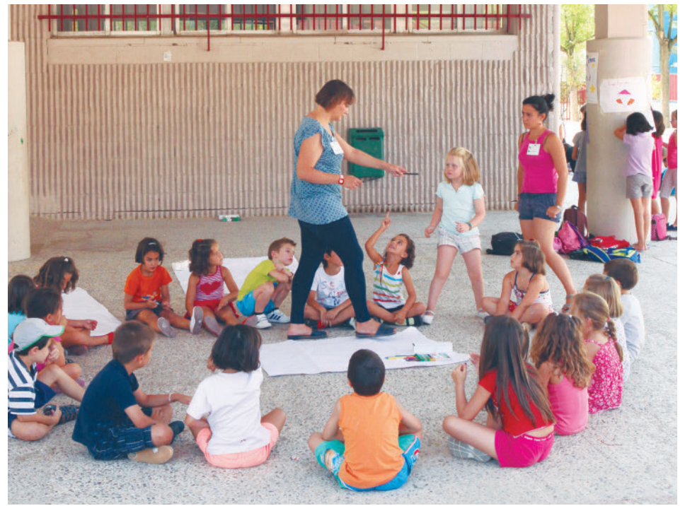
Imagen de archivo de una de las colonias celebradas años atrás

El periodo de inscripción se abrirá este próximo lunes,