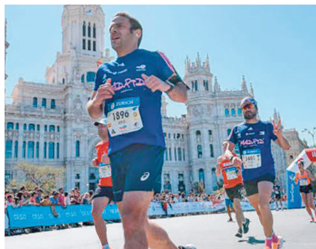
Imagen de una edición anterior a su paso por Cibeles

La carrera cuenta con uno de los circuitos más bellos del calendario internacional, ya que partiendo del Paseo de la Castellana (a la altura de Gregorio Marañón), permite contemplar el estadio Santiago Bernabéu, la Cuatro Torres