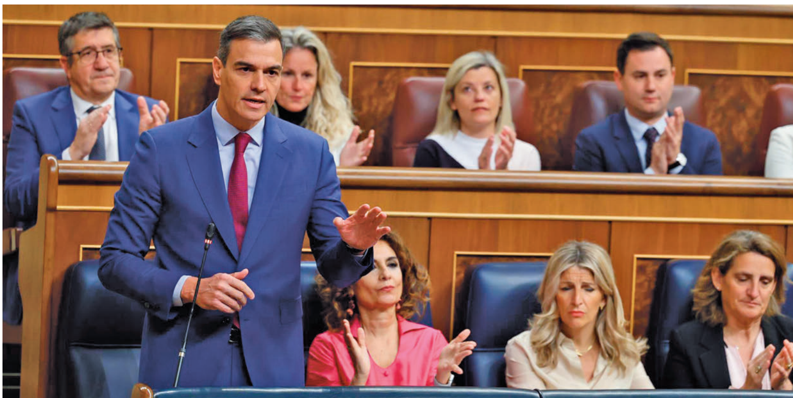
El presidente del Gobierno, durante una intervención en el Congreso