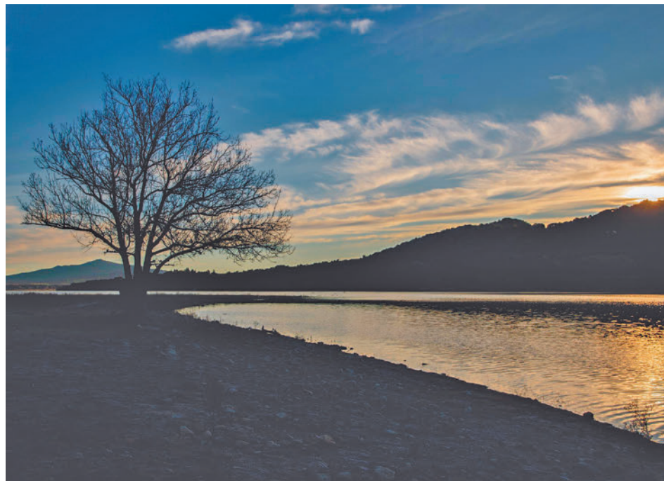
Un paraje de Manzanares El Real

Mad Rural es un proyecto que agrupa las Sierras Norte, Oeste y de Guadarrama y la zona de Las Vegas y la Alcarria madrileña, las cuales suman 110 municipios donde se combinan naturaleza y ruralidad. Los mensajes giran en torno al disfrute de la natura-