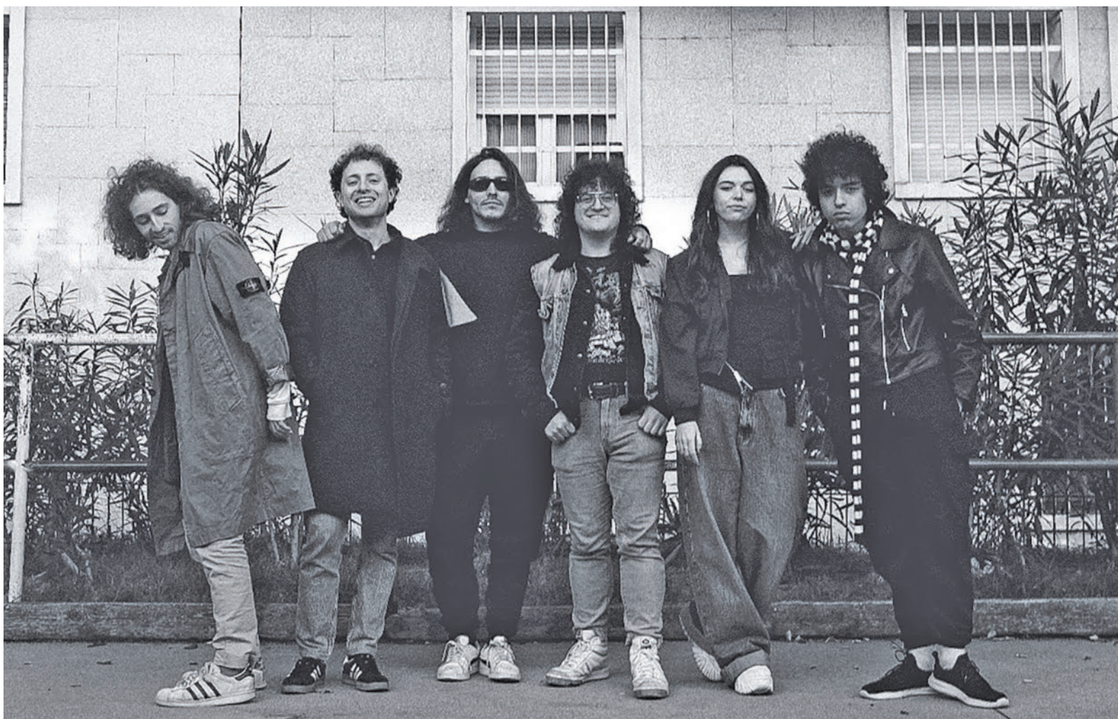
Foto de la formación actual de la banda madrileña