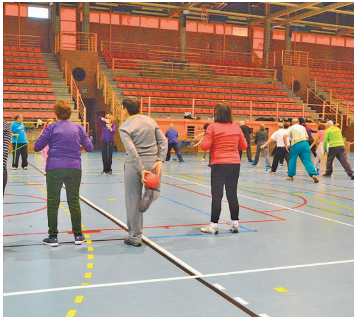
La siguiente incluirá conocer el Puerto de los Leones y Cabeza de Lijar

Apostando por el envejecimiento activo y por la lucha contra la soledad no deseada se ha puesto en marcha el plan de senderismo dirigido a las personas mayores. Los vecinos ya han tenido la oportunidad de conocer, entre otros lugares, Valsaín, Pesquerías Reales, Boca del Asno, el Río Eresma, Chorrera de San Mamés, Abedular de Cauce y la Cascada de Mojo-