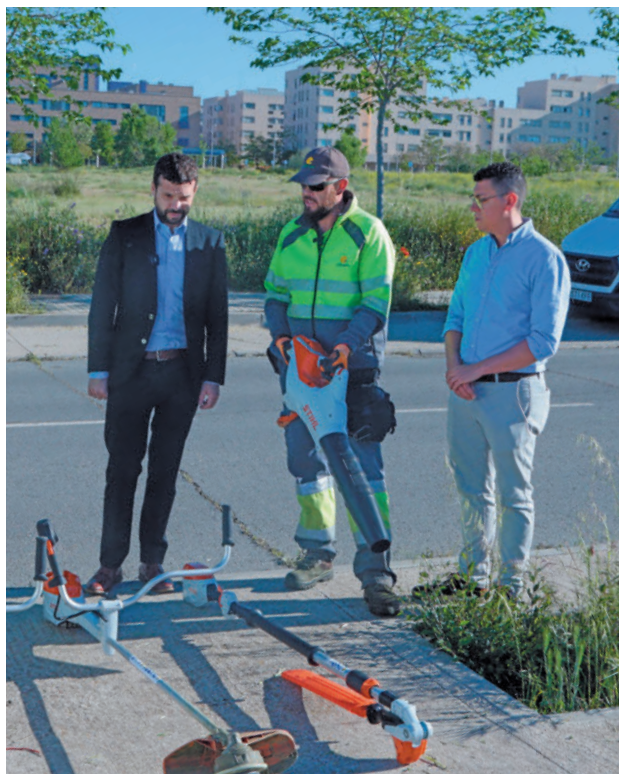
Entre la maquinaria hay desbrozadoras y segadoras

Además, entre las novedades de este año está el cambio de la maquinaria por otras herramientas que usan la energía eléctrica como motor, que son más respetuosas con el medioambiente, que contaminan menos y hacen menos ruido. “Vamos a seguir apostando por la innovación tecnológica y la calidad para seguir siendo referentes en este sentido y en la lucha por reducir la huella de carbono”, ha recalcado el segundo te-