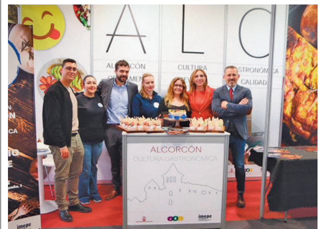
Se busca atraer inversiones y que se reconozca la hostelería

Todas las actividades tienen indicado el grado de dificultad del 1 al 4 en función de la longitud, desnivel acumulado y complicación técnica. Para los interesados, existe además una ficha informativa de cada actividad con los detalles, que también estará visible en los centros.