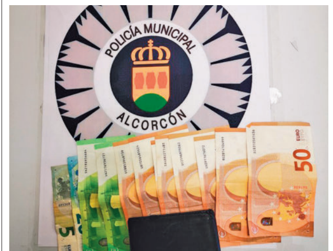
Un vecino honrado hizo entrega de dicha cartera POLICÍA LOCAL

Sobre los diferentes aspectos del servicio, el que obtiene mayor nota es el número de contenedores (7,1), seguido de su ubicación (7) y el horario de recogida (6,9). Tras ellos, la frecuencia y el vaciado, la capacidad de los contenedores y su mantenimiento y conservación son los siguientes mejor valorados (6,8), para terminar con el compromiso de la ciudadanía con el reciclaje y recogida y limpieza de residuos (6,6).