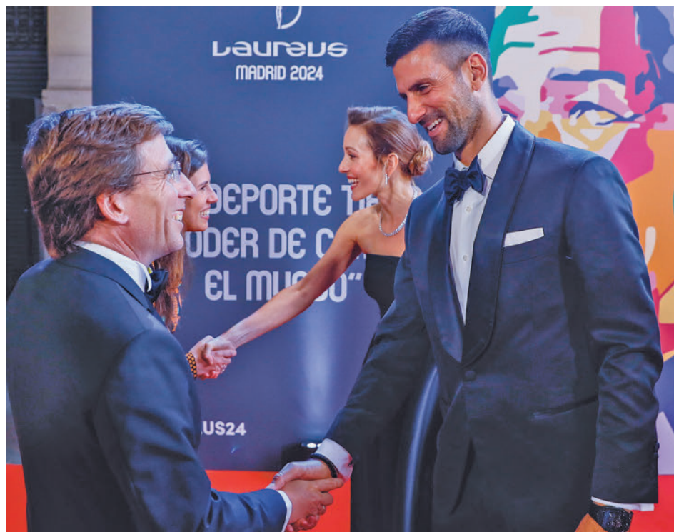
El alcalde de Madrid, José Luis Martínez-Almeida, saluda al tenista serbio Novak Djokovic

La Galería de Cristal del Palacio de Cibeles, sede del Consistorio madrileño, reunió a un gran elenco de deportistas de talla mundial, además de a una nutrida representación de personalidades internacionales de la política, la