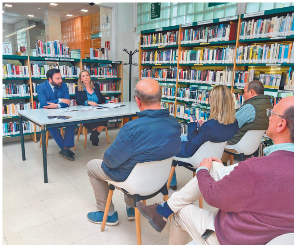
La presentación de la programación, el 23 de abril en la Biblioteca Municipal Dámaso Alonso

Toda la actualidad de los distritos de Madrid, en nuestra web