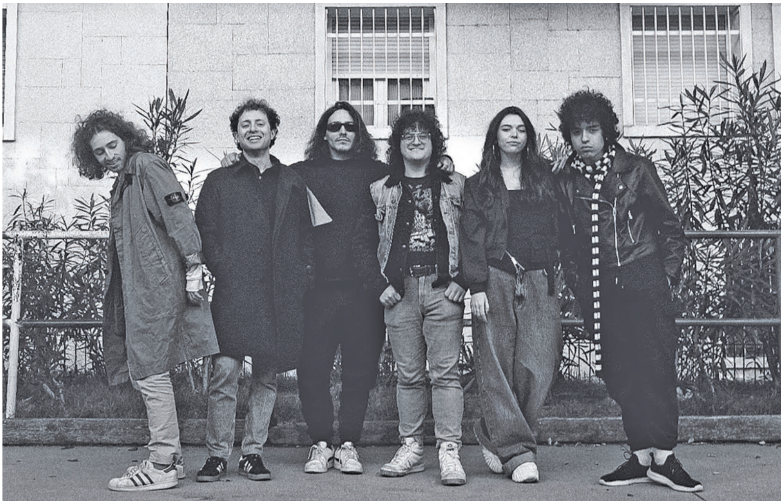
Foto de la formación actual de la banda madrileña