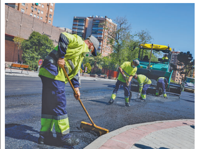
Varios operarios trabajan en la calle de Jazmín

Esta iniciativa ha permitido la reforestación de 1.800 metros cuadrados, situados en la confluencia de la calle de Fuente Carrantona y la Avenida de Daroca. Gracias a la colaboración de la Fundación Juan XXIII, el equipo ha estado integrado por cuatro personas en riesgo de vulnerabilidad psicosocial, de entre 20 y 34 años.