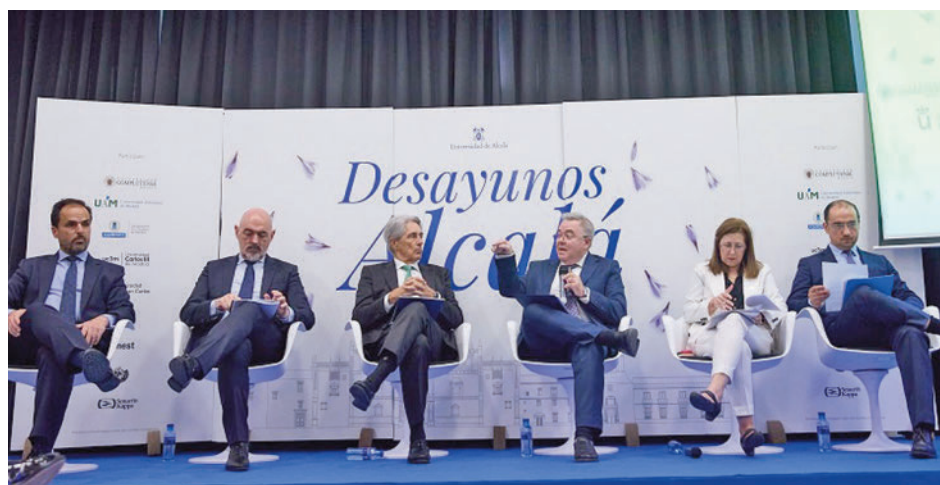
Los rectores de las universidades madrileñas

Universidad Politécnica de Madrid (UPM), Universidad Complutense de Madrid (UCM), Universidad Autónoma de Madrid (UAM), Universidad Rey Juan Carlos (URJC) y Universidad Carlos III de Madrid (UC3M), han reivindicado el papel de estas instituciones para generar valor e impacto social, una fun-