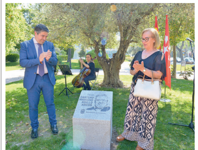
Descubrimiento del monolito

Ambos centros han adquirido un robot que puede ser dirigido por los alumnos para distintas aplicaciones. Cuenta con sensores y actuadores que responden a las instrucciones que se le pueden introducir de muy diferentes maneras. Así, reacciona a la información que recogen de su entorno. Se trata de un robot que, además, está disponible para que cualquier otro centro educativo pinteño pueda solicitar el préstamo gracias al Programa Galiana del Ayuntamiento.