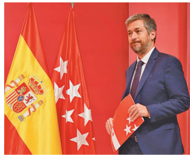
Miguel Ángel García, tras el Consejo de Gobierno