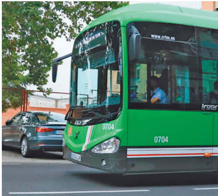
La cabecera estará junto a Getafe Central AYUNTAMIENTO DE GETAFE

La cabecera de la nueva línea estará junto a Getafe Central, en la calle Ferrocarril, y las paradas se efectuarán al lado de la estación de Metro sur de Alonso de Mendoza y