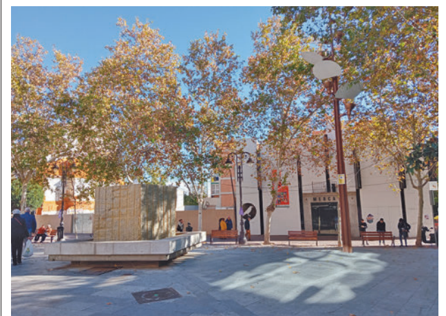
Los creadores de La Carpa expondrán en el Espacio Mercado

Contará con 10 expediciones por sentido de lunes a viernes laborables. El horario será por las mañanas de lunes a jueves de 7:30 a 9:30 horas, con una frecuencia de paso de 30 minutos, y los viernes de 6:30 a 9:30 horas de entre 30 y 60 minutos. Por las tardes, de lunes a jueves, el horario de esta línea será de 14:15 a 18:45 horas, con una frecuencia de entre 60 y 90 minutos; y los viernes, de 14:10 a 18:10 horas, con una frecuencia de 60 minutos.