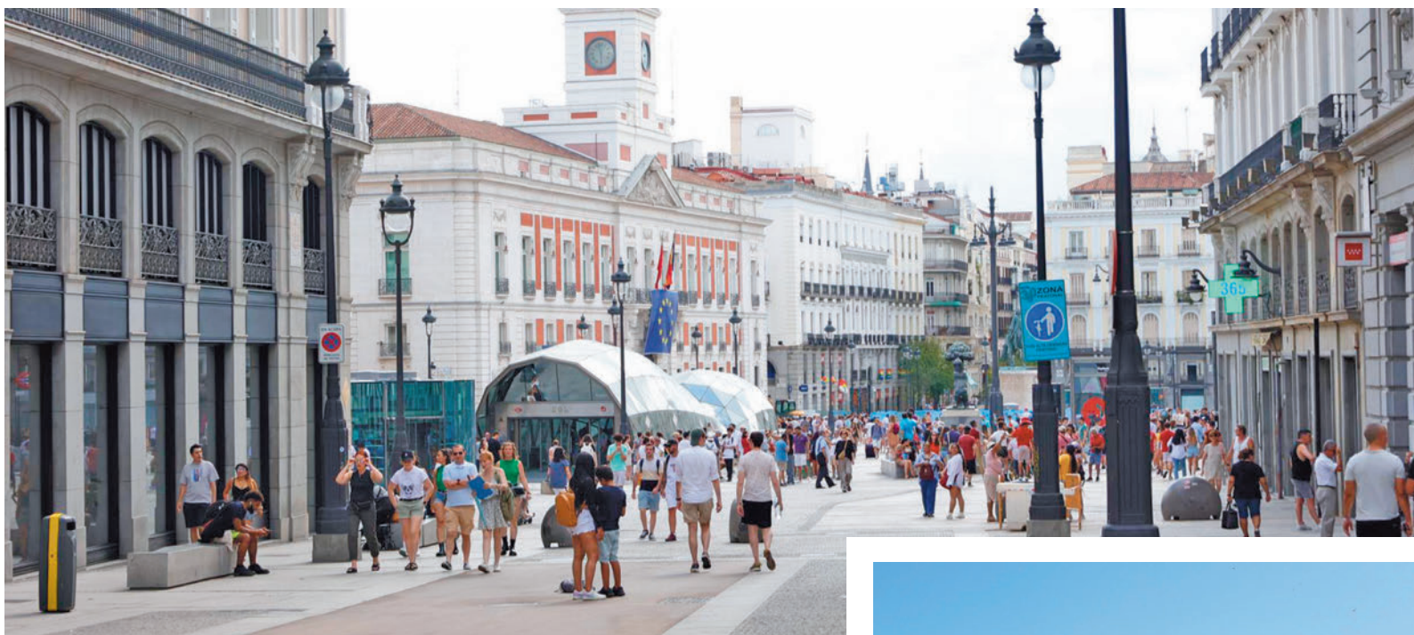
Zona peatonal en la Puerta del Sol