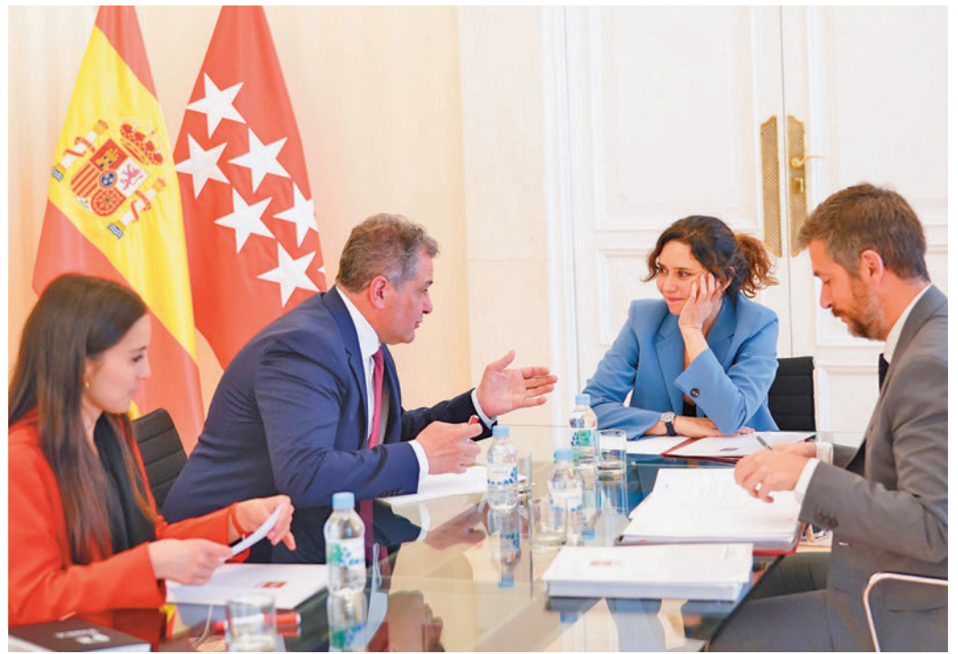
Un momento de la reunión entre Ayuso y Jurado

Además, para el periodo comprendido entre los años 2022 y 2026 el Programa de Inversión Regional (PIR) que lleva a cabo la Comunidad de Madrid ha aumentado su dotación presupuestaria casi un 4% respecto al plan anterior, alcanzando casi los 10 millones de