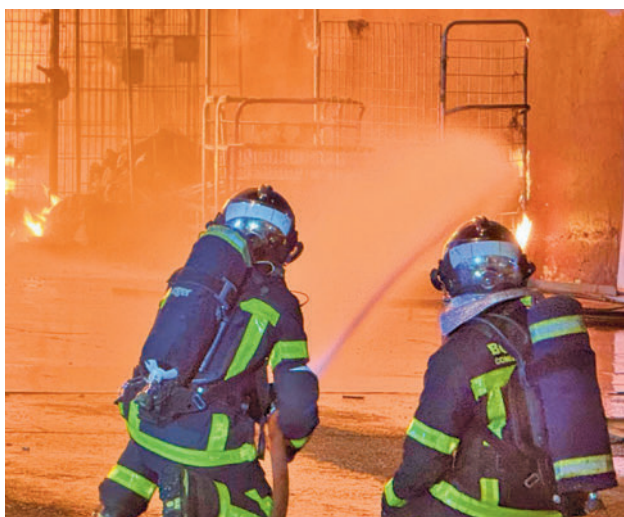
Bomberos de Madrid apagando un fuego