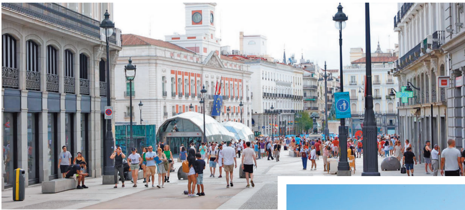
Zona peatonal en la Puerta del Sol