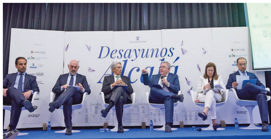
Los rectores de las universidades madrileñas

Universidad Politécnica de Madrid (UPM), Universidad Complutense de Madrid (UCM), Universidad Autónoma de Madrid (UAM), Universidad Rey Juan Carlos (URJC) y Universidad Carlos III de Madrid (UC3M), han reivindicado el papel de estas instituciones para generar valor e impacto social, una fun-