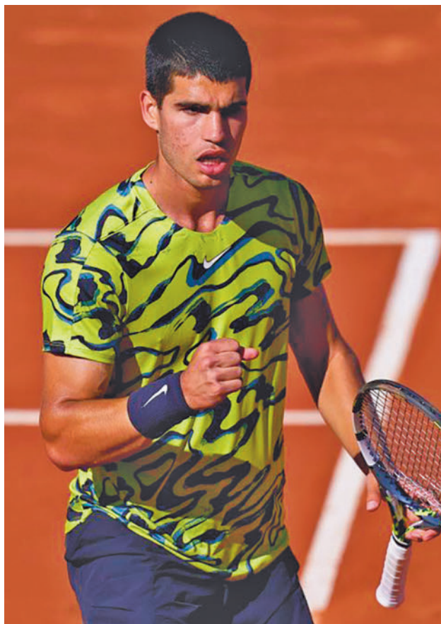
Alcaraz se alzó con el título en 2022 y 2023

EN EL GRUPO DE FAVORITOS TAMBIÉN ESTÁ EL NÚMERO UNO, NOVAK DJOKOVIC