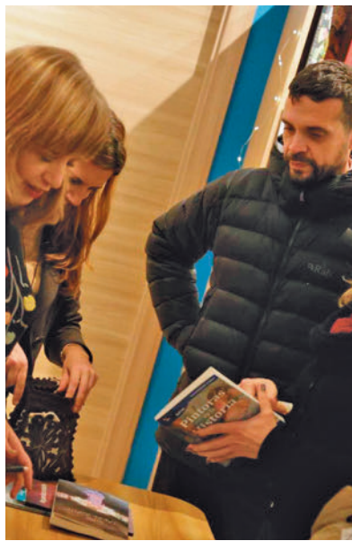
Noche de los Libros

A las 18 horas en la Biblioteca Municipal José Hierro se desarrollará el taller 'Bibliomochilas', que consistirá en pintar una bolsa de tela con el fin de que puedan divertirse y darle uso para llevar ahí los libros de préstamo a casa. "Además con ello se promue-