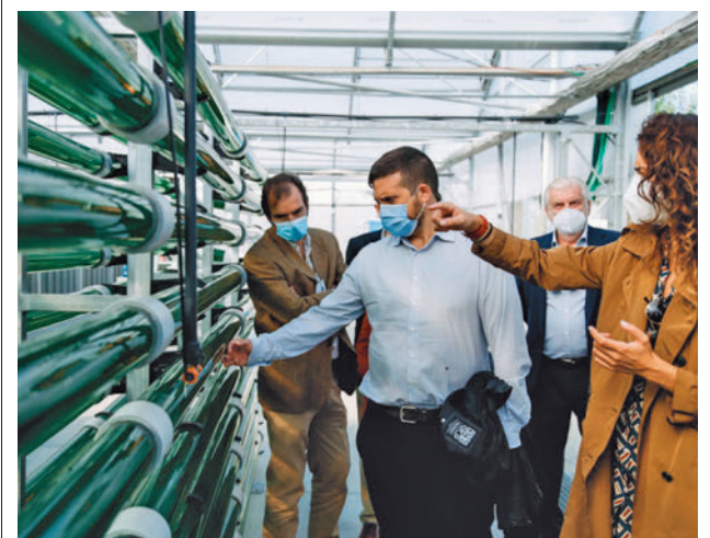
El nuevo espacio será el primero con fotobiorreactores

El Ayuntamiento y la Universidad Rey Juan Carlos han firmado un protocolo general para el desarrollo de proyectos de Aprendizaje-Servicio (ApS), lo que supone aunar el conocimiento del alumnado en las clases con el desarrollo y la aplicación de esas competencias en la sociedad, mediante su participación en proyectos sociales. El objetivo fundamental es promover que adolescentes y jóvenes formen parte de la vida del municipio, mediante acciones solidarias diseñadas entre los centros educativos y las entidades social. Se trata de una metodología en crecimiento a la que ya se han incorporado en la localidad hasta 13 institutos, 3 centros de Educación Infantil y Primaria, 3 universidades (URJC, UNED y UCM) y 20 entidades sociales.