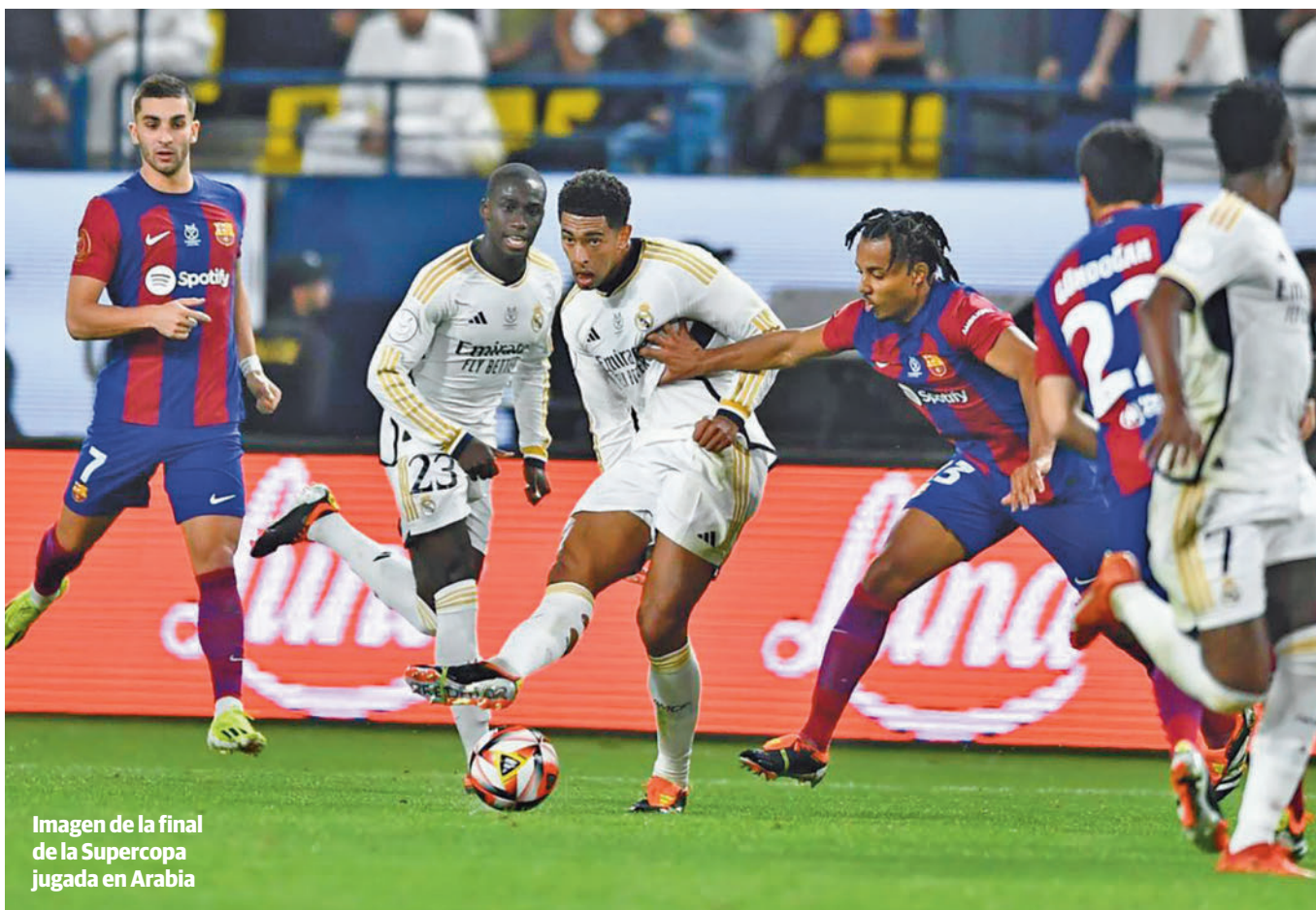
Imagen de la final de la Supercopa jugada en Arabia