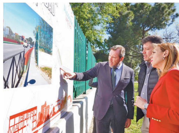
El ministro visitó las actuaciones que están llevando a cabo

de Arte en vidrio de Alcorcón (MAVA) se une también con la actividad 'Mi Castillo está dentro', que incluye visita guiada y taller, abriendo así sus puertas a los vecinos.