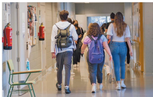
Jóvenes yendo a clase

El primero de ellos se llama ‘Prevención de los desa-