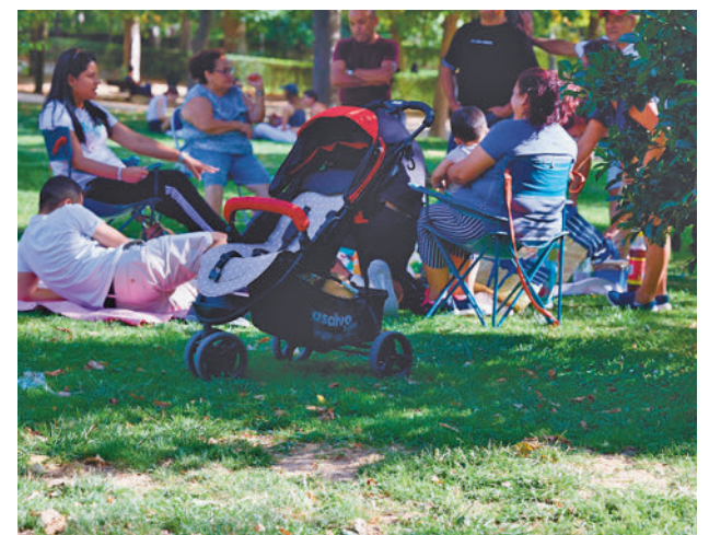
Madrid tuvo más nacimientos en febrero

El INE ha publicado este miércoles el número de defunciones hasta la semana 13 del año y que arroja en la Comunidad de Madrid la cifra de 848 decesos entre los días 18 y 25 de marzo (8.233 en España).