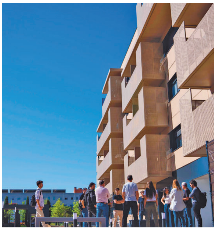
Representantes de Más Madrid se reunieron con los vecinos MÁS MADRID

Desde la Consejería de Vivienda, Transporte e Infraestructuras, que defendió el plan frente a las críticas recalando que "no se trata de vi-