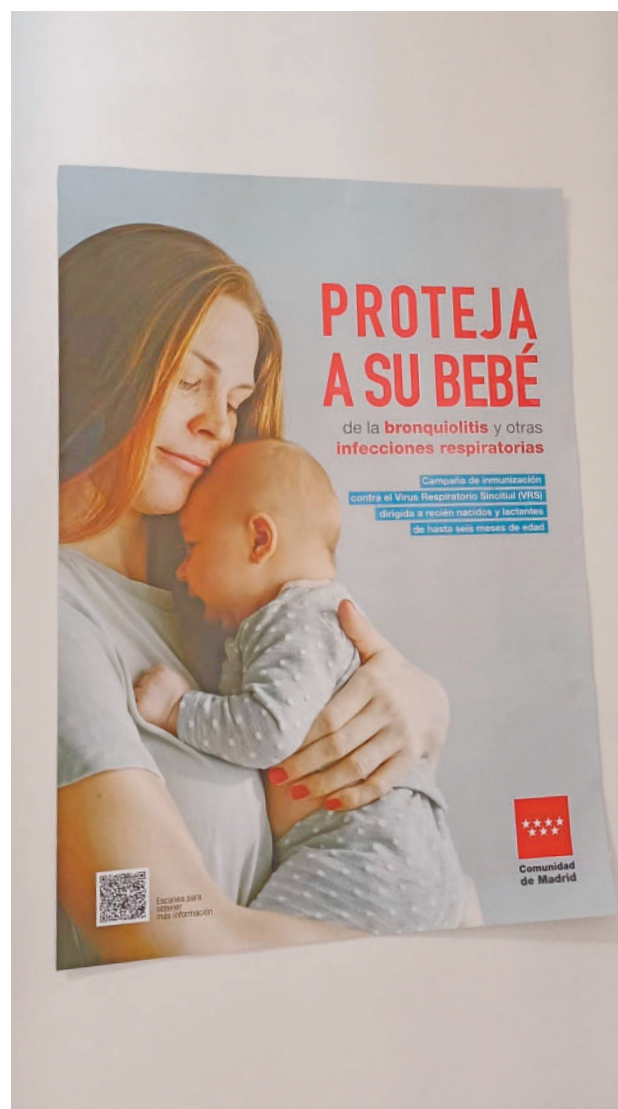
Cartel que animaba a los padres a vacunar a sus hijos

Más de 44.000 niños menores de seis meses se vacunaron contra el virus respiratorio sincitial, un 86% de la población diana • También bajaron un 65% las visitas a Atención Primaria