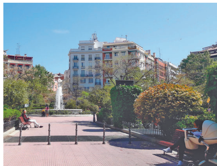
Puerta del Sol y Plaza de Olavide: Para realizar el estudio, los investigadores hicieron 750 entrevistas a vecinos y otras 38 a comerciantes de dos zonas peatonalizadas del centro de Madrid: los entornos de la Puerta del Sol y de la Plaza de Olavide, ambas en el distrito Centro.

“Peatonalizar es beneficioso para la salud, el medio ambiente, la movilidad e incluso la economía, sin embargo, a menudo hay gran oposición ciudadana a este tipo de medidas. Esto dificulta su implementación, más aún cuando son de gran alcance y per-