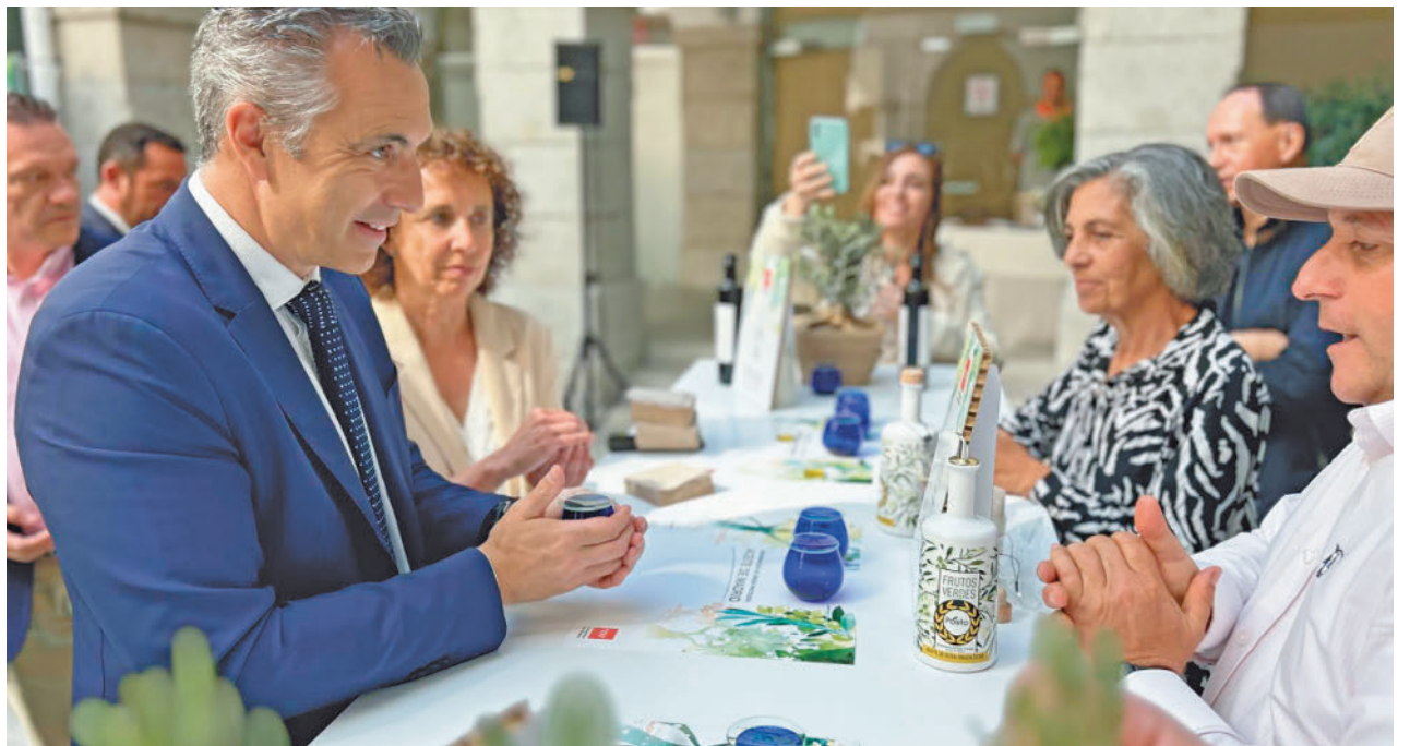
Presentación del nuevo sello para el aceite madrileño

Hectáreas De olivar son los que tiene en el actualidad la Comunidad de Madrid