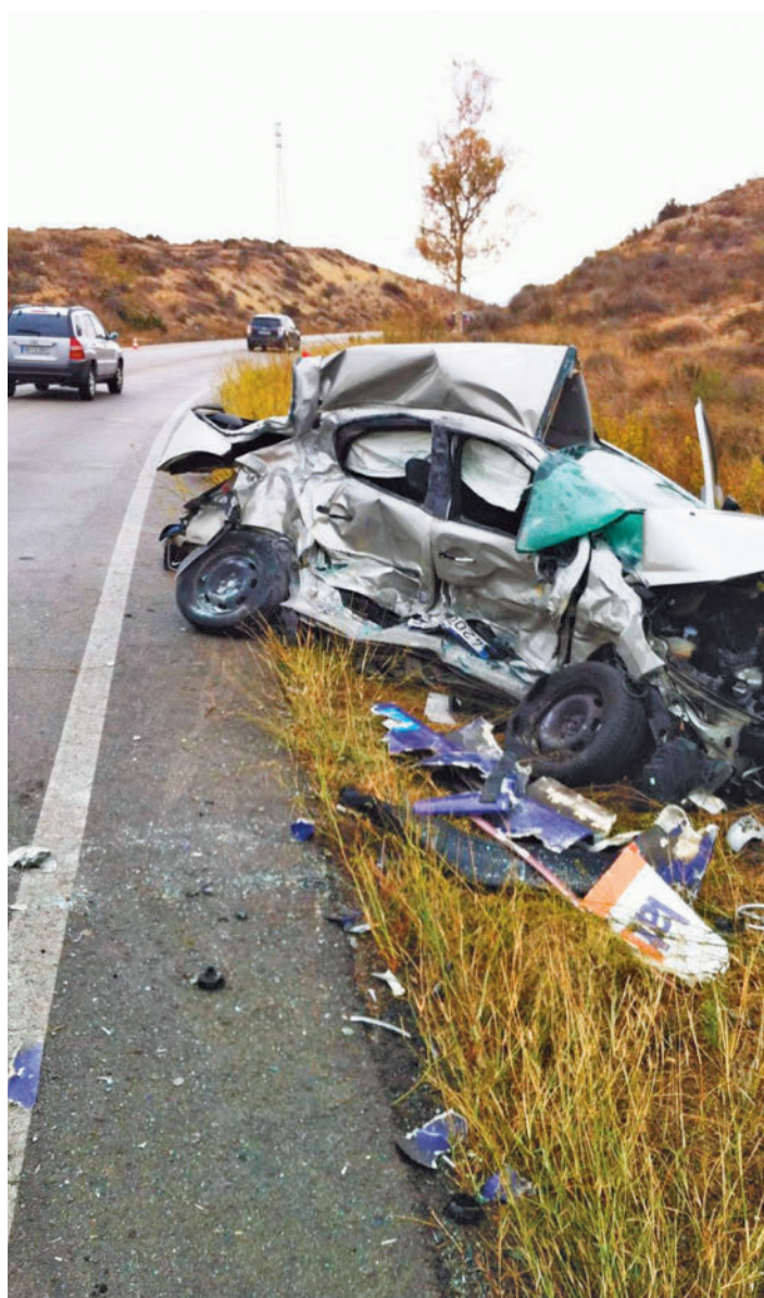
Las carreteras convencionales tienen más accidentes

El estudio propone medidas de bajo coste, como la instalación de barreras para reforzar la seguridad de los usuarios más vulnerables como los motoristas, medida que contribuiría a reducir hasta el 47% de las lesiones estas carreteras. También destacan las guías sonoras longitudinales, que contribuirían a reducir hasta el 21% de las lesiones en este tipo de vías, así como captafaros reflectantes, también denominados “ojos de gato”, elementos clave en la señalización de las carreteras porque contribuyen de forma decisiva a mejorar la visibilidad de los conductores y a reducir la siniestralidad, en concreto un 37%.