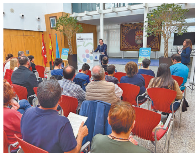
Acto de la Semana de la Salud

El regidor explicó que desde el área de Salud Municipal "se trabaja para ofrecer oportunidades para mantener hábitos saludables a los vecinos de Leganés y llegar a toda la población, infancia, jóvenes, mayores, mujeres, personas con discapacidad o a la población inmigrante. A todo ello se suma ser una ciudad con un elevado número de aso-