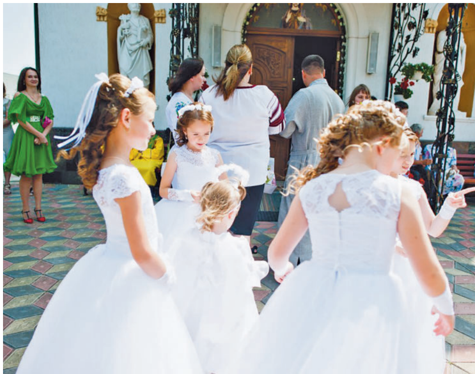
Las comuniones son cada vez más caras

los regalos y fotografías son los aspectos que mayor gasto generan. En el caso de una niña, en cuanto al vestido, los precios oscilan entre los 80 y los 1.500 euros. A estos hay que sumar los complementos para el pelo, bolsito, guantes, muda, calcetines, zapatos o medalla de oro, que pueden rondar entre los 184 y los 901 euros. Respecto al gasto de peluquería, un peinado normal