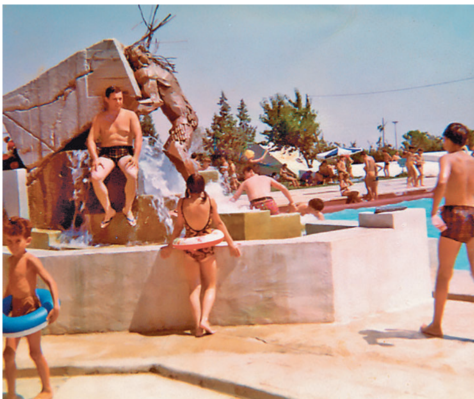
Imagen de archivo de la antigua piscina de Solagua