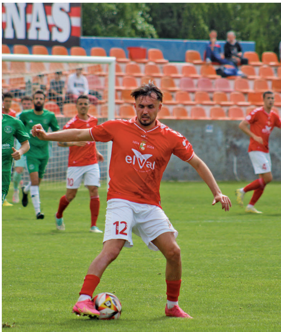
El Alcalá sigue con su mejoría y ya es cuarto en la clasificación RSD ALCALÁ

A esa lucha por el 'play-off' también le añaden emoción otros dos equipos. Las Rozas