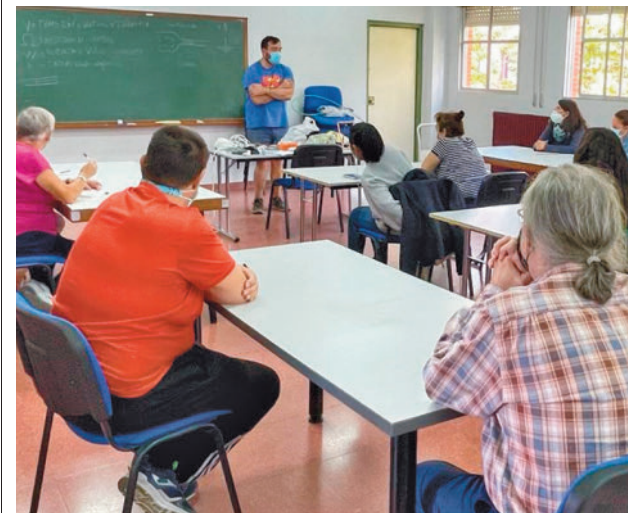
Ediciones anteriores de los talleres

Las inscripciones están disponibles desde el 3 de abril hasta cubrir plazas en la web del Ayuntamiento.