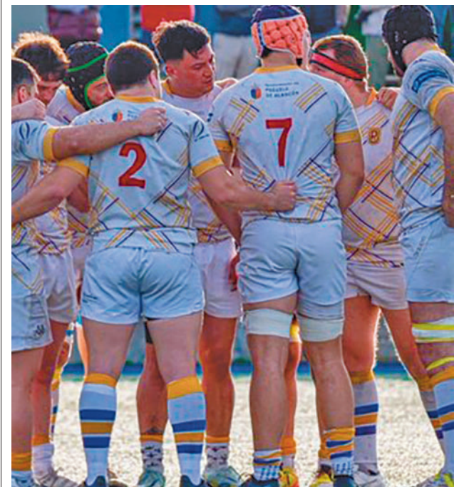
Última jornada de la fase regular

En el Grupo A, el Silicius Alcobendas Rugby llega a la última jornada pleno de moral después de un triunfo de prestigio ante el VRAC Quesos Entrepinares. En el caso de ganar este domingo (12:30) en Las Terrazas al Burgos puede asaltar la cuarta plaza.