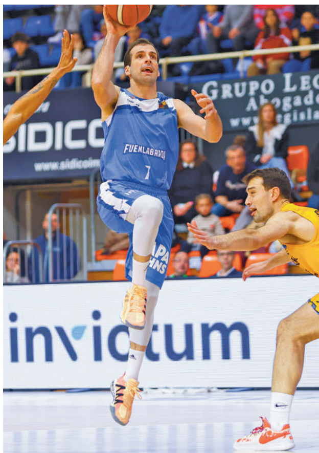
Nueva cita en el Fernando Martín

EL EQUIPO DE TONI TEN TIENE AL REAL BETIS A TIRO DE UN SOLO TRIUNFO