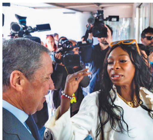
Zaplana, a su llegada al juzgado

EL PERIÓDICO GENTE NO SE RESPONSABILIZA NI SE IDENTIFICA CON LAS OPINIONES QUE SUS LECTORES Y COLABORADORES EXPONGAN EN SUS CARTAS Y ARTÍCULOS