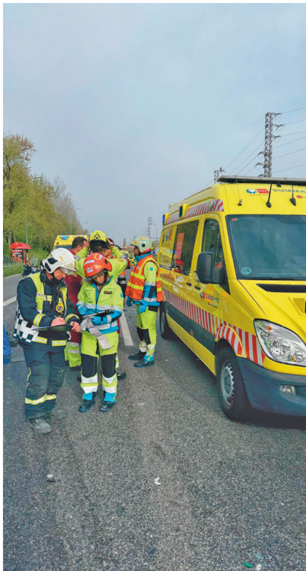
Lugar en el que se produjo el accidente

Los servicios sanitarios también tuvieron que atender al conductor de la furgoneta contra la que chocaron, que presentaba una crisis de ansiedad por la que tuvo que ser trasladado al Hospital Se-