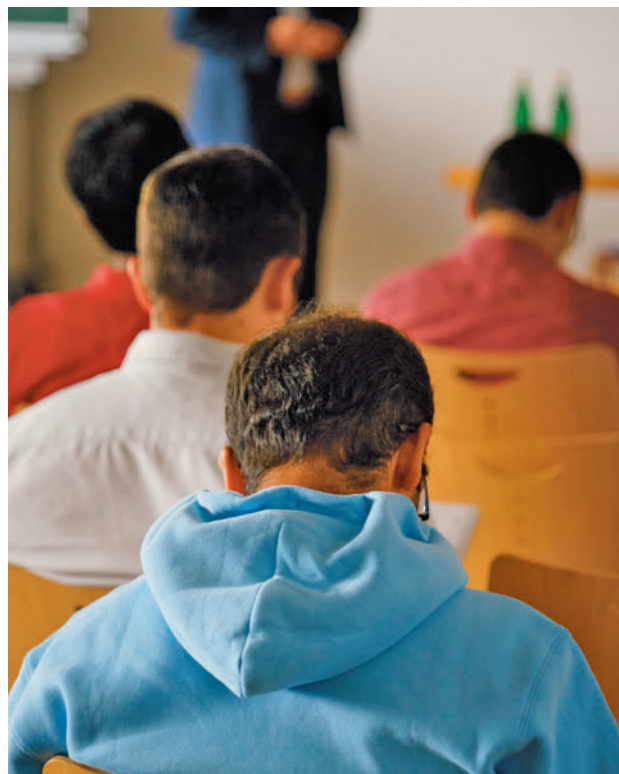
Las 'Fuenbecas' se destinan a la adquisición de libros de texto

El plazo para solicitarlas de forma presencial permanecerá abierto hasta el próximo 23 de abril, el 22 en el caso de que se haga 'online'. Quienes vayan a pedirlo deberán tener en cuenta los requisitos que se piden, tales como que la renta familiar que se toma como referencia es de 46.200 euros y que los estudiantes tienen que estar empadronados en Fuenlabrada a 1 de enero de 2024 y