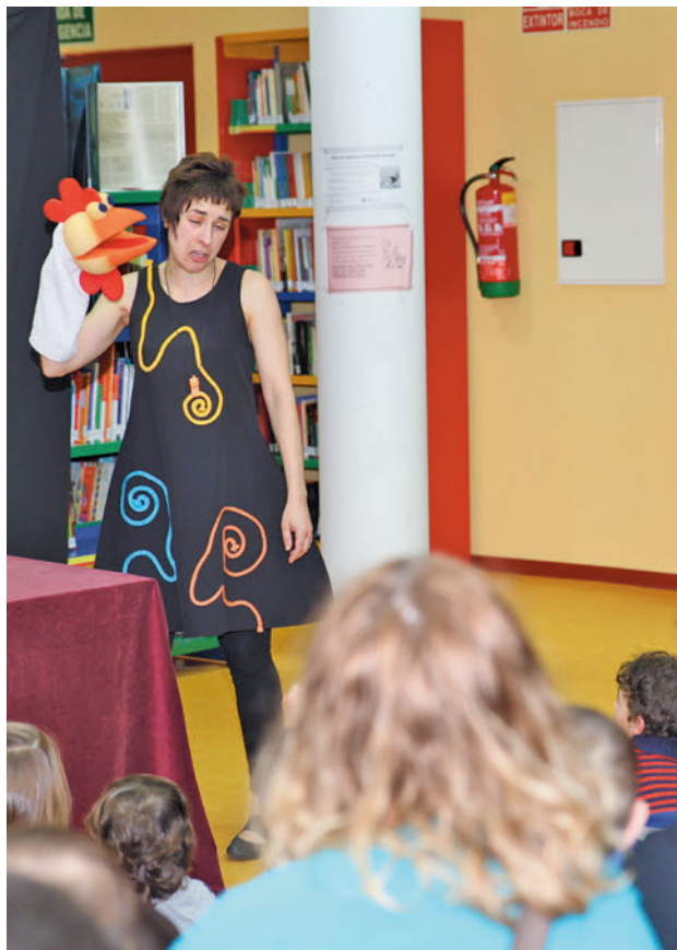
Con estas sesiones se busca crear nuevos lectores

EL VIERNES 19, SESIÓN DE CUENTACUENTOS CON 'LA LUZ DE LUCÍA'