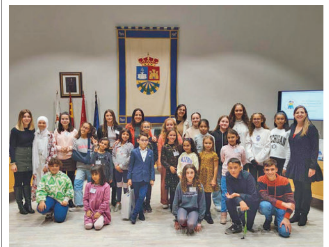
Su labor es orientar la acción hacia sus necesidades

Entre otras iniciativas, el Plan contempla la transformación de "espacios urbanos en entornos amigables" que permitan la autonomía de las personas mayores. En cuanto a los ámbitos, tratan la lucha contra la brecha digital, impulsar una estrategia contra la soledad, el fomento del encuentro intergeneracional y el impulso de la participación a través de consejo del mayor. Además, se fomentará la participación del colectivo en la planificación de las mejoras de los barrios y se promoverá un modelo urbano accesible y peatonal.