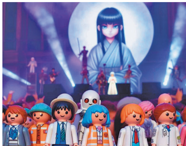
Se unen el anime y el K-Pop A.MONTANA S.L.

la actualidad, así como un desfile de cosplay donde los fans podrán lucir sus mejores trajes inspirados en sus personajes favoritos del anime. Además, habrá sesiones de karaoke para aquellos que deseen demostrar sus habilidades vocales, stands temáticos llenos de mercancía exclusiva, emocionantes premios y regalos, entre otras cosas.