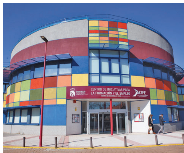
Los planes permitirán la contratación de 74 personas

Toda la actualidad de Fuenlabrada, en nuestra página web.