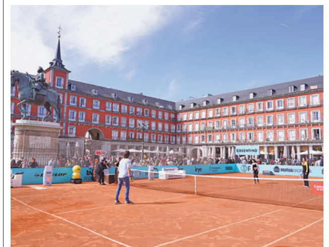
Un momento de la inauguración oficial de la pista

A lo largo de este año, hasta 65.000 personas podrán participar en Pasea Madrid, una actividad que tiene como objetivo difundir y acercar el patrimonio cultural de la gran urbe a la ciudadanía.