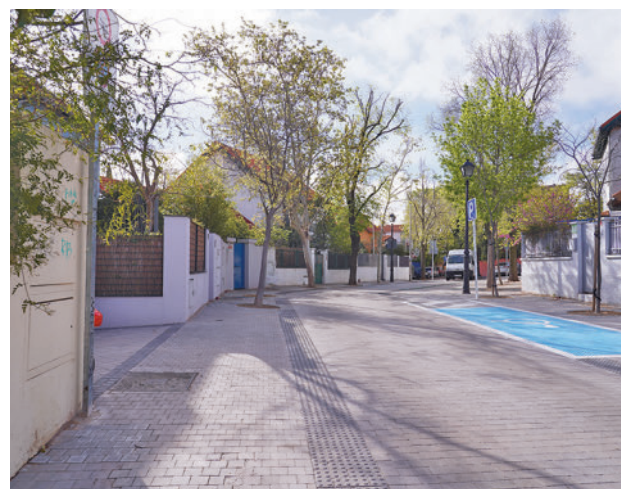
Una de las calles mejoradas en la primera fase de la operación

Fuentes municipales explican que la operación contempla la implantación de plataforma única en todas las calles afectadas con el objetivo de favorecer la vialidad peatonal y cumplir con la normativa de accesibilidad.