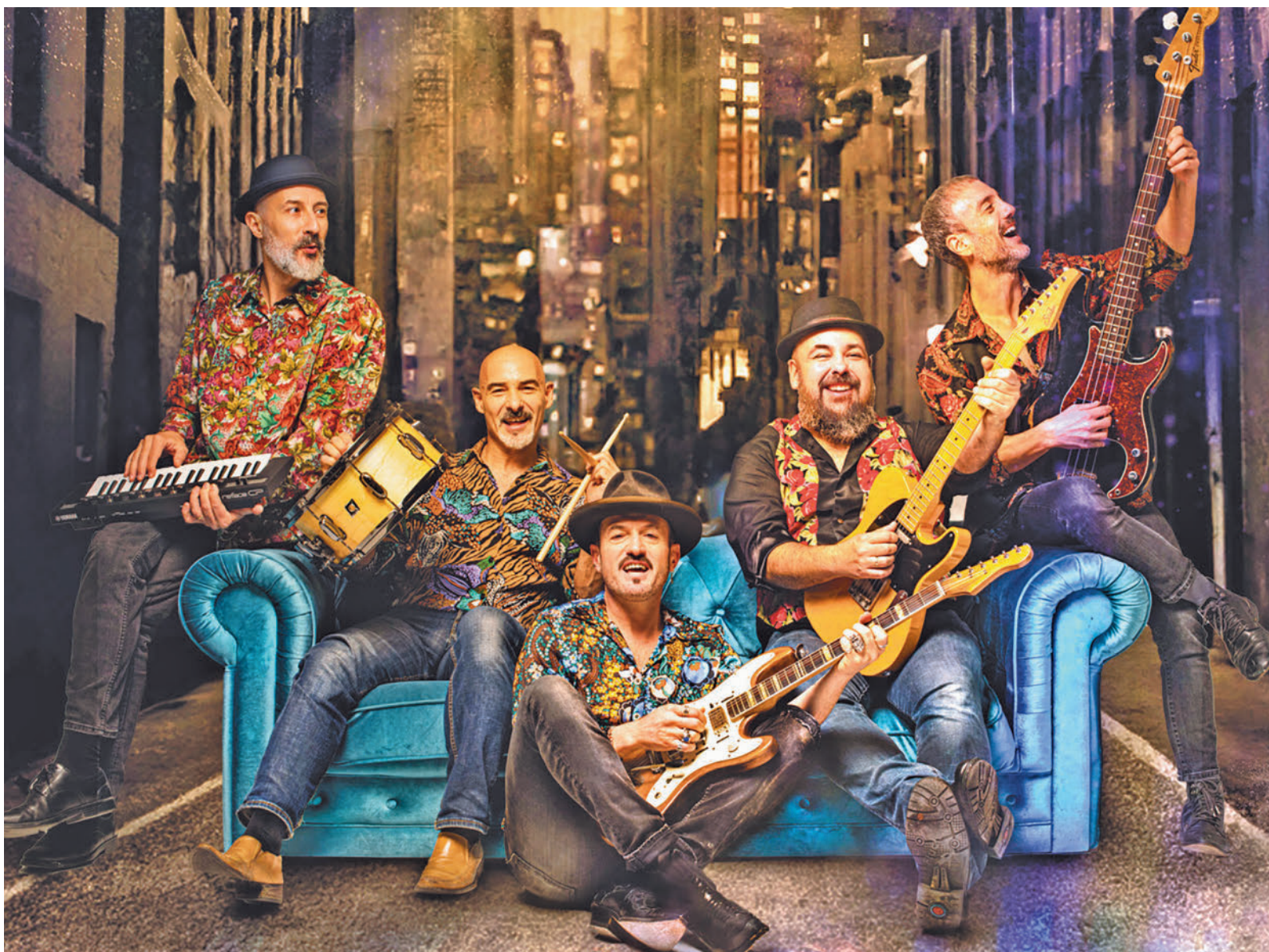
Foto promocional de la banda