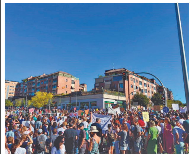
Una de las protestas ciudadanas

Toda la actualidad de los distritos de Madrid, en nuestra web