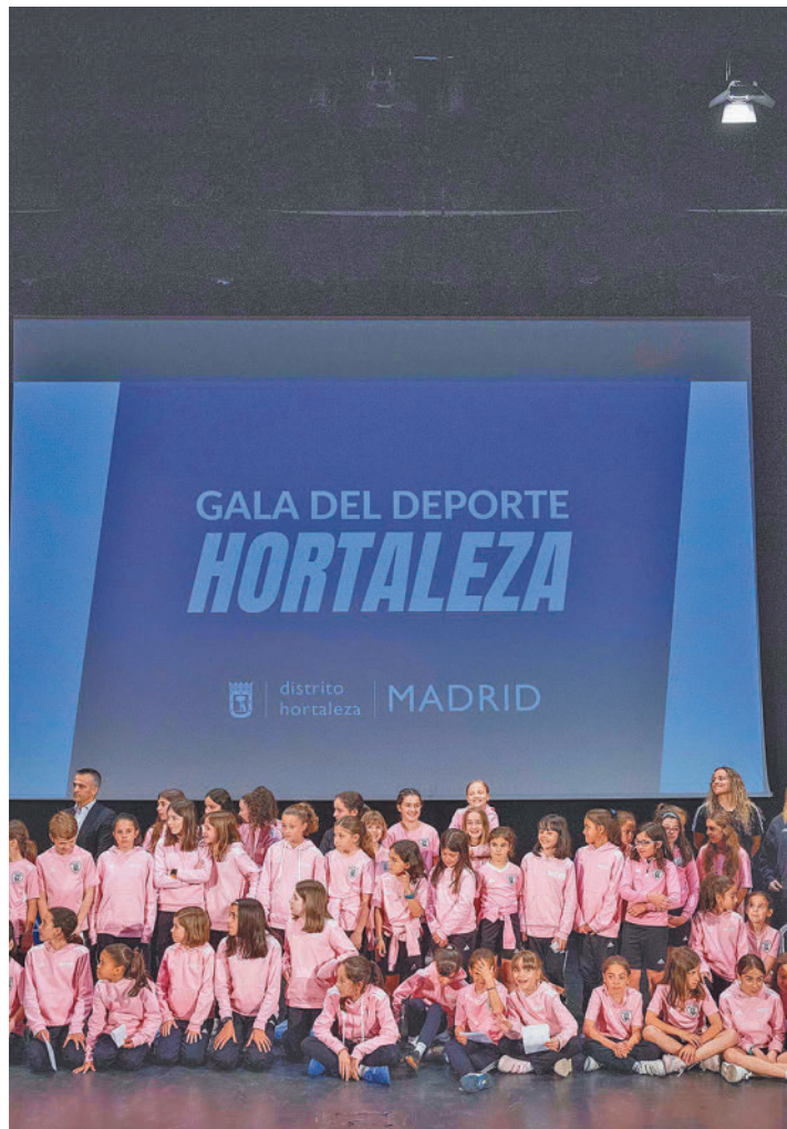
La representación del Madrid Club de Fútbol Femenino

En la categoría de deporte colectivo femenino recibió el premio el Madrid Club de Fútbol Femenino, que dio sus primeros pasos en el año 2010 en el Centro Deportivo Municipal Luis Aragonés, mientras que en categoría masculina