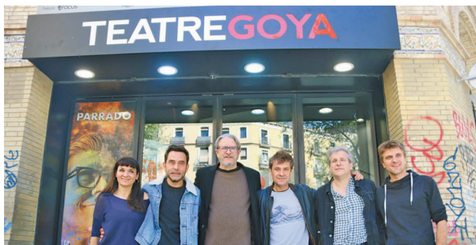
En aquest cas, es tracta d'un home que demana als seus amics col·laboració per ser pare.