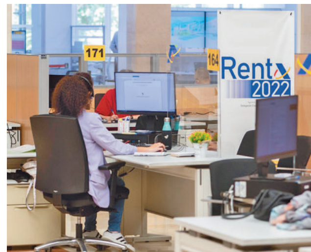
Oficina de la Agencia Tributaria