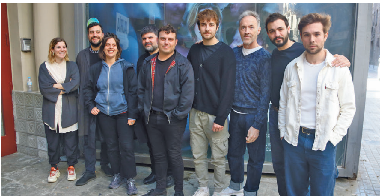
L'obra es va crear a partir de les transcripcions del mediàtic judici.