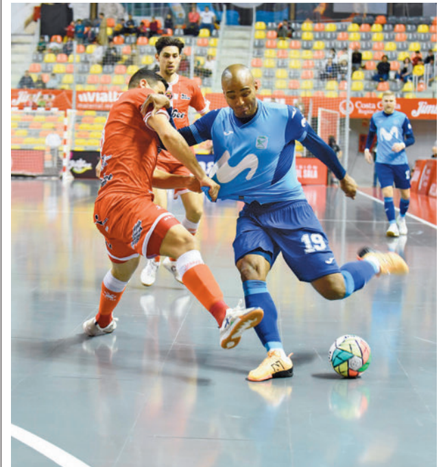
Fits fue protagonista en Cartagena MOVISTAR INTER

Para dar continuidad a esas buenas sensaciones, el conjunto torrejonero deberá derrotar este sábado 6 (13 horas) al Córdoba Patrimonio de la Humanidad, un equipo que se ha quedado en tierra de nadie, lejos de la octava plaza pero con un colchón suficiente como para no pasar apuros en la carrera por la permanencia. En la ida el Inter ya se impuso por un ajustado resultado de 1-2.