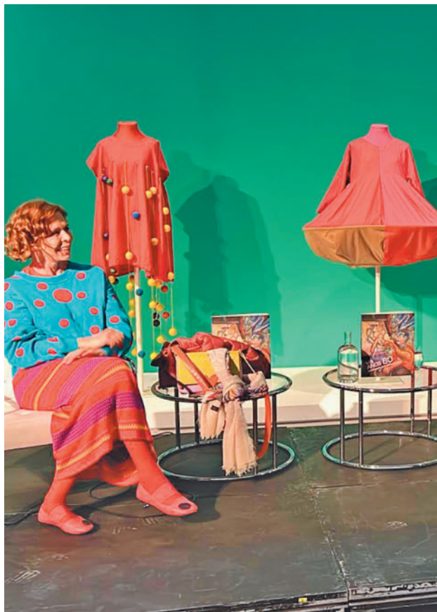
Dos trajes de Ágatha forman parte de la muestra

LA COLECCIÓN SE COMPONE DE HASTA 78 OBRAS DE DIVERSAS DISCIPLINAS