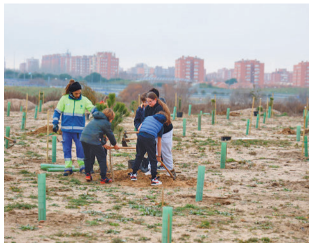
Los alumnos han contribuido en las plantaciones

Hace un par de semanas se llevó a cabo esta actividad en el Parque Norte del barrio de El Naranjo y en el camino de la Mula, donde los alumnos pusieron cerca de 400 ejemplares de encinas, quejigos, almendros, moreras y majuelos, entre otras.