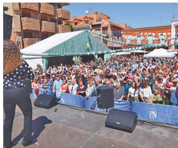
La música será parte de la fiesta

Toda la actualidad de Fuenlabrada, en nuestra página web.