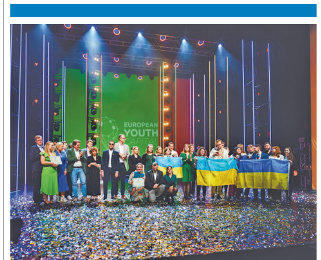
Finalistas por segunda ocasión AYUNTAMIENTO DE FUENLABRADA

Las acciones, realizadas con maquinaria manual y pesada, consisten en el tratamiento de los aparatos de vía (dispositivo que permite la ramificación y el cruce de trenes por diferentes vías) y de la de soldaduras y nivelación, con el fin de reforzar la fiabilidad de la infraestructura.