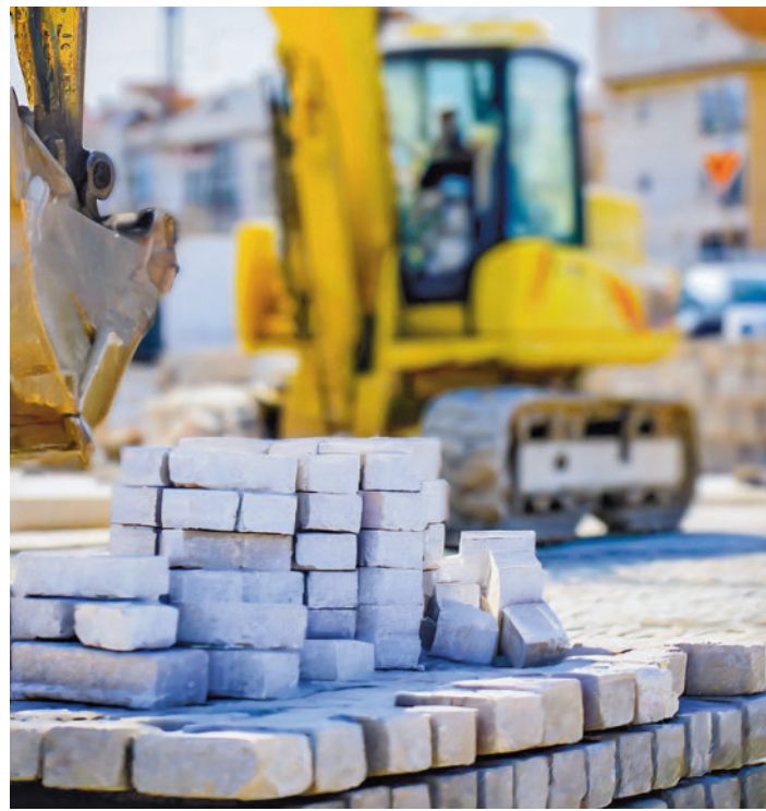
Obras en el municipio AYUNTAMIENTO DE FUENLABRADA

LAS OBRAS Y LAS MODIFICACIONES, DURARÁN ALREDEDOR DE DOS MESES