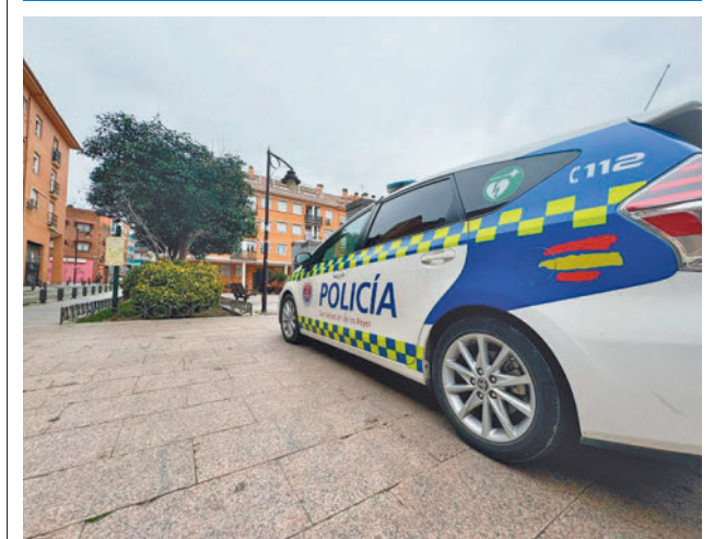
Policía Local de San Sebastián de los Reyes

En concreto, el lunes 8 desde las 9 horas se realizarán talleres y charlas en las carpas instaladas para tal fin en la Plaza Mayor. Desde el Hospital Infanta Sofía se abordarán asuntos como 'Conoce a tu anestesista', 'Prevención de accidentes pediátricos', 'Beneficios del ejercicio físico' o 'Embarazo y salud'.