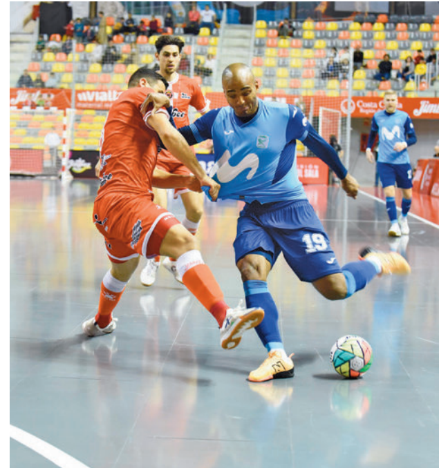
Fits fue protagonista en Cartagena MOVISTAR INTER

Para dar continuidad a esas buenas sensaciones, el conjunto torrejonero deberá derrotar este sábado 6 (13 horas) al Córdoba Patrimonio de la Humanidad, un equipo que se ha quedado en tierra de nadie, lejos de la octava plaza pero con un colchón suficiente como para no pasar apuros en la carrera por la permanencia. En la ida el Inter ya se impuso por un ajustado resultado de 1-2.