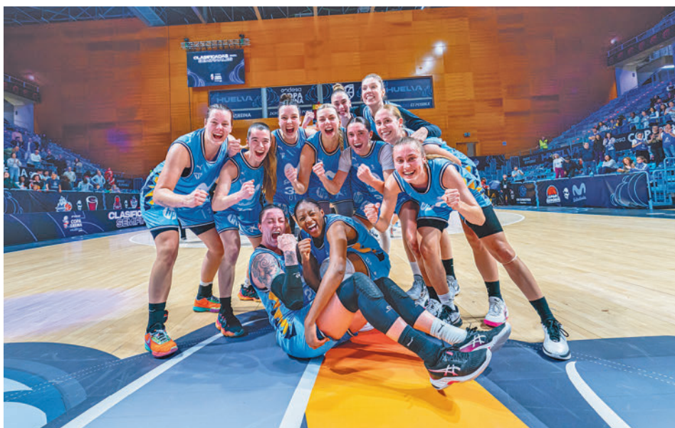
Las jugadoras del Estudiantes hicieron historia en la Copa de la Reina