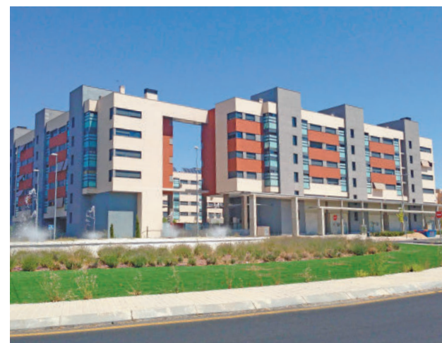
Vivienda de nueva construcción

La hipoteca media en España se sitúa en 141.912 euros en el cuarto trimestre (último dato disponible), con una cuota mensual de 707 euros, que en el caso de Islas Baleares alcanza los 1.284 euros al mes en promedio. Otras provincias con cuotas mensuales elevadas son Madrid (981 euros al mes), Málaga (893), Barcelona (868) y Guipúzcoa (807).