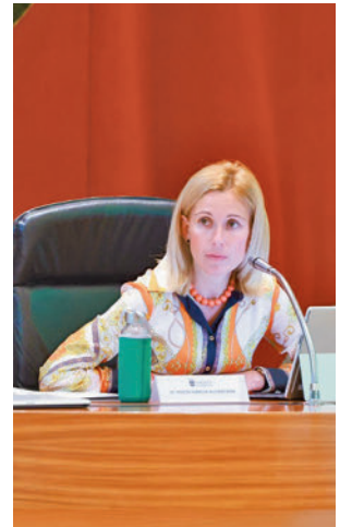
Último pleno ordinario