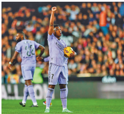
Vinícius Junior celebrando un gol en Mestalla

EL PERIÓDICO GENTE NO SE RESPONSABILIZA NI SE IDENTIFICA CON LAS OPINIONES QUE SUS LECTORES Y COLABORADORES EXPONGAN EN SUS CARTAS Y ARTÍCULOS