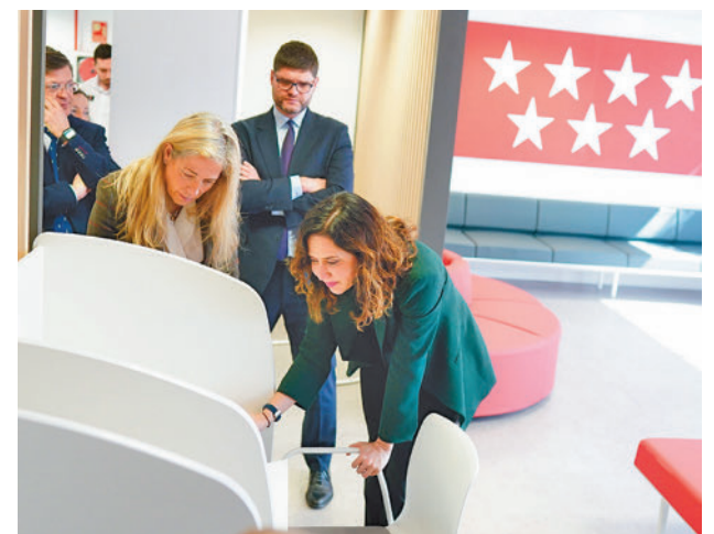
Díaz Ayuso, en la nueva Oficina de Empleo

Por otra parte, desde esta semana ya está operativo el servicio de cita previa telefónica para no tener que acudir físicamente a las oficinas.