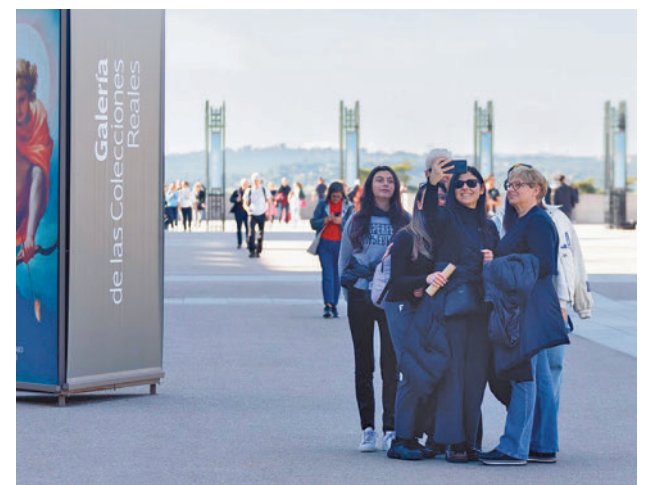
Turistas en Madrid

A nivel global, el turismo sigue imparables en España y anticipa lo que puede ser un nuevo año de récord. En los dos primeros meses del año, visitaron España un total de 9,8 millones de visitantes, lo que supone un incremento del 14% respecto a 2019.