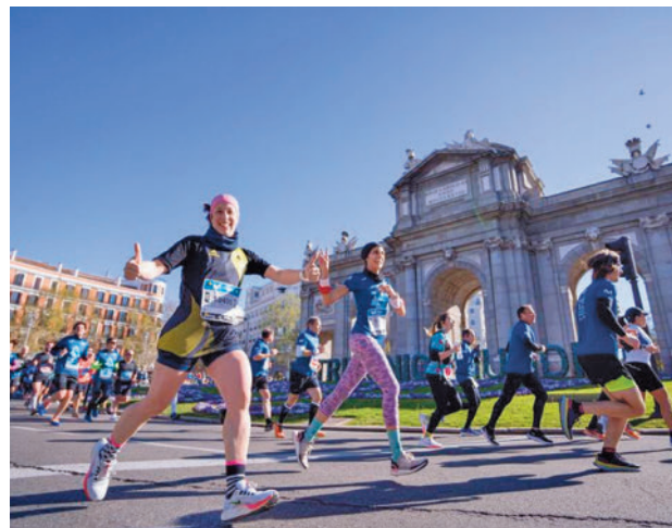
Imagen de una edición anterior

En cuanto al recorrido, el espectacular arco de salida volverá a estar ubicado en el paseo de la Castellana, cerca del cruce con Zurbarán. Los corredores tomarán la Castella-