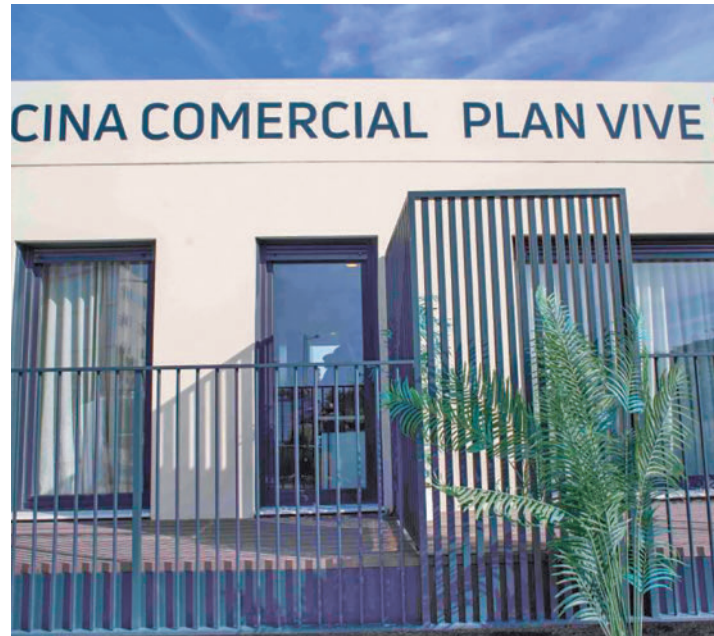
Imagen de la oficina comercial

El plazo arrancará a las 9 horas y las inscripciones se pueden realizar a través de la página web www.convivemadridalquila.com . Además,