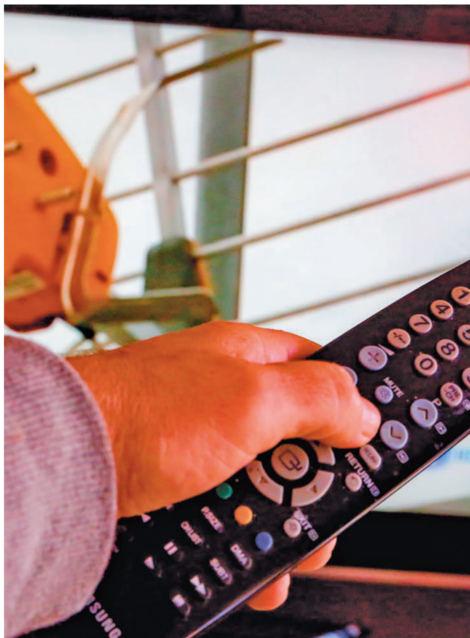
La televisión convencional sigue perdiendo usuarios

tiempo total de uso del televisor (tradicional y otros usos), en el período de estudio ha ascendido a un total de 233 minutos por persona al día y de 350 minutos por espectador al día. Además, el promedio de los 'Otros Consumos Audiovi-