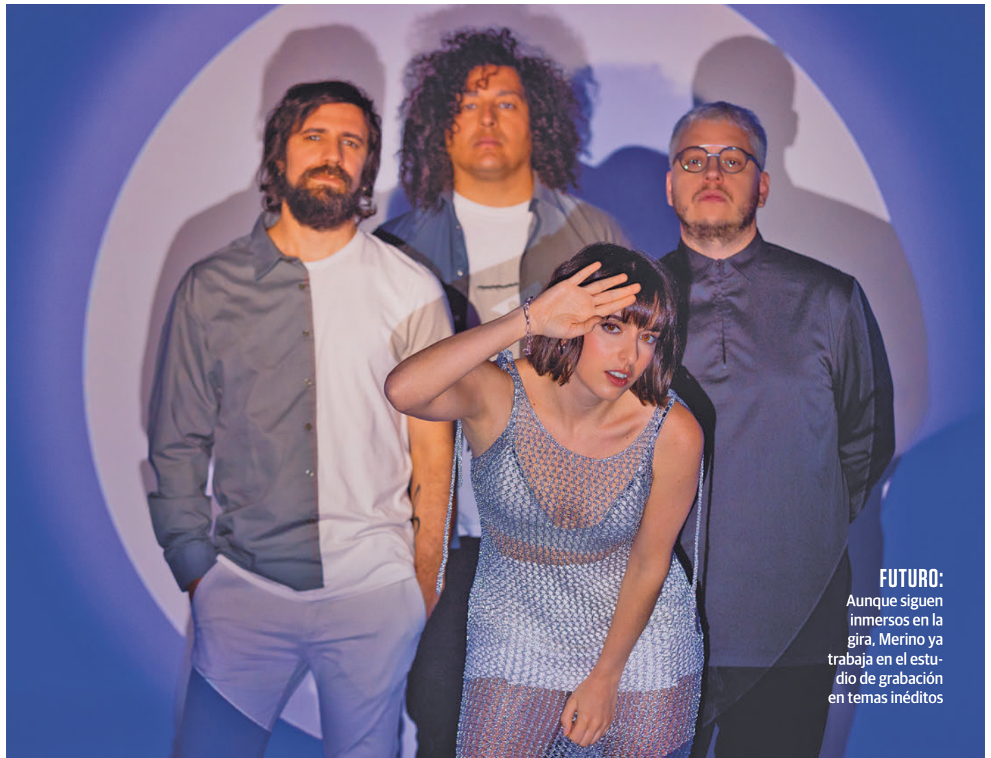
FUTURO: Aunque siguen inmersos en la gira, Merino ya trabaja en el estudio de grabación en temas inéditos

— Álex Gallego: La verdad es que no podemos estar más perdidos, hay canciones que en el estudio pensamos que son increíbles y nos encantan y luego a la gente le resuenan menos y viceversa. No hay ninguna ciencia, creo que es lo bonito de todo esto, el día que se pueda