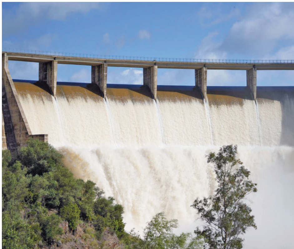
Algunos embalses están soltando agua

Entre otros incrementos, destacan los registrados en el