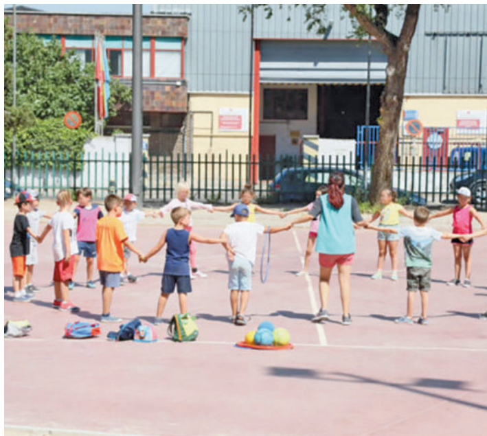
Habrán actividades educativas y de ocio AYUNTAMIENTO DE GETAFE

Los vecinos podrán optar a una de las 3.450 plazas que se ofertan dentro del programa Centros Abiertos en Vacaciones de Verano 2024, con el que se busca ayudar a conciliar la vida familiar y laboral, sumando actividades educativas y de ocio que motiven a los pequeños a desarrollarse. Todo, han recalado desde el Ayuntamiento, a la par que se les brinda "un espacio