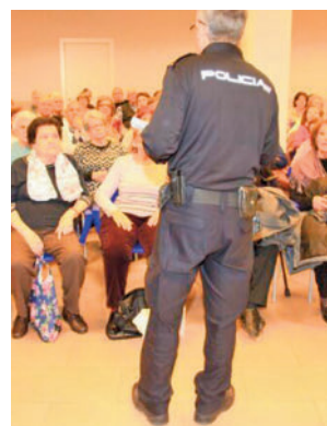
Les darán consejos

WhatsApp, las compras 'online', los aparentes chollos o la búsqueda segura de viajes. Menos acostumbrados al manejo de dispositivos tecnológicos, lo que se pretende es que sepan detectar los peligros de la red, aunque también se les dará consejos sobre otros ámbitos de seguridad