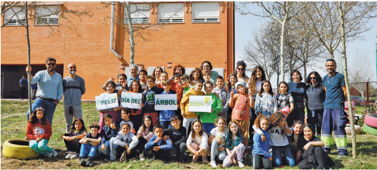
En el colegio público Daoiz y Velarde de Perales del Río ya se han plantado 20 ejemplares AYUNTAMIENTO DE GETAFE