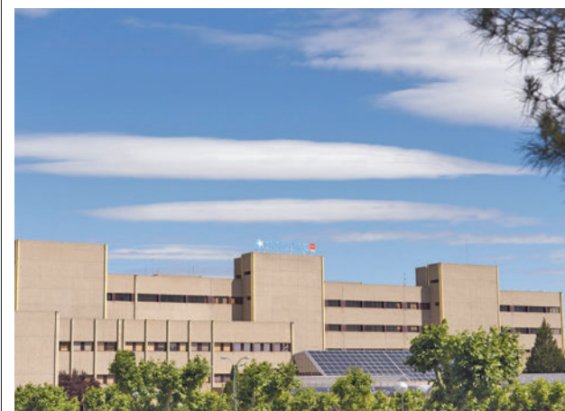
Las pruebas se realizarán en dos carpas HOSPITAL DE GETAFE

Cabe destacar que desde la Concejalía se ha trabajado con el equipo de atención temprana en el desarrollo de las propuestas con el fin de "ofrecer el mejor apoyo a los peques con necesidades educativas especiales", en 5 de estos centros. Este programa incluye además a aquellos menores de familias vulnerables, "para que puedan integrarse en las actividades y contar con el servicio de comedor gratuito".