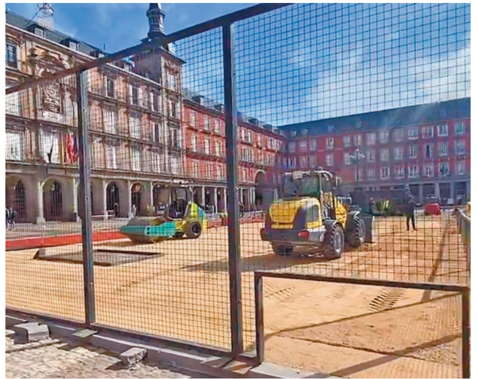
Los trabajos de instalación del recinto deportivo en pleno corazón de la capital @MADRIDDECADENTE

“Esta vez hemos elegido la Plaza Mayor por todo lo que supone para la ciudad, y también a nivel turístico. Estamos convencidos de que la pista volverá a sorprender a todo el mundo. Me gustaría agradecer al Ayuntamiento de Madrid por su colaboración para hacer realidad una pista que permitirá a todos los ciudadanos pisar una re-