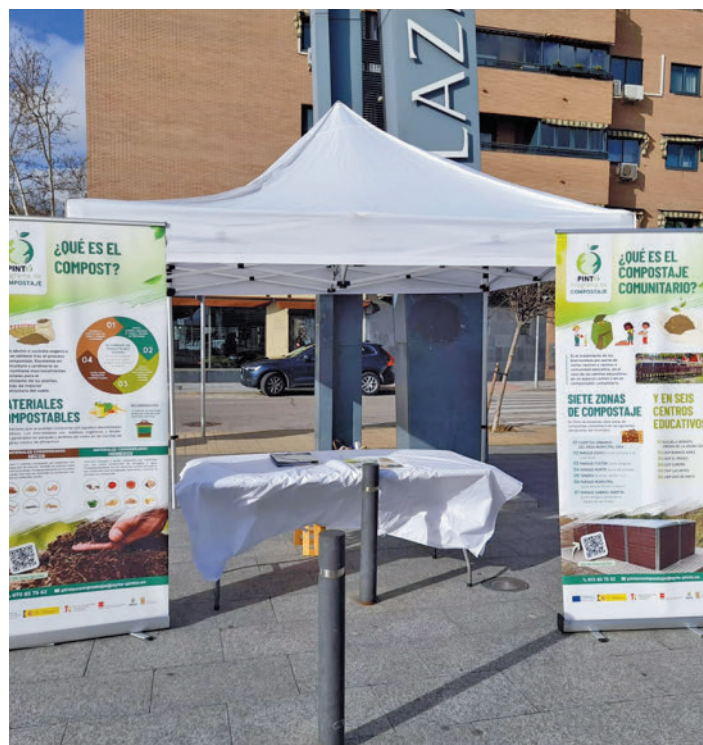
Una de las mesas informativas

MÁS DE UN TERCIO DE LOS RESIDUOS SE PUEDEN COMPOSTAR