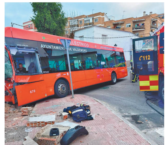
El autobús que sufrió el accidente

Los sanitarios del SUMMA 112 tuvieron que atender a un total de quince personas,