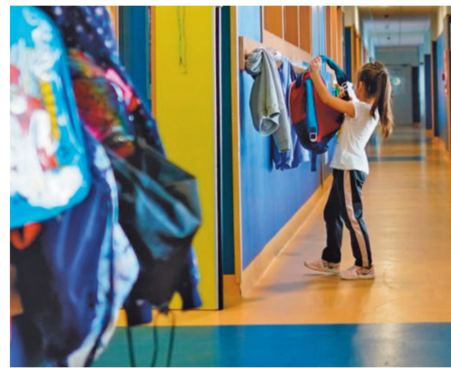
Ya se pueden pedir las plazas EUROPA PRESS