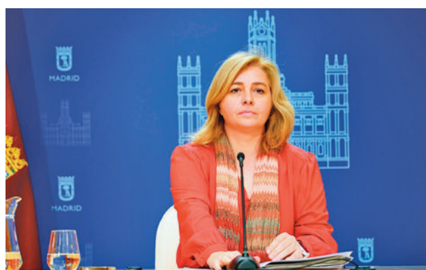
La vicealcaldesa de Madrid, en rueda de prensa

La también portavoz del Gobierno municipal aseguró el 3 de abril que afronta este periodo “con ganas e ilusión”. “Tenemos muchas cosas que hacer por delante y desde luego Madrid no se va