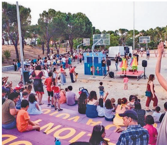
Una de las actividades organizadas por los propios residentes

mero de festejos populares, pasando de 34 eventos del año pasado a sólo 6 este" y prohibir las barras donde se vende comida y bebidas alcohólicas para sufragar los gastos de actuaciones gratuitas para todas las edades.