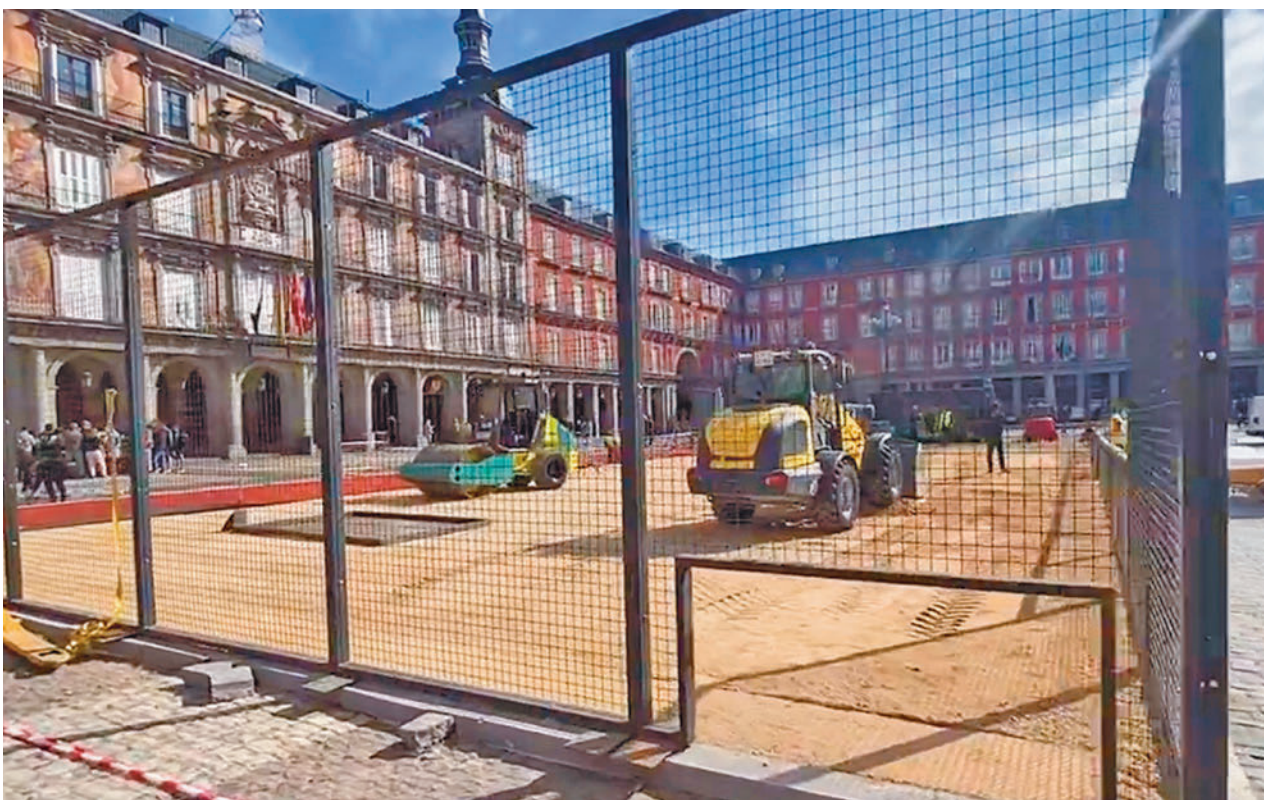
Los trabajos de instalación del recinto deportivo en pleno corazón de la capital @MADRIDDECADENTE