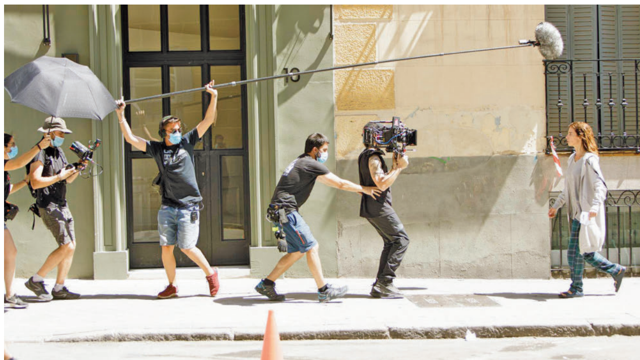
Rodaje de un proyecto audiovisual en la Comunidad de Madrid