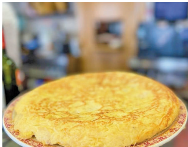
Se repartirán 1.500 raciones de tortilla AYTO DE FUENLABRADA

música. En paralelo, durante la celebración, los fuenlabreños se echarán a los parajes naturales y parques de la ciudad para degustar su tortilla. En Valdeserrano habrá desde castillos hinchables a charanga y actividades infantiles. Mientras, en Loranca y el Parque Miraflores se llevarán a cabo actuaciones de escuelas de baile y asociaciones, además de un tren turístico.