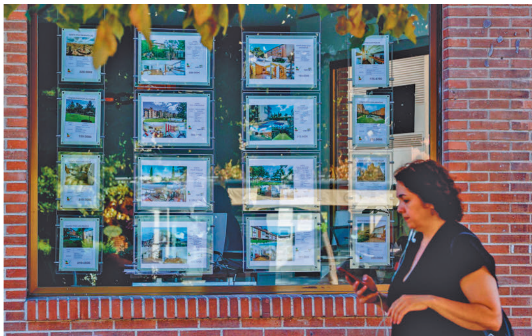
Una mujer pasa frente a una inmobiliaria

brio entre hombres y mujeres muestra que "las mujeres, con niveles socioeconómicos más bajos demandan alquiler, al no poder acceder a la compra. También se refleja cómo la edad de estas inquilinas va aumentando año tras año". El mercado del alquiler demuestra que la brecha de género sigue existiendo.