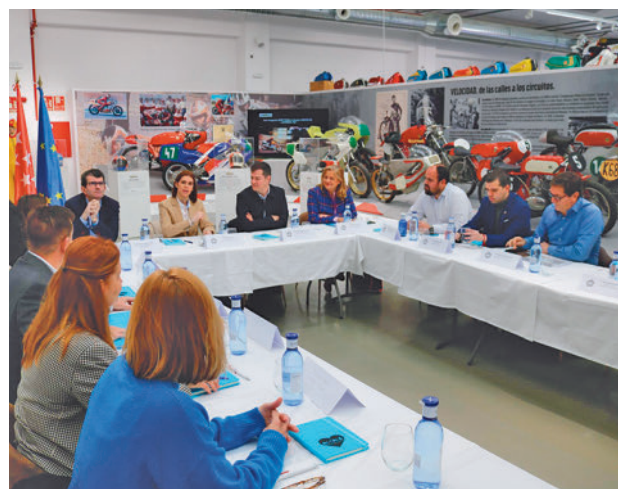
Reunión en Alcalá de Henares

Las tres ciudades han acordado trabajar de manera conjunta durante los próximos meses para el apoyo técnico de la oferta turística "desestacionalizadora", para el desarrollo de acciones de promoción y comercialización cruzada de los tres destinos, para la generación de contenidos profesionales y para el apoyo en eventos de interés turístico.