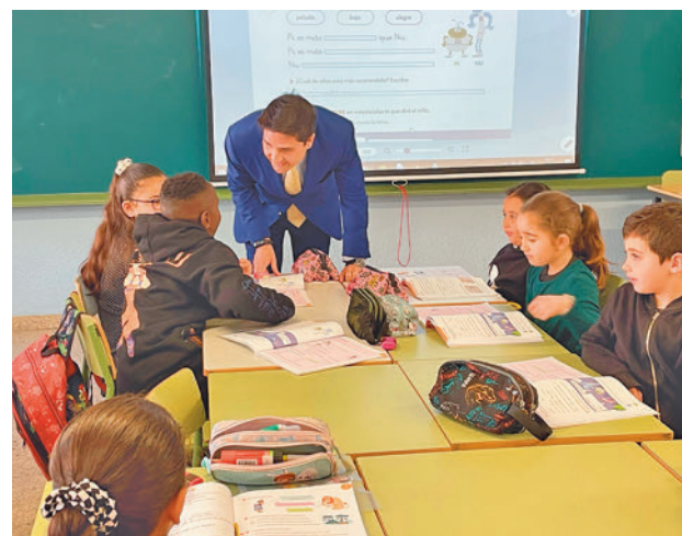
El consejero de Educación, Ángel Viciano

Con estas medidas se alcanzarán casi las 3.600 plazas