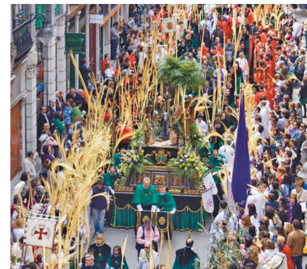
Las procesiones son uno de los atractivos

A las grandes capitales, como Madrid y Barcelona, los destinos de costa y las islas se suman en estas fechas otros destinos típicos de esta fecha por sus procesiones, como Sevilla, Murcia o Castilla y León.