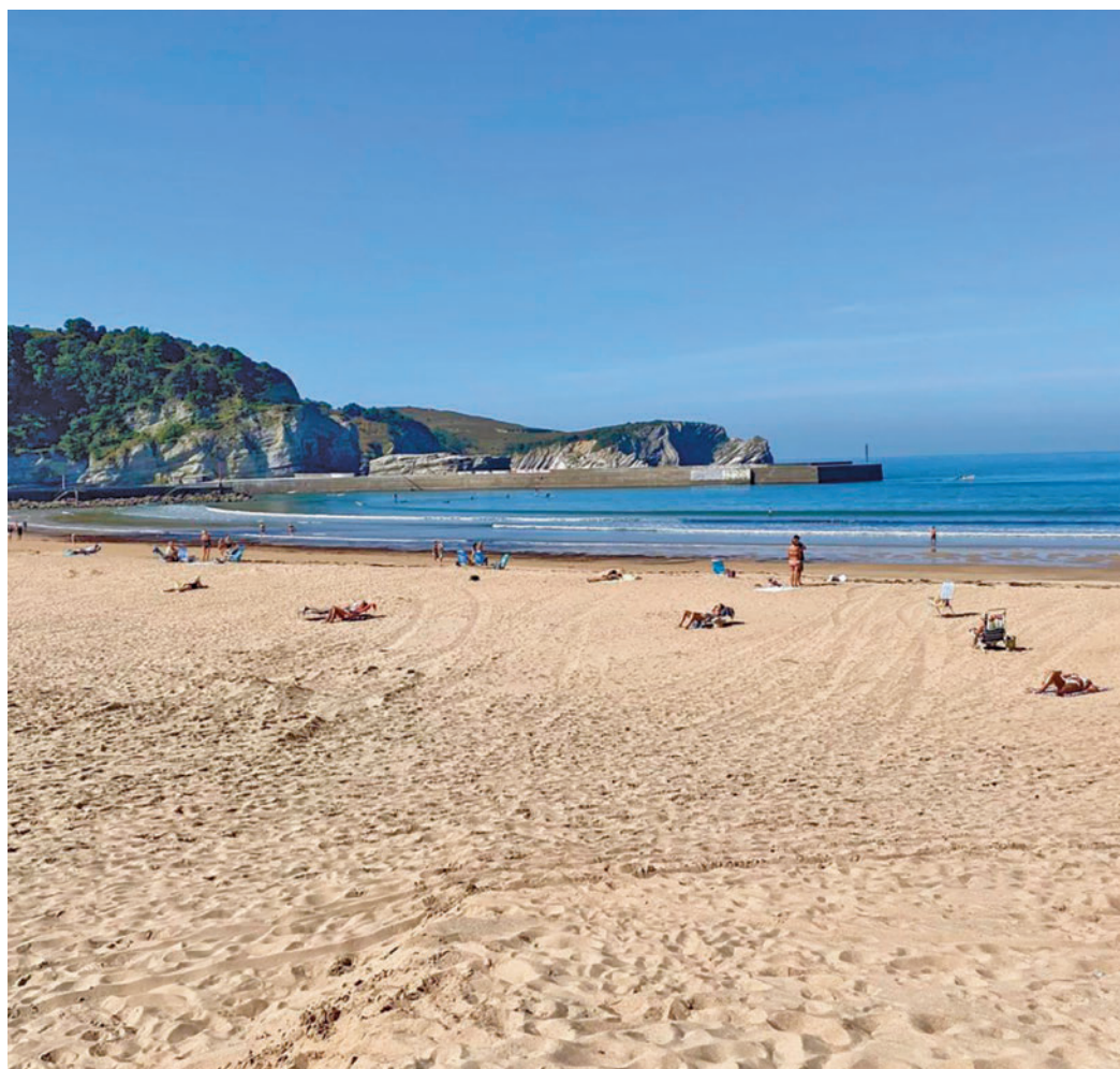
Las playas son uno de los destinos de esta Semana Santa

"En cualquier caso, y más allá de la Semana Santa y el optimismo cuantitativo debemos seguir impulsando y cuidando el sector turístico, uno de los pilares de nuestra economía, con políticas que lo hagan más sostenible, con cada vez mejores condiciones para