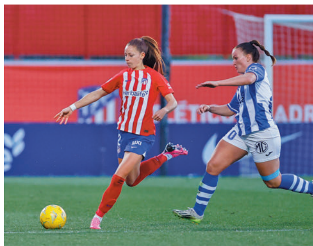
Triunfo rojiblanco ante el Huelva MARCOS BARQUERO / AT.MADRID

do méritos, las rojiblancas visitan este domingo (12 horas) a un Granada que es tercero por la cola, mientras que el Madrid CFF jugará 24 horas antes en el campo del Villarreal. Por su parte, el Real Madrid defiende su segunda plaza en Valdebebas (sábado, 20 horas) ante el Eibar.