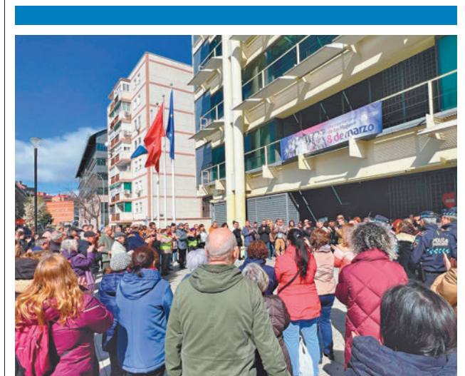
El atentado de 2004 costó la vida a seis vecinos

En ella más de una treintena de profesionales voluntarios de todos los sectores, desde un agente aduanero a una tapicera, un fundador de una agencia de marketing y comunicación, una diseñadora de joyas o una directora de logística y transportes, mantuvieron charlas individuales de un máximo de 10 minutos con los estudiantes que acaban su etapa. Durante ese tiempo resolvieron las dudas que les planteaban.