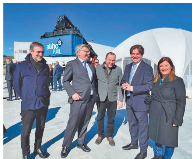
La sede se presentó esta semana AYTO DE FUENLABRADA

Toda la actualidad de Fuenlabrada, en nuestra página web.