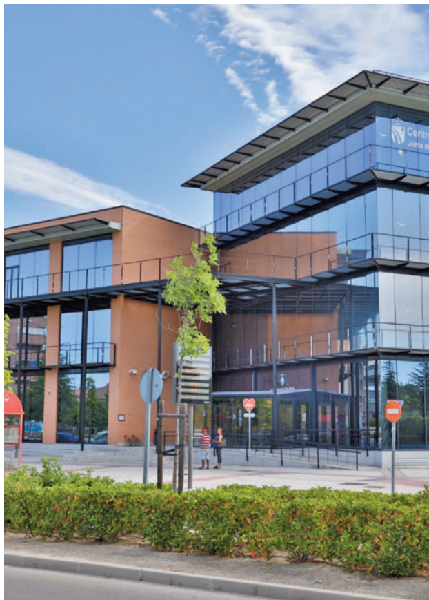
La Junta de Distrito Vivero, uno de los espacios en obras

EL OBJETIVO DE LAS OBRAS ES "FACILITAR EL DÍA A DÍA DE LOS USUARIOS"