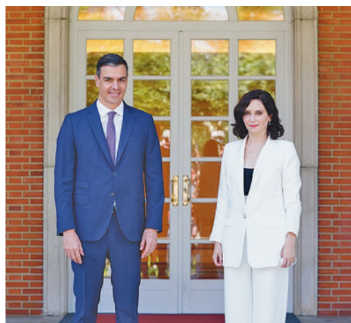
Pedro Sánchez e Isabel Díaz Ayuso

EL PERIÓDICO GENTE NO SE RESPONSABILIZA NI SE IDENTIFICA CON LAS OPINIONES QUE SUS LECTORES Y COLABORADORES EXPONGAN EN SUS CARTAS Y ARTÍCULOS