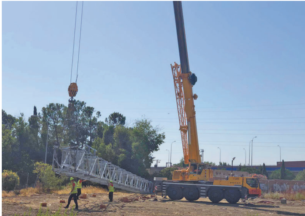
Instalación de una antena de telefonía móvil

El Consistorio ha defendido así que la antena funciona a pleno rendimiento con aquellas compañías que han procedido a engancharse a la misma y ha subrayado que ha tomado "todas las acciones necesarias" en el marco de sus competencias para la resolución de la problemática de falta de cobertura que la localidad arrastra desde hace décadas. Entre otros argumentos, ha remarcado que la antena se instaló tras realizar los estudios técnicos y emitirse los informes pertinentes que autorizan su ubicación y actualmente se encuentra operativa al cien por cien. Por tanto, ha alegado, aquellas compañías que han procedido a colocar sus re-