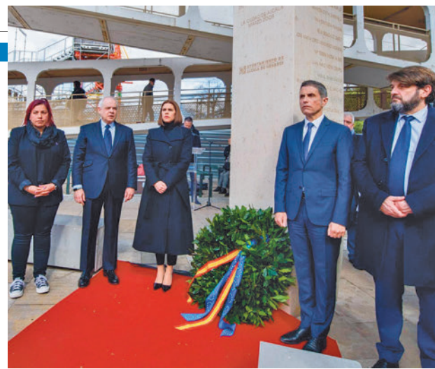
Acto de homenaje a las víctimas del 11-M