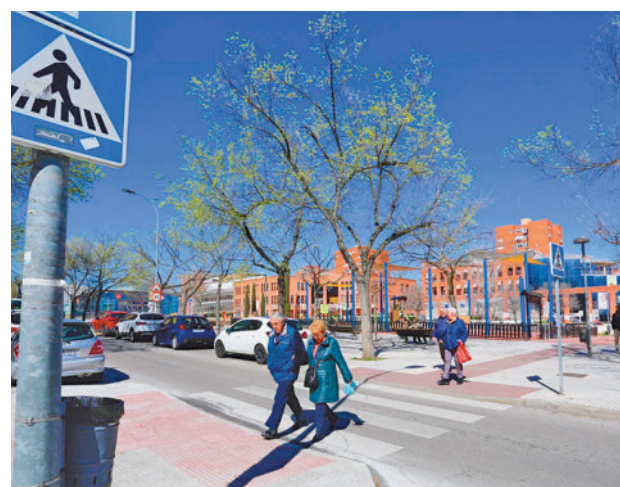
Uno de los pasos de cebra

en breve tendrán mayor afluencia de usuarios de las personas que utilizarán los dos Centros de Día que la Comunidad de Madrid pondrá en funcionamiento en el Centro Integrado de Servicios Sociales de Coslada. El fin último es que estos usuarios puedan llegar a estas instalaciones con total autonomía y seguridad. Uno de estos Centros de Día estará dirigido a