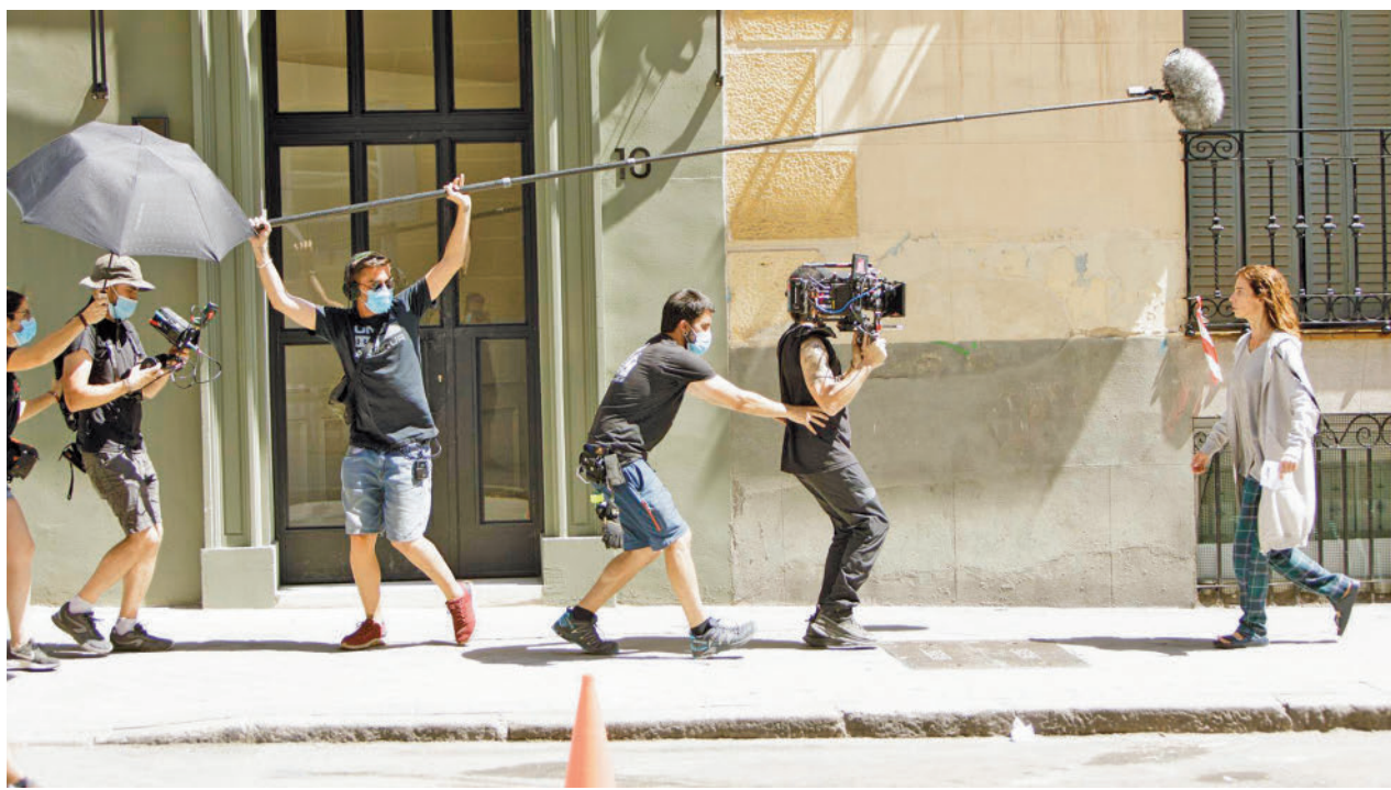
Rodaje de un proyecto audiovisual en la Comunidad de Madrid