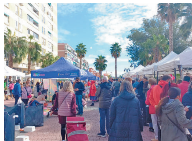
Habrà diversidad de género para elegir AYUNTAMIENTO DE GETAFE

del pago de estas de 2021 a 2023 como una medida de apoyo a la hostelería", ha lamentado. Por todo ello ya adelanta que exigirá al PP que pida disculpas tanto a trabajadores como a hosteleros.