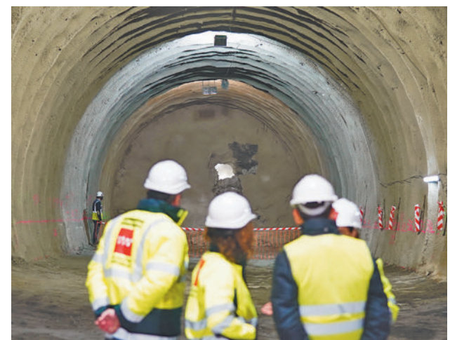
Las obras durarán seis meses COMUNIDAD DE MADRID

El objetivo de las obras en El Casar es dotar a MetroSur de un segundo enlace con el centro de Madrid, uniendo las estaciones de Villaverde Alto con El Casar, que beneficiará a más de un millón de usuarios del Sur de Madrid.