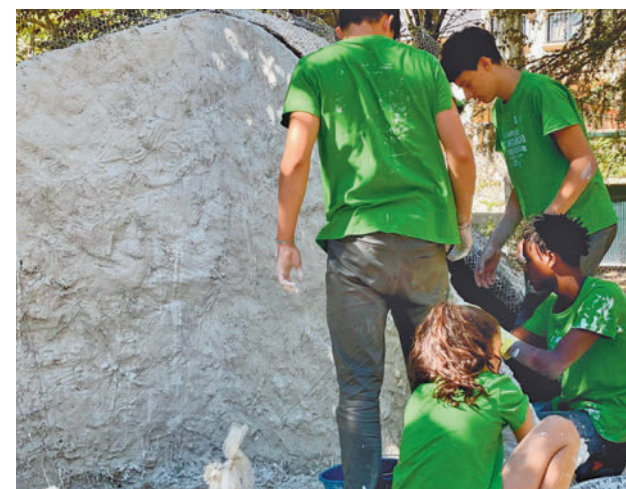
Anterior edición de los Campos de Voluntarios

La cuota del programa, que incluye alojamiento, manutención y actividades, es de 110 o 121 euros, en función de la edad de los participantes, transporte no incluido.