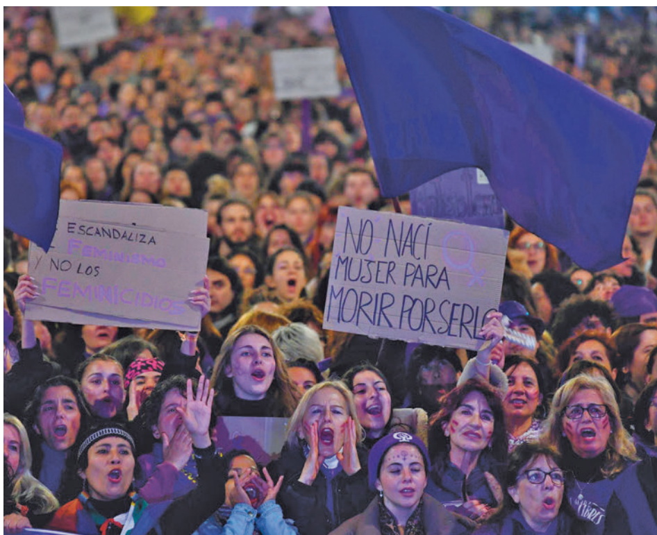
Manifestación de la Comisión 8M del pasado año E.P.