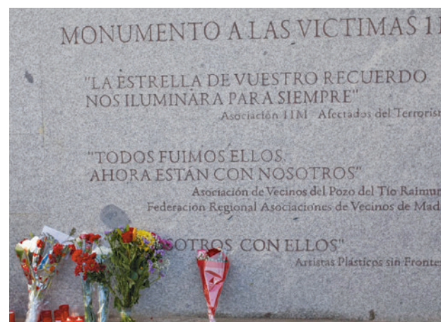
Monumento a las víctimas en El Pozo

La Comunidad de Madrid inaugurará este domingo 10 un nuevo espacio de homenaje a las víctimas de los atentados del 11M en la estación de Atocha, justo debajo del lugar que ocupaba el monumento conmemorativo que se encontraba en superficie hasta ahora. Las paredes están pintadas de color azul cobalto, el elegido por las Asociaciones de Víctimas para este entorno.