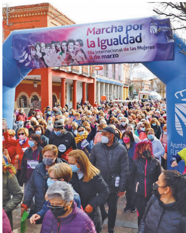
Una de las marchas de años anteriores AYTO DE FUENLABRADA

Más allá de esto, la programación continuará con