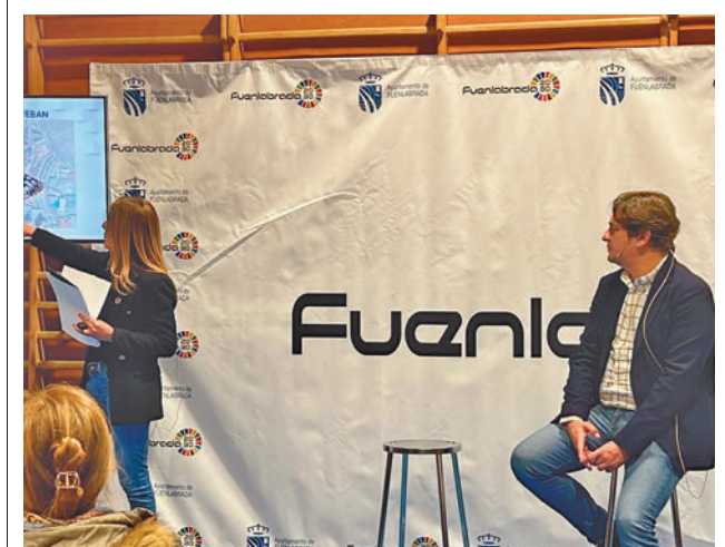
Reunión de los vecinos de San Esteban