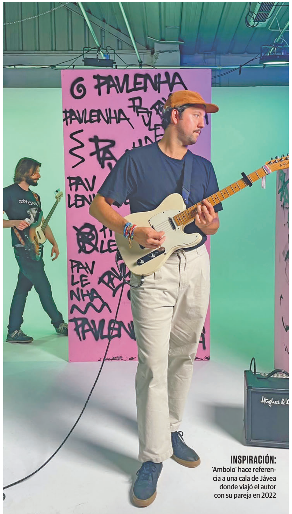
INSPIRACIÓN: ‘Ambolo’ hace referencia a una cala de Jávea donde viajó el autor con su pareja en 2022

De este modo, ‘Tierno Galván’ promete sumarse a éxitos como ‘Calle del reloj’, “que ya casi es un himno en Ponferrada”, y con las que Pavlenha aspira a “llegar a