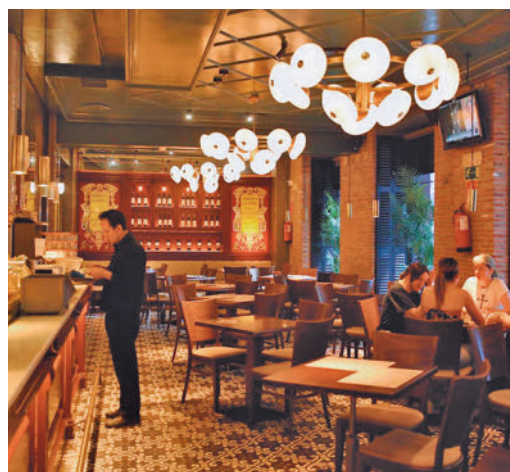
Los horarios de hostelería, a debate

EL PERIÓDICO GENTE NO SE RESPONSABILIZA NI SE IDENTIFICA CON LAS OPINIONES QUE SUS LECTORES Y COLABORADORES EXPONGAN EN SUS CARTAS Y ARTÍCULOS