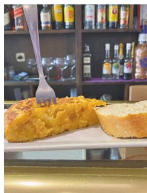
Ofrecerán pinchos como estos

y visitantes tendrán la opción de degustar este plato icónico de la gastronomía española. La Asociación de Hosteleros de este municipio, junto al Ayuntamiento, organiza anualmente este evento en el que por 1,75 euros se ofrecerá estos días una tapa de tortilla (opcionalmente hasta