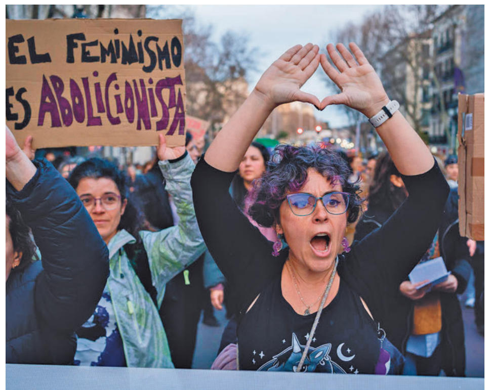
Marcha organizada por el Movimiento Feminista de Madrid en 2023