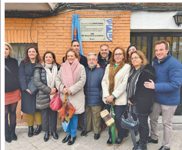
Homenaje a Paquita Gallego