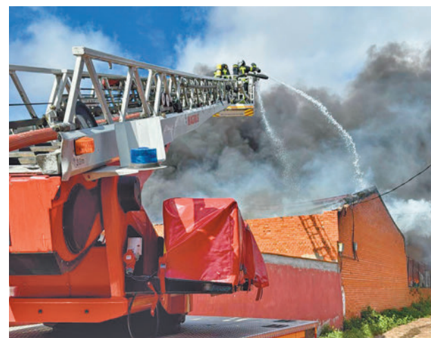
Bomberos apagando el incendio de Leganés

Agentes de la Policía Local confinaron al principio a los