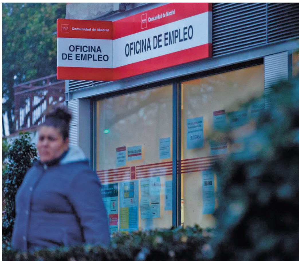
Una mujer frente a una Oficina de Empleo

Según las previsiones del estudio, a partir de datos de la EPA, se estima que para el año 2040 la mitad de las mujeres en activo superaría los 50 años, ya que la población activa femenina envejece a un ritmo de un punto porcentual al año. En términos absolutos, las mujeres activas mayores de 50 años rozan los 4 millones (3.868.900 de mujeres sénior que tienen trabajo o lo buscan, la cifra más alta de toda la serie histórica) frente a las 2.519.000 de hace