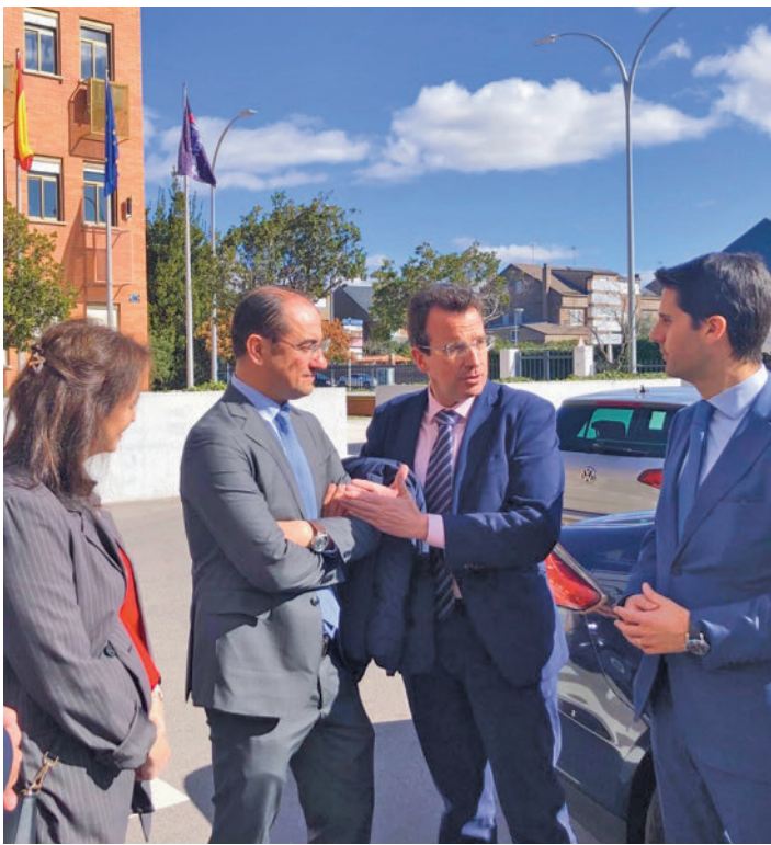
El alcalde y el consejero, a su llegada al IMDEA y observando uno de los proyectos que se desarrollan