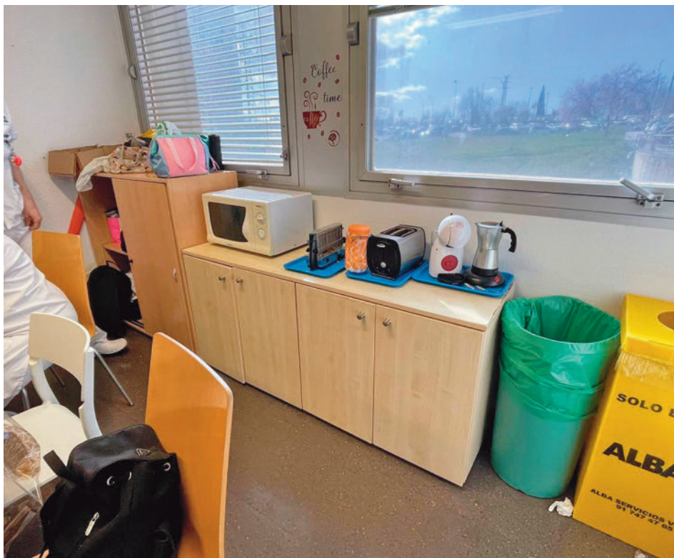
Sala en la que descansa el personal laboral del Severo Ochoa

gentedigital.es Toda la actualidad de Leganés, en nuestra página web