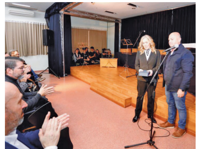
Un momento del acto