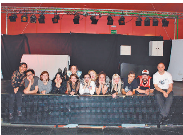
Compañía teatral Le Mirage