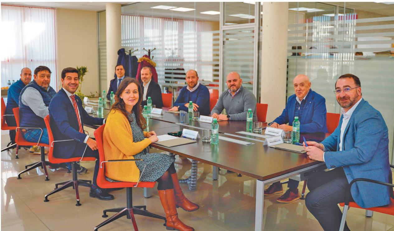
Imagen de los asistentes a la reunión