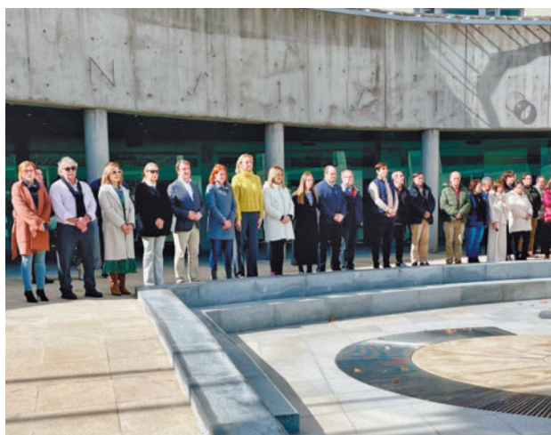
Minuto de silencio a las puertas del Ayuntamiento tricantino

vos consistorios. De este modo, tricantinos y colmenareños mostraron su solidaridad con las víctimas y sus familias, heridos y afectados que han perdido todos sus bienes en el incendio del pasado jueves 22 de un edificio de viviendas. Una tragedia que ha acabado con la vida de diez personas, varios heridos y la destrucción de los 138 domicilios de Campanar.