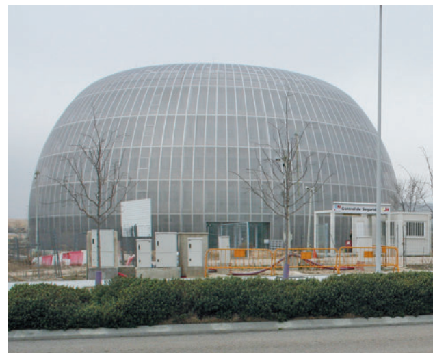
La puesta de la primera piedra se realizó en 2007