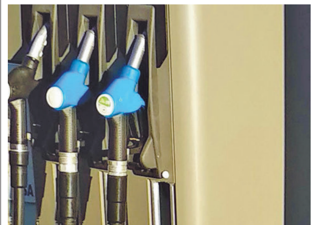
Unos surtidores de gasolinera

gentedigital.es Toda la actualidad de Getafe, en nuestra página web