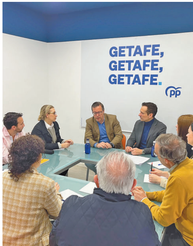
Un momento de la reunión mantenida el lunes en el PP local