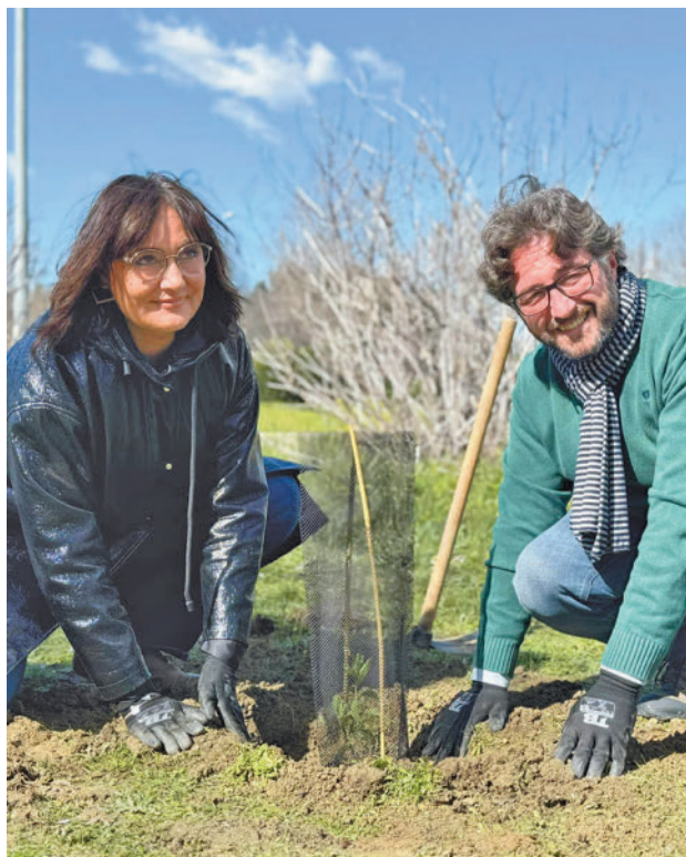
Plantando para ayudar a renaturalizar AYUNTAMIENTO DE PINTO

Para lograrlo, apuestan por la recuperación de espacios periurbanos degradados que conecten el casco urbano, pero también la naturalización de espacios de oportunidad. Unos de estos serán dos centros educativos cuyos patios y aulas se llenarán de naturaleza, con la implicación