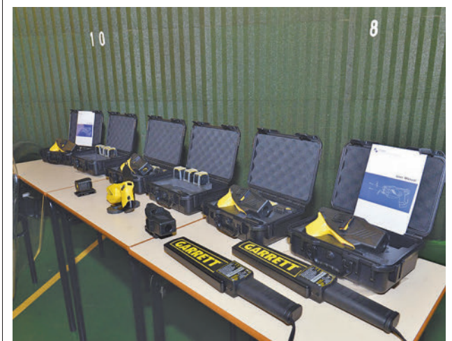
Material policial incorporado AYUNTAMIENTO DE VALDEMORO

El Ayuntamiento de Valdemoro ha solicitado por escrito a la Fiscalía del Sur de Madrid que tome medidas contra un vecino muy conflictivo que ha sido detenido unas 50 veces, pero que sigue en libertad amedrentando a la población. Se trata de un individuo de mediana edad que ha increpado, insultado y hasta golpeado tanto a vecinos como a trabajadores municipales, establecimientos y vehículos sin motivo alguno. Por ello, ha sido arrestado por amenazas, lesiones, daños y atentado y desobediencia a la autoridad. Fuentes municipales señalan que aún es pronto para que haya una contestación, porque la Fiscalía tiene que estudiar el tema y ver qué medidas pueden adoptarse pero está convencidos de que tomará la decisión más adecuada.