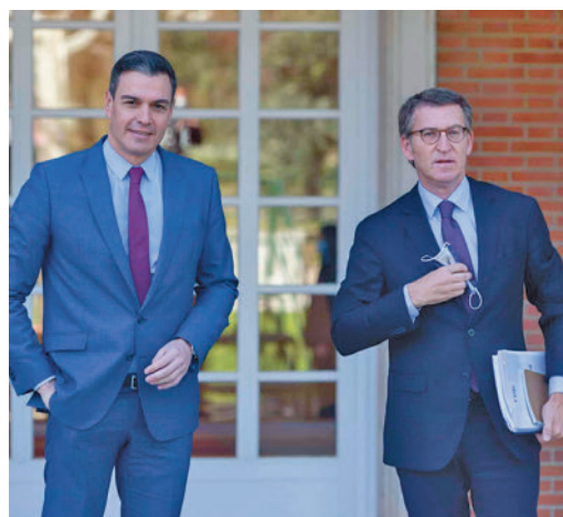
Sánchez y Núñez Feijóo, en una foto de archivo

EL PERIÓDICO GENTE NO SE RESPONSABILIZA NI SE IDENTIFICA CON LAS OPINIONES QUE SUS LECTORES Y COLABORADORES EXPONGAN EN SUS CARTAS Y ARTÍCULOS