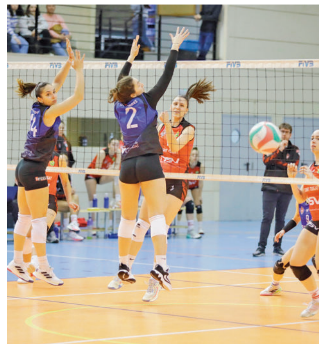
El Feel Alcobendas ya no es colista RFEVB

La jornada 23 de la Liga Femenina Endesa depara un nuevo partido en Magariños para el Movistar Estudiantes (sábado 2, 18 horas). Enfrente estará el Bembibre, colista de la competición.