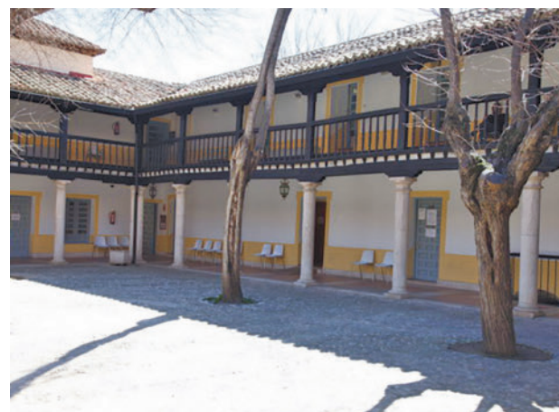
Interior del Hospitalillo de Getafe

gentedigital.es Toda la actualidad de Getafe, en nuestra página web