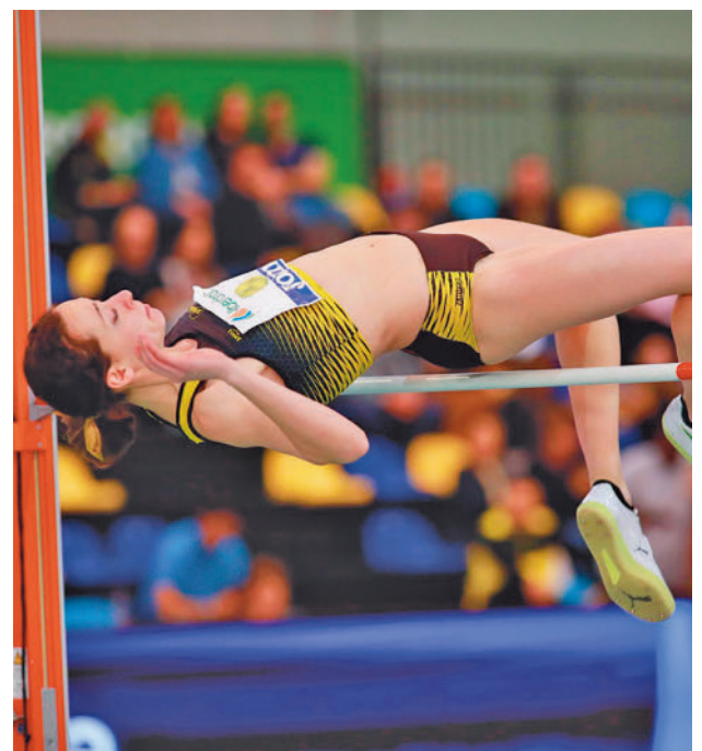
Medina saltó 1,70 en la prueba de altura RFEA

Una vez finalizado el Mundial, la División de Honor femenina de waterpolo celebra este fin de semana su primera jornada de 2024 con los choques Boadilla-Barceloneta y Terrassa-Real Canoe.