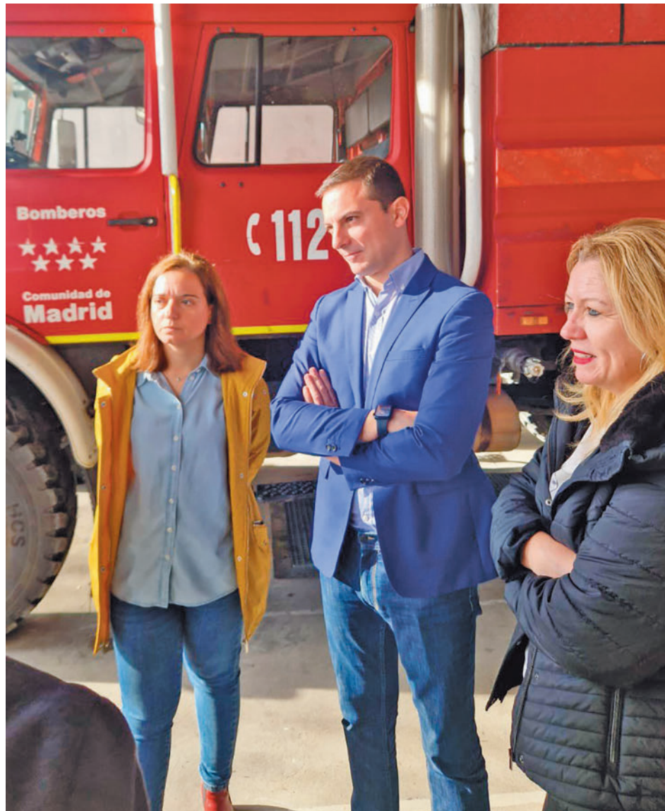
La alcaldesa y el líder de los socialistas madrileños realizando la visita al Parque de Bomberos

En cuanto al diseño del mencionado espacio se ha planteado “tomando como modelo el de Alcobendas, con una nave doble para diez vehículos y para otros dos del grupo especial RBQ (especializados en emergencias de tipo Radiológico, Biológico y Químico), que además dispondrán de 800 metros cuadrados adicionales”, han destacado fuentes del Ejecutivo