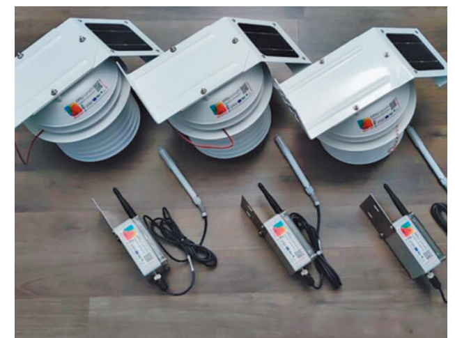
Herramientas usadas en el proyecto EPIU Hogares Saludables

El proyecto EPIU Hogares Saludables se ha desarrollado en dos barrios, La Alhóndiga y Juan de la Cierva, con medidas edificatorias de las que se han beneficiado 8 edificios y 160 hogares.