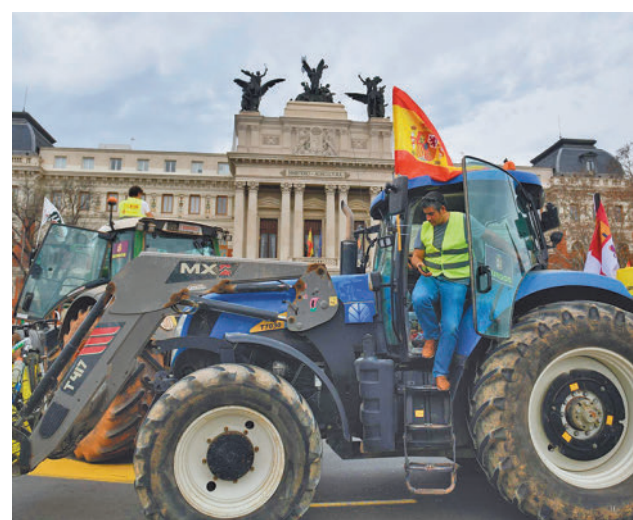
Tractores en el Ministerio de Agricultura