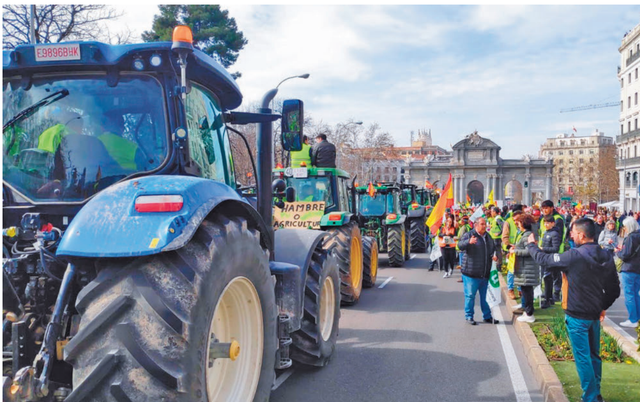
Los tractores llegaron hasta la Puerta de Alcalá