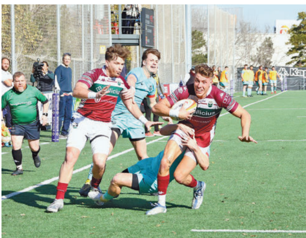
El Alcobendas, el único que accedió al Grupo A FERUGBY