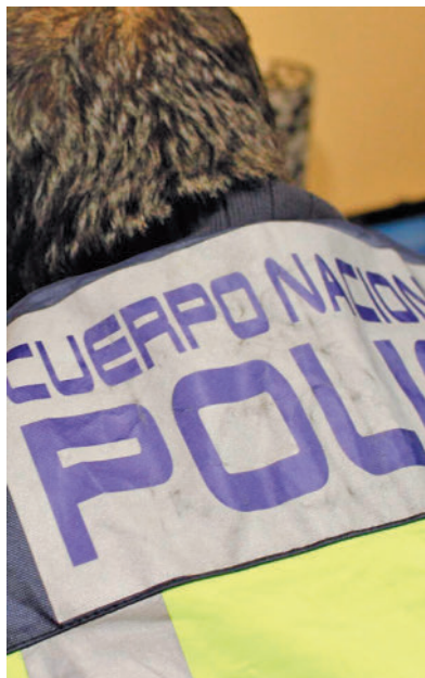
Imagen de archivo de un agente

Al cierre de esta edición, la Policía Nacional analizaba las cámaras de seguridad de la zona y el móvil del niño de 14 años fallecido el pasado fin de semana en Getafe por sobredosis. Los agentes tomaron declaración a la madre y otros familiares de la víctima, que corroboraron la versión de que unos menores le habrían introducido al difunto una gran cantidad de droga en su bebida energética. Una