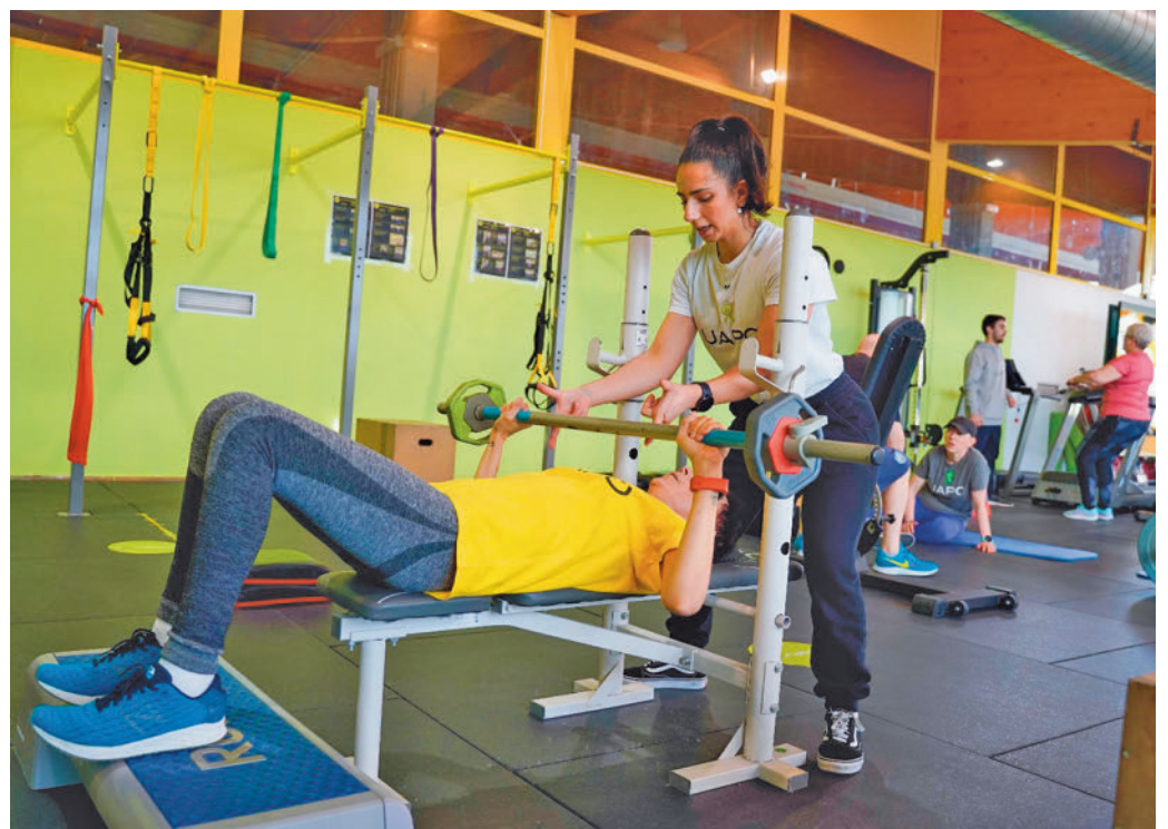
El ejercicio físico tiene un papel fundamental en el tratamiento de la Fundación UAPO