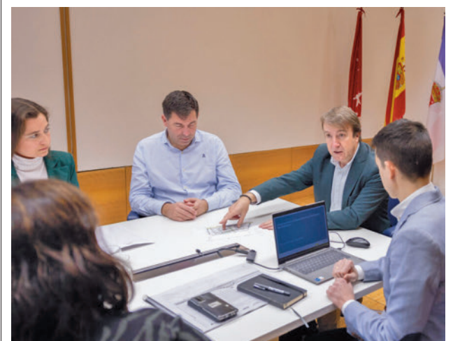
Un momento de la reunión celebrada el pasado martes 20

Según consta en la resolución del gerente de la Agencia Madrileña de Atención Social, la penalidad se impone tras detectarse en el suministro la recepción de melones y sandías en mal estado, hechos ocurridos los días 22 y 26 de junio de 2023. Además, los días 12 y 19 de julio esta misma empresa entregó al centro cajas de huevos con mal olor y presencia de moscas, mientras que el 10 de julio hubieron de ser desechadas en su totalidad un lote de piñas.