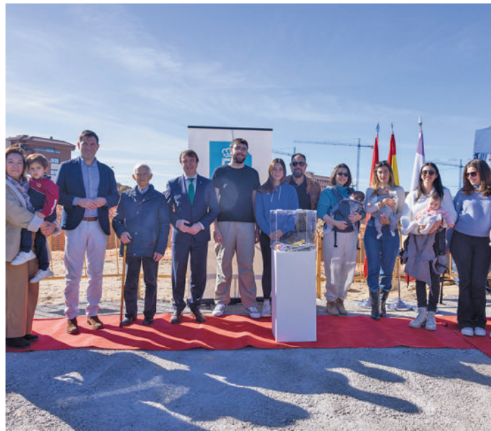
Foto de familia de algunos de los asistentes al acto