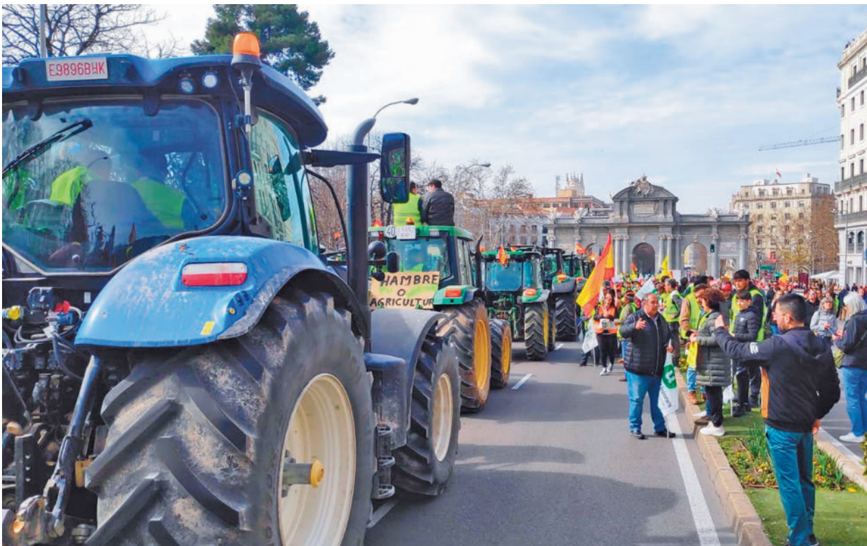
Los tractores llegaron hasta la Puerta de Alcalá.