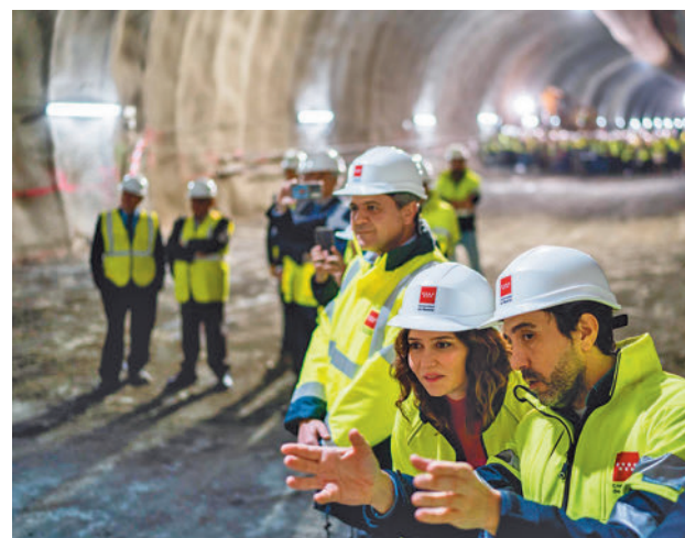
Díaz Ayuso visitó las obras de la Línea 3

Los primeros cambios hacia esta automatización se van a llevar a cabo en la L6, la más frecuentada, con 110 millones de usuarios en 2023, una media en día laborable de 618.000 personas. La dirigente madrileña ha defendido que esta es la idónea para comenzar por su “importan-