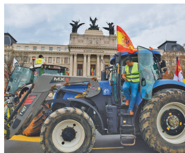
Tractores en el Ministerio de Agricultura