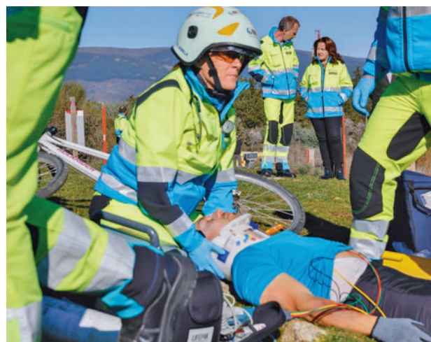
Acto en el que se presentó el informe

Así se desprende del Balance de Actividad 2023 de este servicio, que ha sido presentado por la consejera de