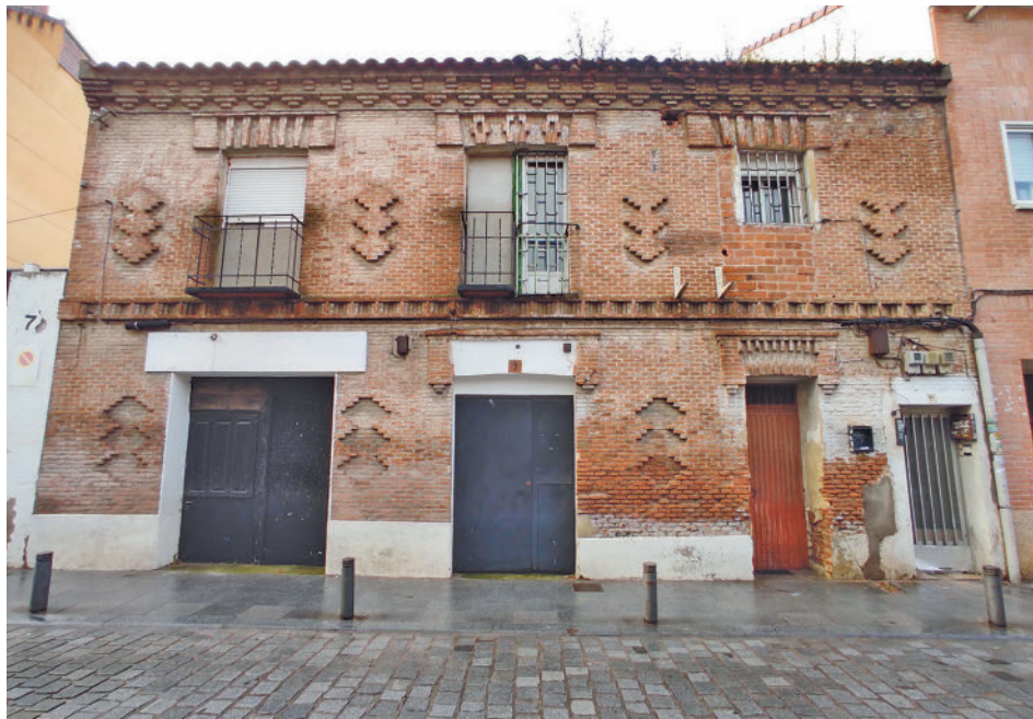
La fachada del inmueble situado entre los números 9 y 11 de la calle de Acuario

Los inmuebles protegidos están situados en 15 de los