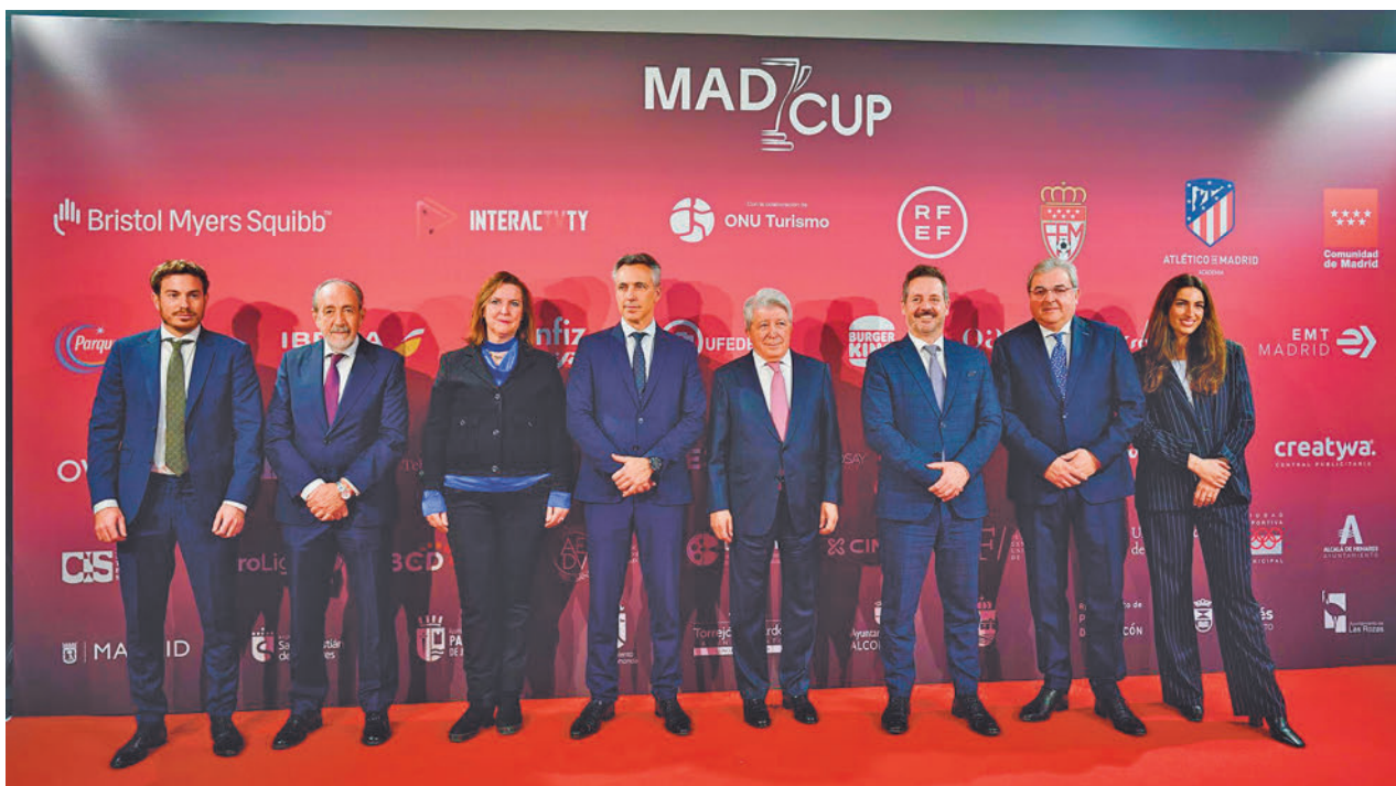
Algunas de las autoridades que se dieron cita en el acto de presentación