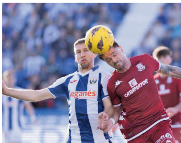
El Leganés se llevó el derbi (3-0) LALIGA

En el otro extremo de la tabla sigue el Leganés, que defenderá su liderato este sábado (16:15) en Santander.