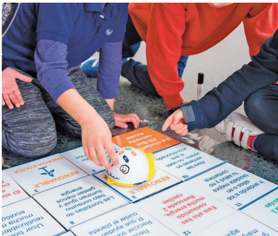
Actividades en un colegio de la Comunidad de Madrid

En cuanto a los días no lectivos, estarán disponibles para todo el alumnado de la localidad y de las zonas que establezcan los ayuntamientos.