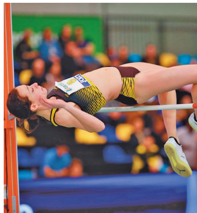
Medina saltó 1,70 en la prueba de altura RFEA

Una vez finalizado el Mundial, la División de Honor femenina de waterpolo celebra este fin de semana su primera jornada de 2024 con los choques Boadilla-Barceloneta y Terrassa-Real Canoe.