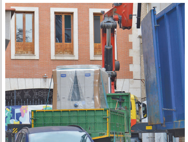
Instalación del nuevo sistema

"Le hemos dado una vuelta con el objetivo de tener un Pinto más natural sin que eso suponga cercenar el espacio de aparcamiento en la localidad, que todos coincidimos en que es un problema", ha explicado el regidor, quien presentó hace meses su propuesta para solventar el problema. "Hay que habilitar aparcamientos en superficie gratuitos", añadió.