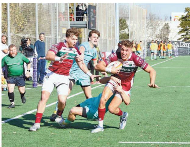
El Alcobendas, el único que accedió al Grupo A FERUGBY