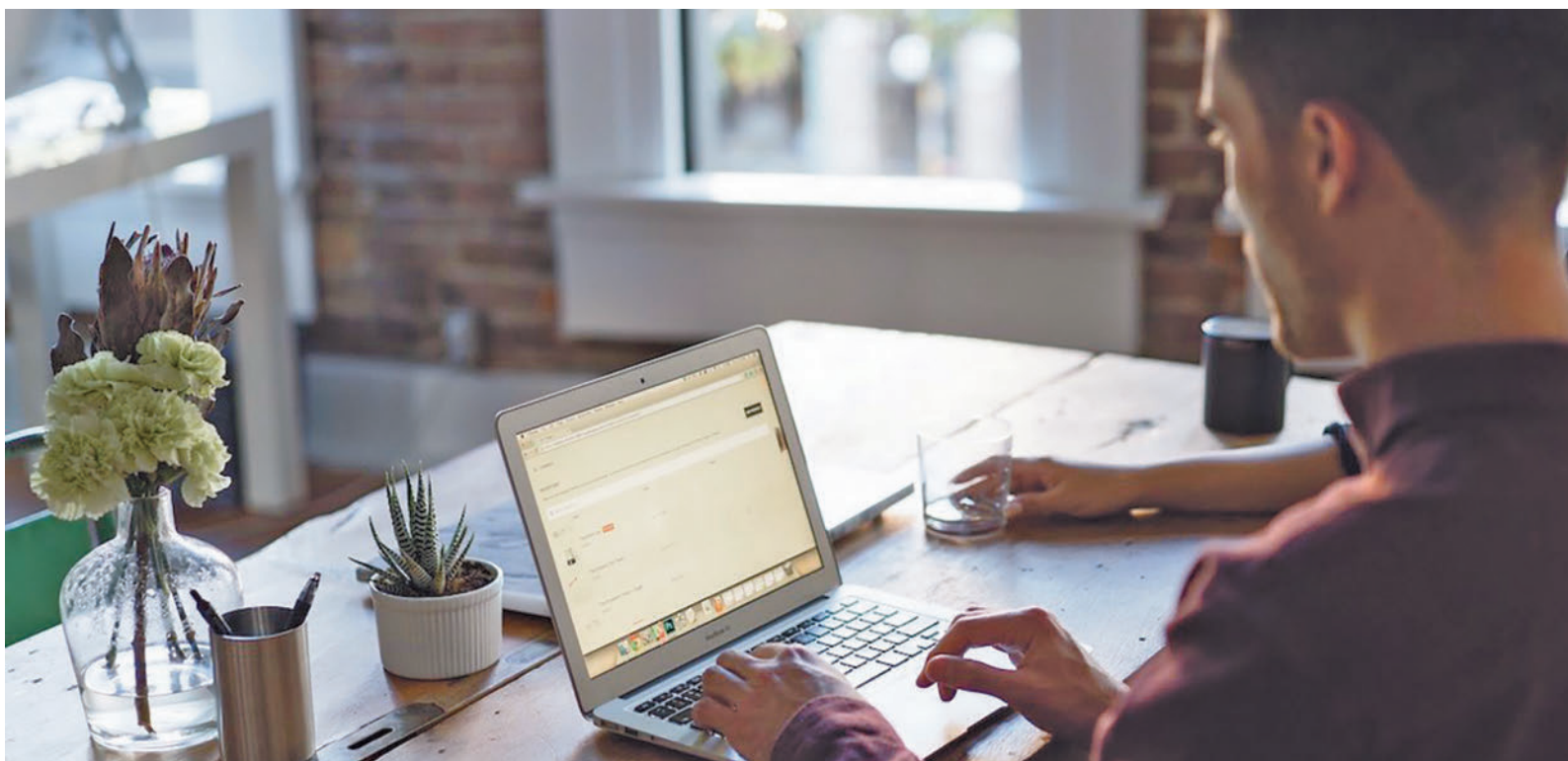
El teletrabajo sigue aumentando en España