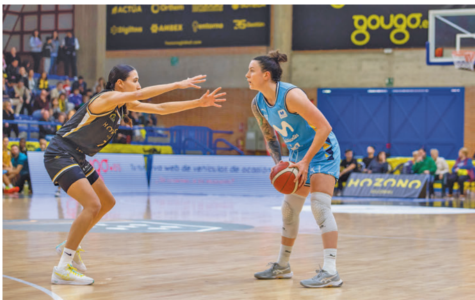
La visita a Alcantarilla se saldó con una nueva derrota FEB