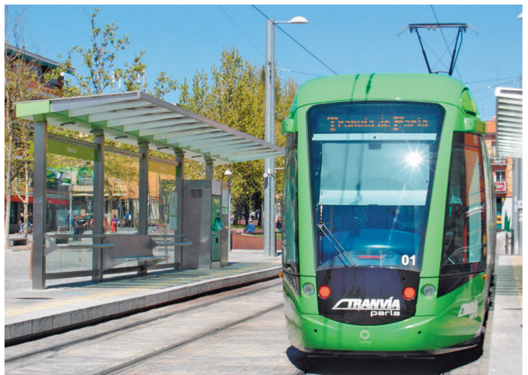
Tranvía de Parla