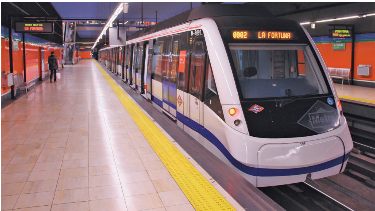
Un convoy de la Línea 11 de Metro se dirige a la estación de La Fortuna