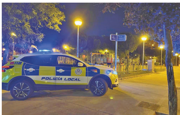
Policía Local de Leganés

Los hechos tuvieron lugar el domingo 11 sobre las 21.30 horas en una cafetería situada en la avenida Rey Juan Carlos. Un hombre llegó con un gran martillo y empezó a romper la parte inferior de la cristalera con la intención de