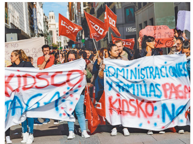
Protesta de las trabajadoras de Kidsco

Fuentes municipales han explicado que hacen todo lo posible para priorizar el pago de las facturas a la empresa gestora, para que no pueda argumentar que no abona la nómina íntegra porque las administraciones se retrasan en estos pagos. "Son los primeros en la lista a la hora de pagar", han manifestado.