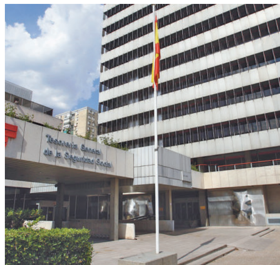
La Seguridad Social tramita las pensiones

Las parejas de hecho también tienen derecho a la pensión de viudedad, pero tienen que