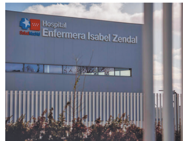
Hospital Enfermera Isabel Zandal

Será el primero de sus características en toda España y dará cobertura a las necesidades cotidianas de los afectados por esta enfermedad y sus cuidadores, al tiempo que ofrecerá prestaciones ambulatorias especializadas, según han destacado desde el Gobierno regional. En la Comunidad de Madrid hay en la actualidad unos 600 casos de ELA, y a nivel nacional, alrededor de 4.500.