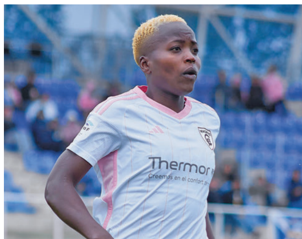
Kundananji protagoniza un traspaso récord

Ya sin Kundananji el Madrid CFF recibe este domingo (18 horas) al Levante Las Planas. Además, Barcelona-Atlético y Real Madrid-Tenerife Egatesa.