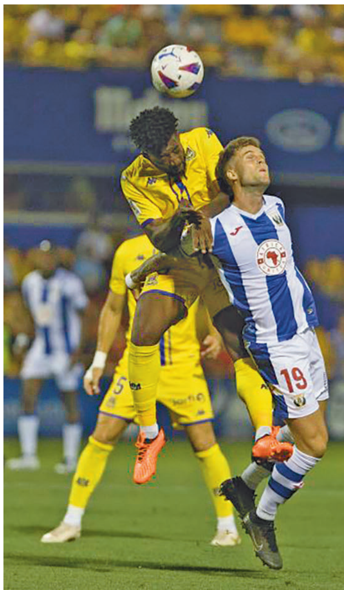
Imagen del partido de la primera vuelta LALIGA

Además, el pasado domingo sumaban tres puntos clave ante un rival directo por la permanencia. Por más que el 1-0 ante el Andorra no sacara al Alcorcón de la zona caliente, ese resultado viene a confirmar la mejoría amarilla, traducida en que ahora mismo está empatado a 28 puntos con los tres equipos que le preceden en la tabla: Villarreal B, Cartagena y Huesca. Con 26 jornadas a las espal-