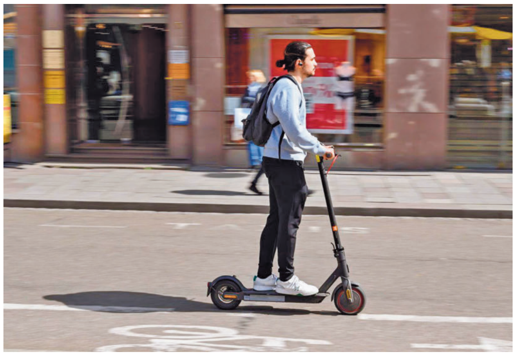
Los accidentes con patinetes eléctricos siguen al alza

Tres de cada cuatro afectados por un accidente eran hombres