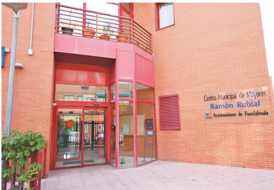
Fachada del Centro Municipal de Mayores Ramón Rubial AYUNTAMIENTO DE FUENLABRADA