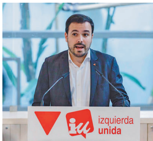
Alberto Garzón, exlíder de Izquierda Unida

EL PERIÓDICO GENTE NO SE RESPONSABILIZA NI SE IDENTIFICA CON LAS OPINIONES QUE SUS LECTORES Y COLABORADORES EXPONGAN EN SUS CARTAS Y ARTÍCULOS