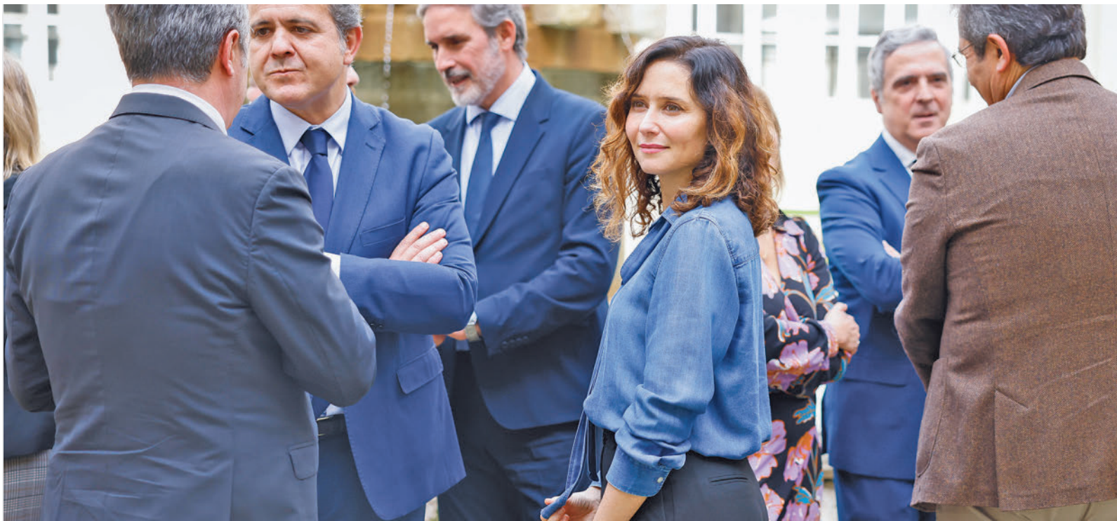
Isabel Díaz Ayuso, durante el acto en el que presentó las nuevas medidas de vivienda