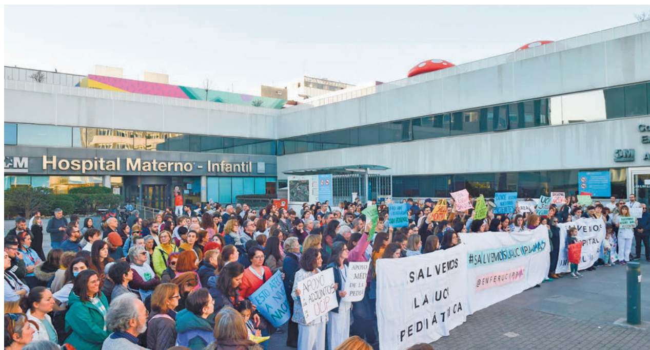
Protesta pidiendo la reapertura de la UCI Pediátrica de La Paz.

En concreto, en la semana del 5 al 11 de febrero, se han notificado a través del Sistema de Vigilancia EDO (Sistema de Enfermedades de Declaración Obligatoria) un total de 1.199 casos de gripe, 563 menos con respecto a la semana previa. De esta forma, el acumulado de la temporada 2023/2024 asciende a 59.799 casos. En el caso de la covid-19, se han registrado un total de 212 contagios, ocho más respecto a los que se detectaron siete días antes (204 casos), cuando hubo un descenso del 34%.