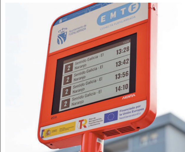
Una de las pantallas informativas AYUNTAMIENTO DE FUENLABRADA

gentedigital.es Toda la actualidad de Fuenlabrada, en nuestra página web