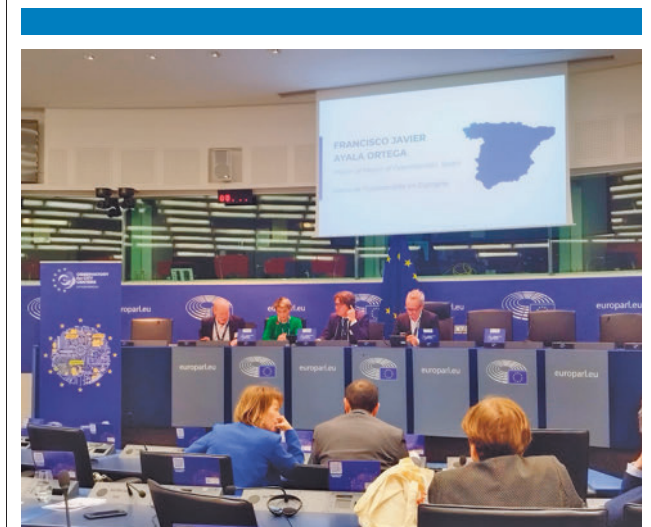
El regidor, durante su intervención en el Parlamento Europeo

El plan incluye un total de tres proyectos, que se realizarán en distintas fases del año, distribuidos en grupos de hasta 20 mujeres. Además, contarán durante dos meses con el asesoramiento de especialistas de la Fundación Santa María Real.