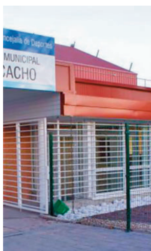
Polideportivo Fermín Cacho

una serie de iniciativas, diseñadas junto a clubes deportivos y entidades sociales, que reivindica los derechos de las personas sin importar su orientación sexual. Este domingo se celebra la Carrera de una Milla contra la LGTBIfobia