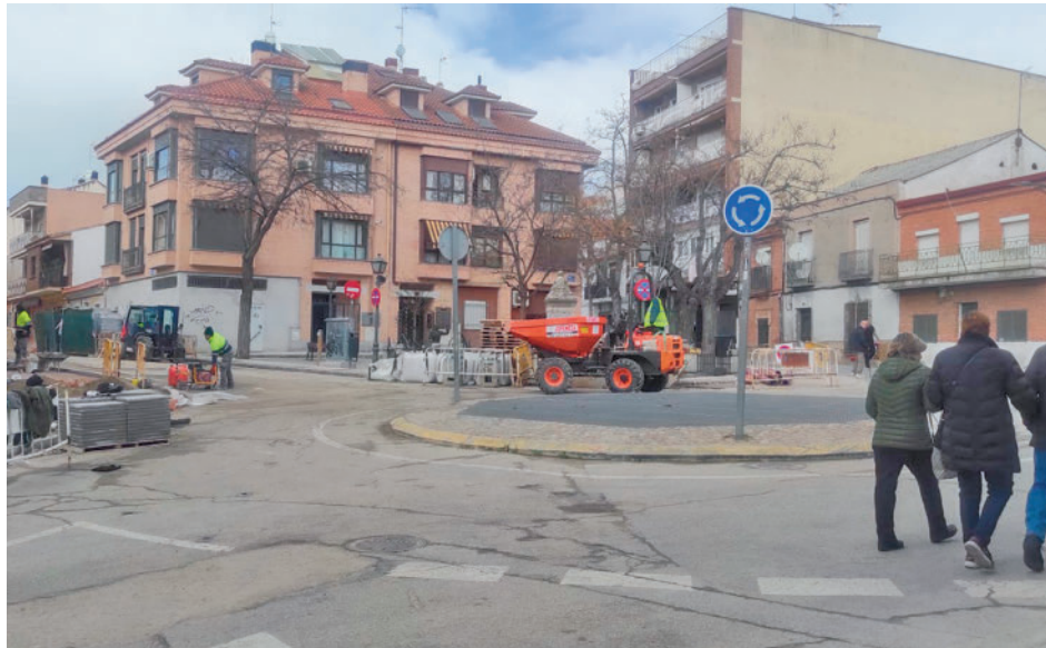
Uno de los tramos que están siendo reformados GENTE

Así lo han asegurado desde el Ayuntamiento de la localidad, que además recuerdan que es una transforma-