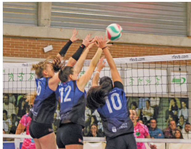
Tercera jornada en apenas siete días para el Feel