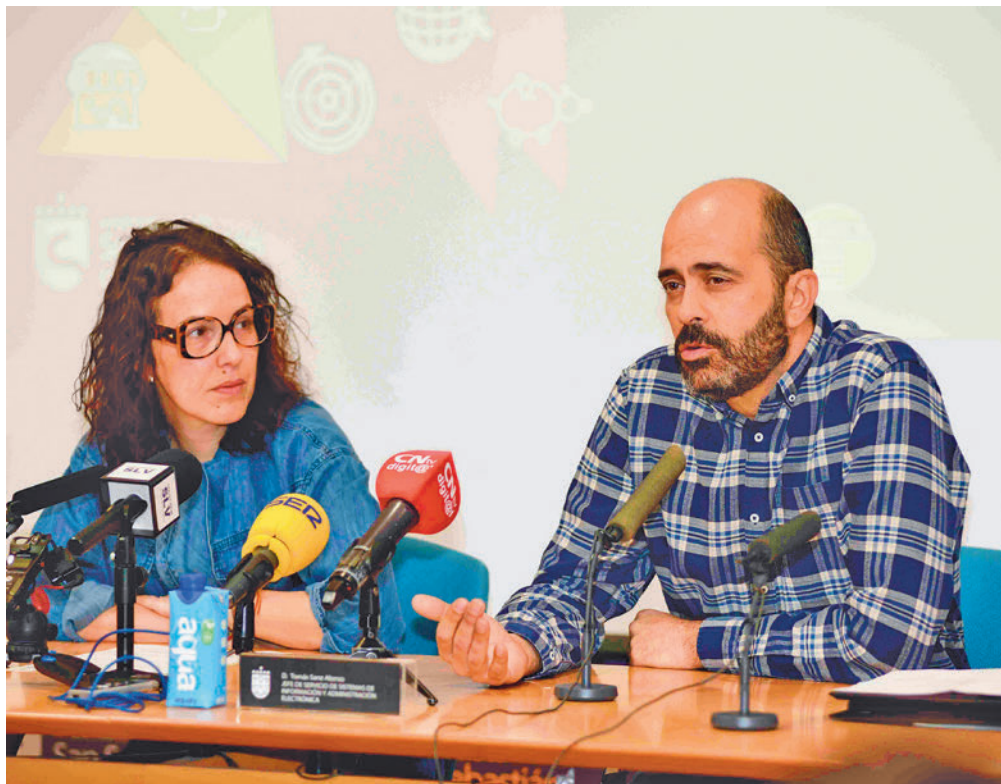
Presentación del plan de acción

YA SE HA ELABORADO UN DIAGNÓSTICO DESDE LAS ÁREAS MUNICIPALES