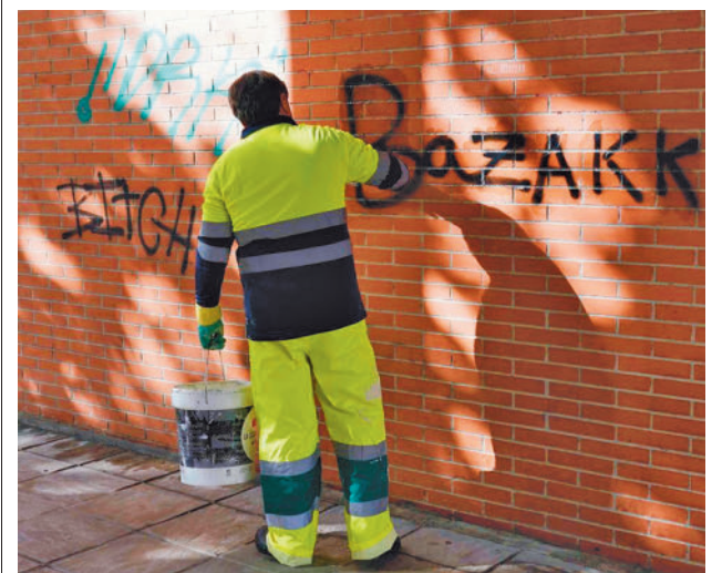
Limpieza de una fachada

gentedigital.es La actualidad de Alcobendas y Sanse, en nuestra web.