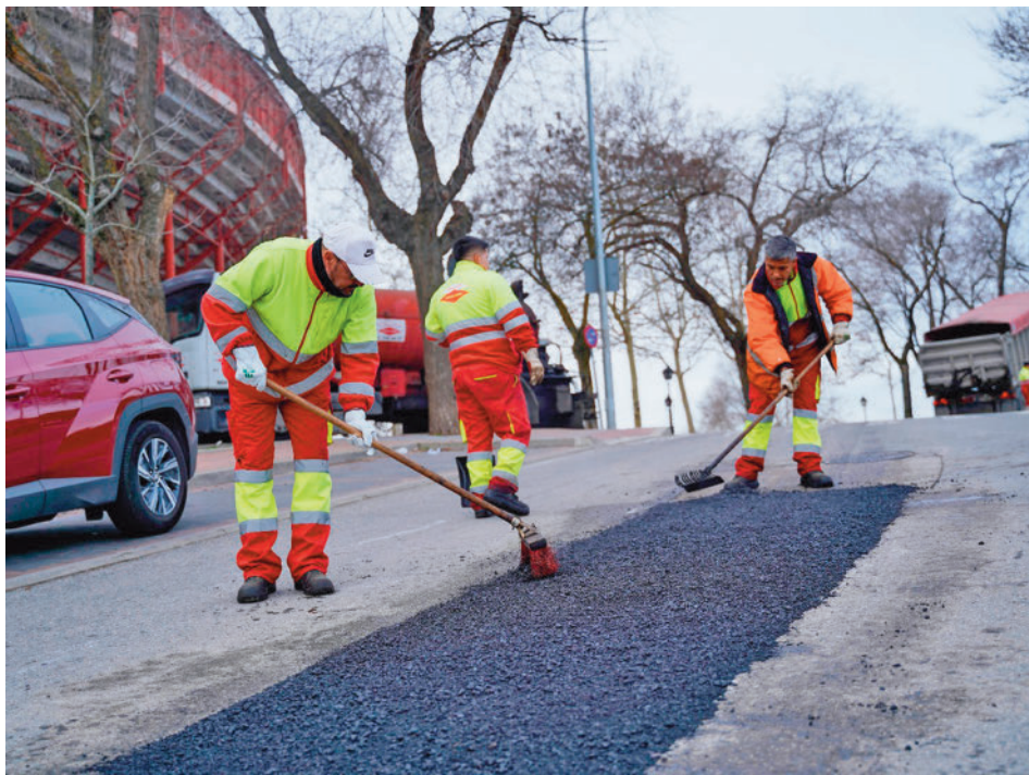
La lluvia y las bajas temperaturas han afectado a los trabajos