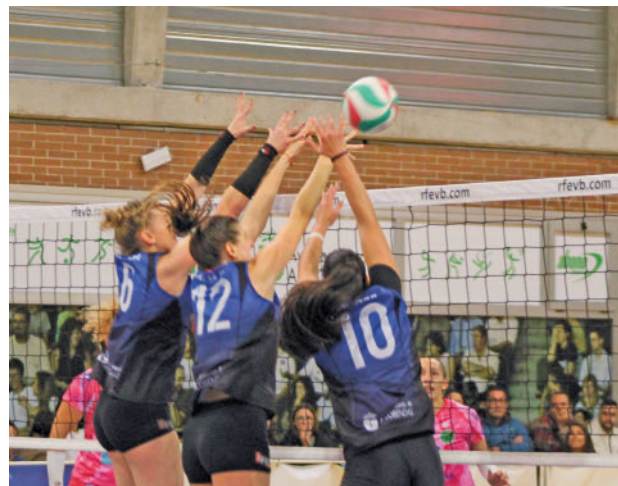
Tercera jornada en apenas siete días para el Feel