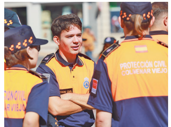
Voluntarios de Protección Civil de Colmenar Viejo

Los interesados pueden consultar los requisitos para hacerse voluntario en la página web de esta institución, https://pccolmenarviejo.wixsite.com/ . Además, se puede recabar más información en su sede física, ubicada en la calle Buenos Aires, 1; a través de uno de sus números de teléfono, 609 065 702 y 629 128 428; o en una dirección de correo electrónico, proteccioncivil@colmenarviejo.com .