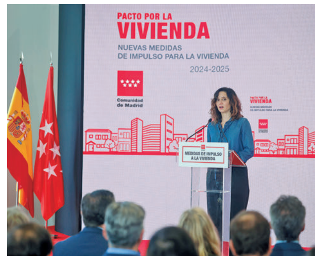
Isabel Díaz Ayuso, durante la presentación del plan