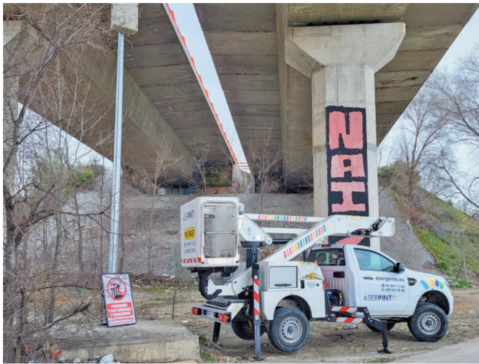
Colocación de una de las cámaras de videovigilancia

"Hace apenas dos años, en febrero del año 2022, la zona de la M-506 era prácticamen-