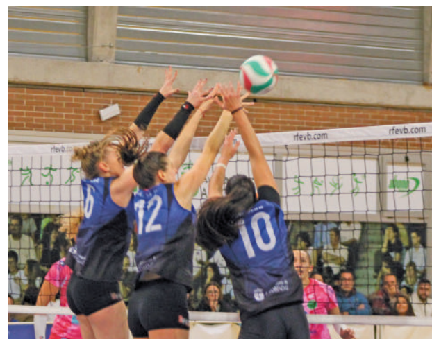
Tercera jornada en apenas siete días para el Feel