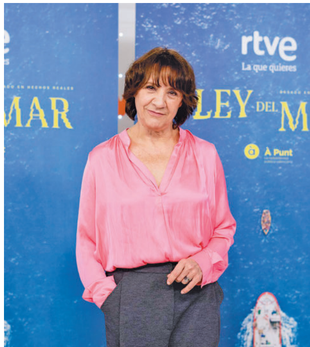
La actriz Blanca Portillo

El jurado ha seleccionado a los ganadores de los premios en base a los criterios de volumen de actividad desarrollada, la calidad artística y