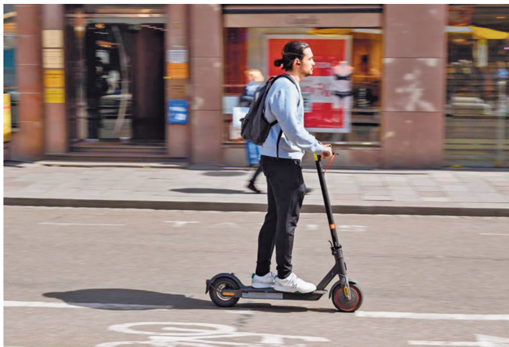
Los accidentes con patinetes eléctricos siguen al alza

Tres de cada cuatro afectados por un accidente eran hombres