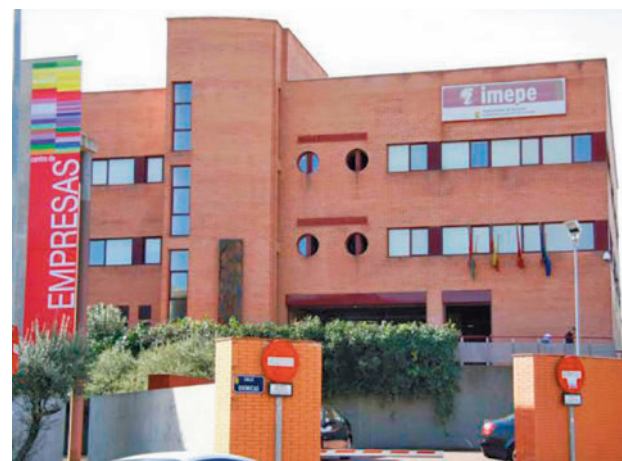
La sede del Imepe AYUNTAMIENTO DE ALCORCÓN

El expediente de contratación para la adjudicación de la iniciativa, que cuenta con un presupuesto de ejecución de 1,3 millones de euros financiados con fondos europeos, ya ha sido publicado en la Plataforma de la Contratación.