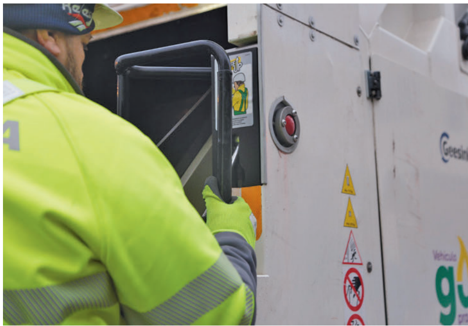
El sistema se acopla al lateral del camión AYUNTAMIENTO DE ALCORCÓN

Es un aparato al que se fija el anclaje del mono que llevará puesto el trabajador, el cual está equipado con sujetiones especiales en piernas y brazos. Del mosquetón sale un cordón metálico terminado en una bola que, para que la persona pueda amarrarse,