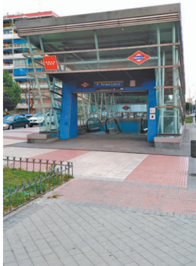
Metro de Parque Lisboa

Alcorcón sigue con sus planes de crear un aparcamiento disuasorio en las proximidades de la estación de Metro Parque de Lisboa, situada en la Línea 12. La Junta de Gobierno Local del Ayuntamiento ha aprobado la apertura de la adjudicación del contrato para ello, y para la mejora medioambiental, con el fin de optimizar el espacio y darle un uso público para los vecinos. La parcela donde se