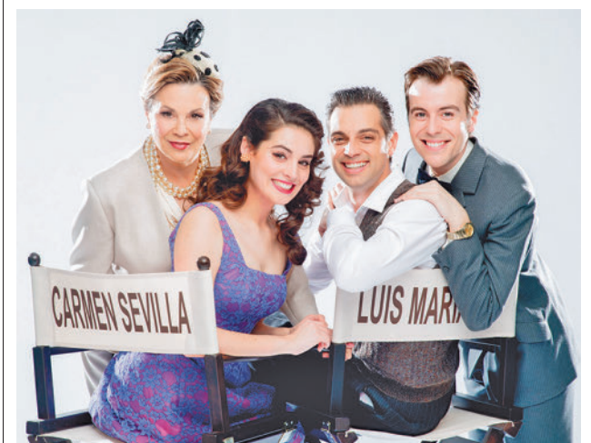
El reparto de la obra de 'Volver' TXALO PRODUKZIOAK S.L.

Con esta certificación, se reconoce la mejora continua y la apuesta por una gestión de excelencia del Área de Farmacia del hospital, que en 2023 realizó más de 25.000 dispensaciones a más de 5.300 pacientes externos. De ellos, cerca de 450 la recibieron en su domicilio. Para la consecución de esta certificación, el servicio ha realizado una autoevaluación para conocer su atención del paciente externo.