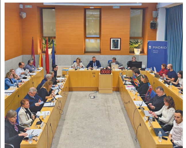
El Pleno de Centro de la semana pasada

Toda la actualidad de los distritos de Madrid, en nuestra web