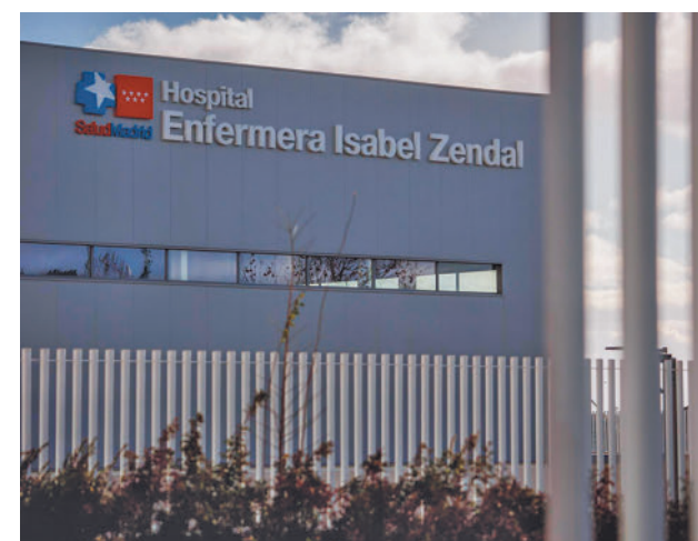
Hospital Enfermera Isabel Zendal

Será el primero de sus características en toda España y dará cobertura a las necesidades cotidianas de los afectados por esta enfermedad y sus cuidadores, al tiempo que ofrecerá prestaciones ambulatorias especializadas, según han destacado desde el Gobierno regional. En la Comunidad de Madrid hay en la actualidad unos 600 casos de ELA, y a nivel nacional, alrededor de 4.500.