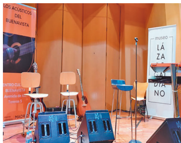
El Auditorio Museo Lázaro Galdiano

Las actuaciones, organizadas por la Junta Municipal de Salamanca, se podrán seguir además por streaming en el canal de YouTube de Los Acústicos del Buenavista.