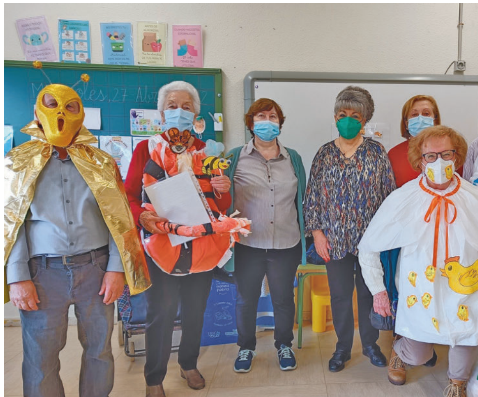
Imagen de una actividad de años pasados en un centro de mayores

Ese gran acto tendrá como broche una fiesta con animación en la propia plaza de la Constitución, donde se hará