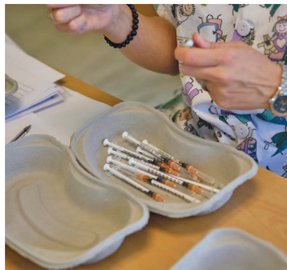
Vacunación en la Comunidad de Madrid E.P.

Casi la mitad de los consultados considera que la atención que ha recibido en la consulta de médico de familia en la sanidad pública ha sido “buena” y un 37% la considera “muy buena”, frente al 13,1% que la califica de “mala” o “muy mala”.