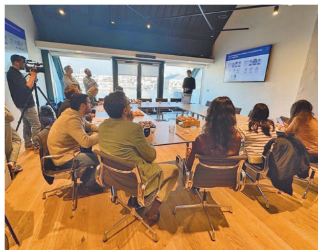
Presentación del informe

El informe apunta que uno de cada tres españoles confiesa haber pensado en dejar su