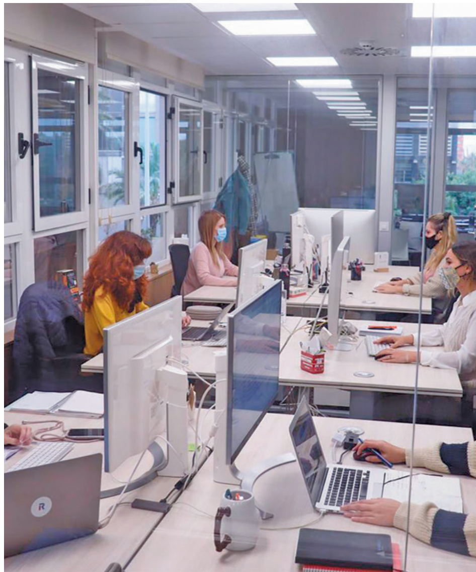
Las mujeres siguen cobrando menos que los hombres

CCOO recoge en su informe que la parte principal de la desigualdad salarial entre mujeres y hombres se explica por la diferente distribución laboral y composición del empleo. "Las mujeres soportan una inserción laboral en peores condiciones, lo que se traduce en un salario medio