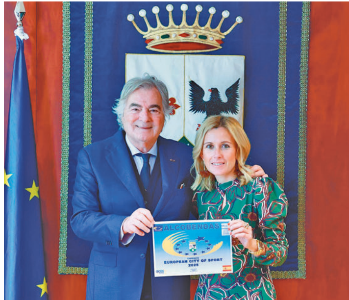
La alcaldesa de Alcobendas, junto al presidente de ACES Europa

La localidad aspira a recibir este reconocimiento de cara al próximo 2025 • Una delegación de ACES Europa visitará la ciudad en el mes de mayo para evaluar esta candidatura