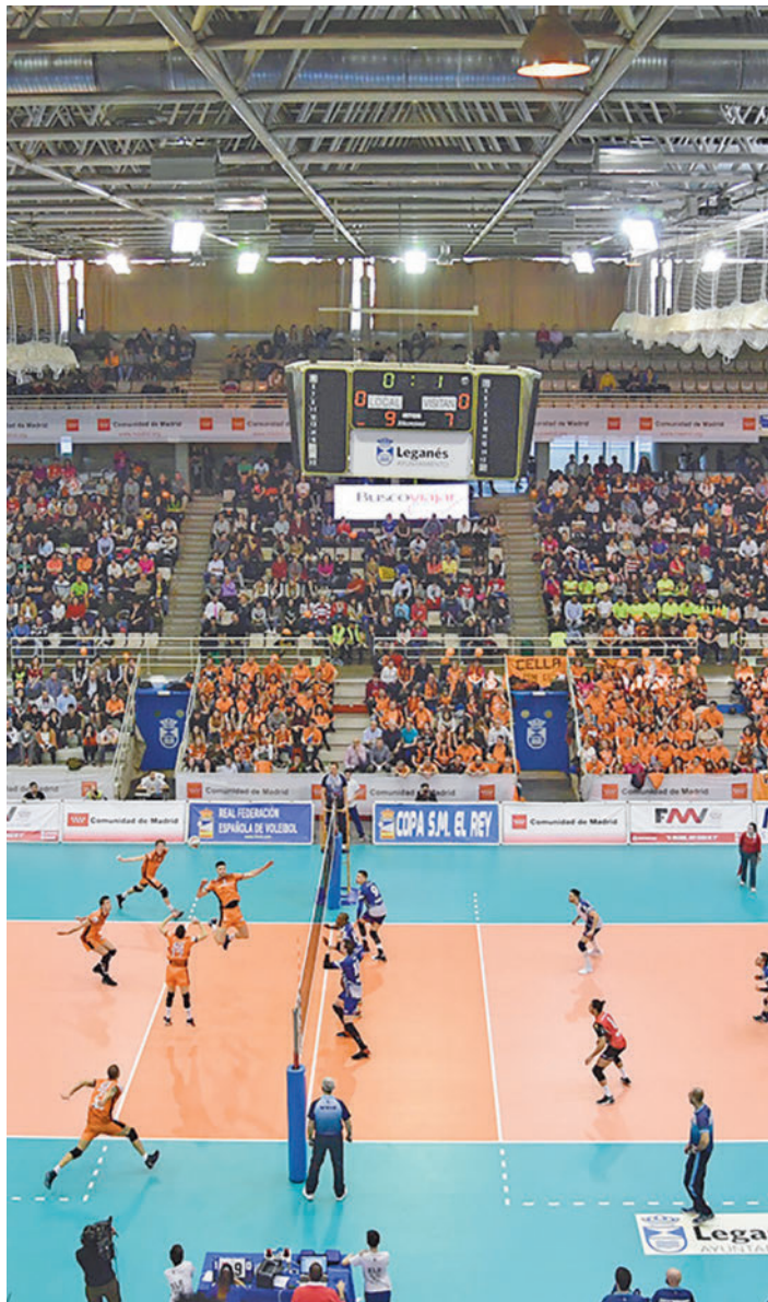
Imagen del Pabellón Europa durante la final de 2017

de este torneo que congrega a los ocho mejores equipos de la fase regular en la Superliga Masculina, lo que permitirá que, a pesar de no contar con representación en esta competición, la Comunidad de Madrid en general y Leganés en particular sean epicentros del voleibol español durante cuatro días. Concretamente