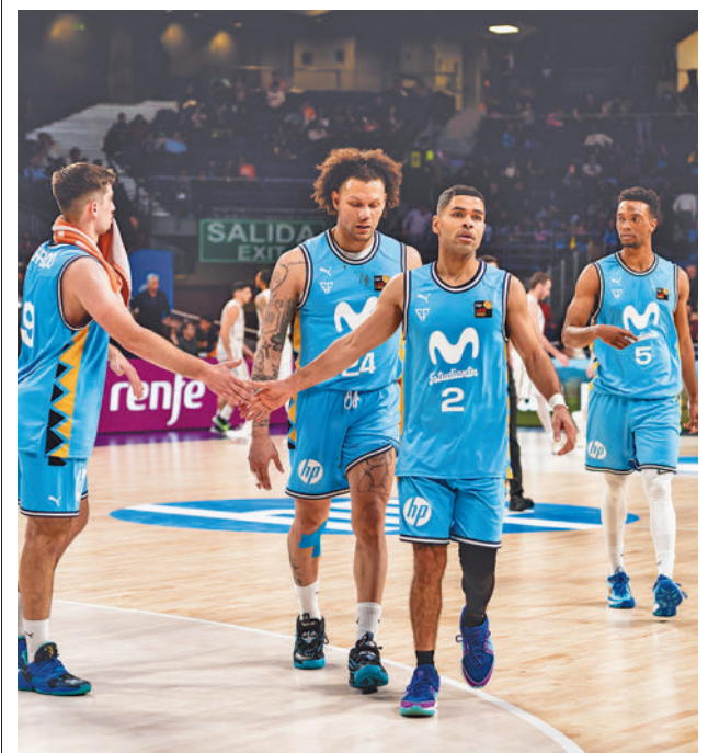
El 'Estu' ganó la pasada semana al Clavijo MOVISTAR ESTUDIANTES

Para la jornada del sábado quedan reservadas las semifinales, con los ganadores de los partidos de cuartos del jueves en primer lugar (17:30) y los vencedores del viernes a continuación (20 horas). El colofón llegará el domingo 18 con la gran final, fijada para las 17 horas. Hay que recordar que el vigente campeón es el Grupo Herce Soria, que el año pasado se impuso en la final al Pamesa Teruel Voleibol por 1-3. Las entradas ya están a la venta en la página web marcaentradas.com .