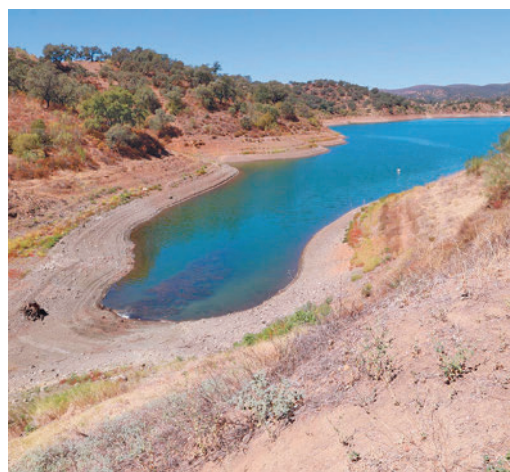
La sequía, otra amenaza para la agricultura

EL PERIÓDICO GENTE NO SE RESPONSABILIZA NI SE IDENTIFICA CON LAS OPINIONES QUE SUS LECTORES Y COLABORADORES EXPONGAN EN SUS CARTAS Y ARTÍCULOS