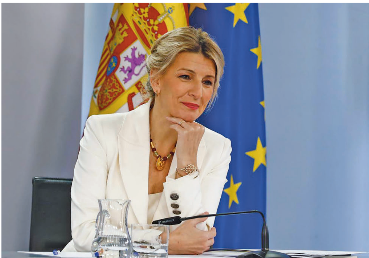
La vicepresidenta segunda y ministra de Trabajo, Yolanda Díaz, durante una comparecencia ante los medios