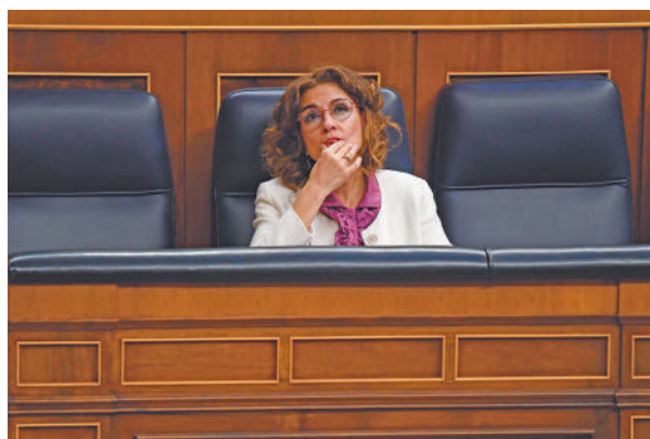
La ministra María Jesús Montero

modo, el salario mínimo interprofesional no queda sujeto a retención, dado que el mínimo exento se situará en la misma cuantía anual que el SMI. Así, se evita que los contribuyentes afectados soporten retención o ingreso a cuenta.