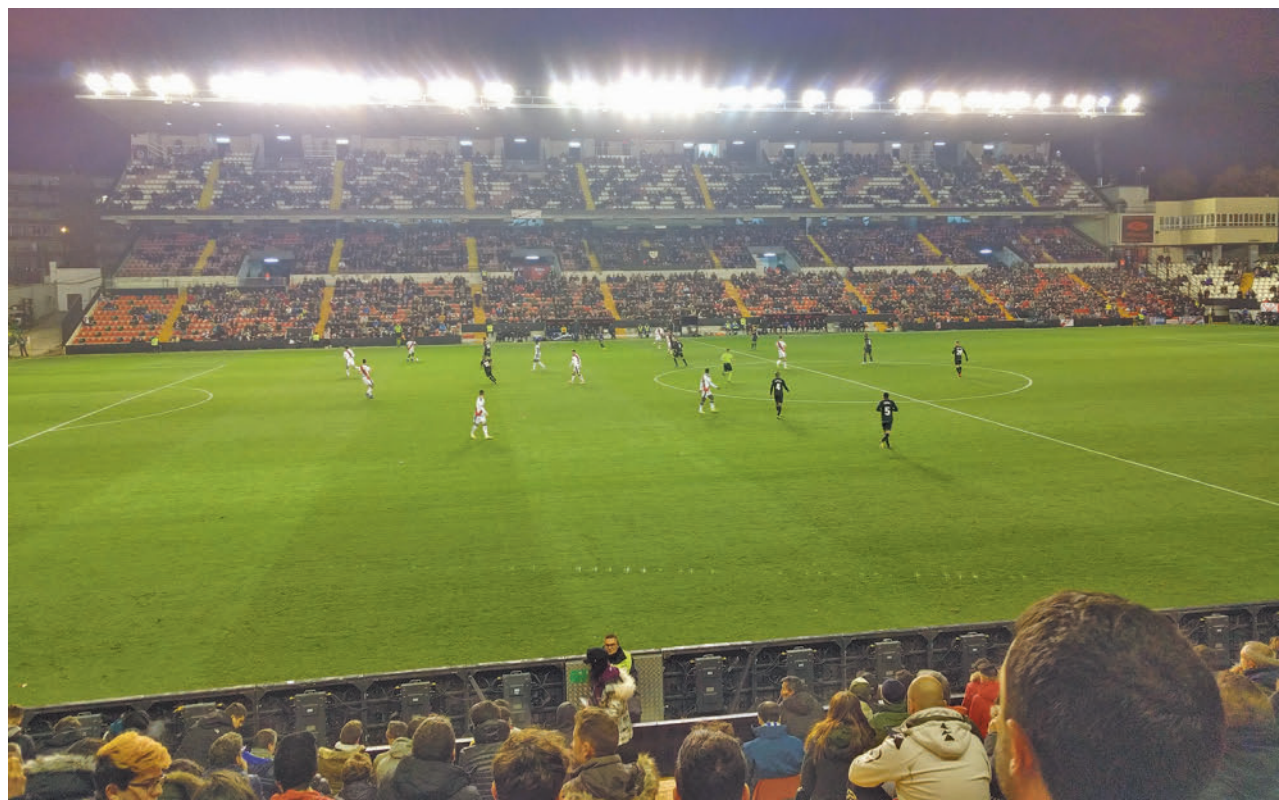
Partido del Rayo Vallecano en el Estadio de Vallecas

Isabel Díaz Ayuso señala que el Estadio de Vallecas, de propiedad regional, es "insostenible" • Tanto la Comunidad como el club franjirrojo estarían buscando una alternativa y la intención de ambas partes es no salir del distrito