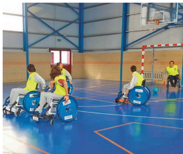
Demostración de foosball

Toda la información de Leganés, en nuestra página web.