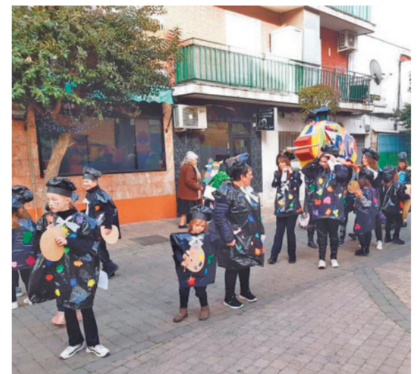
Entierro de la Sardina en La Fortuna

el desfile del Entierro de la Sardina con cuatro asociaciones. Saldrán de la Plaza de España y recorrerán la Plaza de París, la calle Mediodía, la Plaza Fuente Honda, la calle Antonio Machado, la Plaza de España, la calle Getafe, la avenida Gibraltar, la calle El Maestro, la calle AC/DC y finalizarán en el Recinto Ferial. Allí tendrá lugar la tradicional quema de la sardina, la entrega de premios, un reparto de sardinas y se despedirá el carnaval con fuegos artificiales.