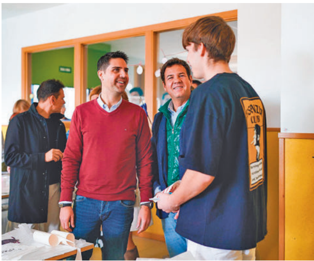
Visita a uno de los centros