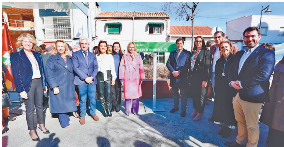
Foto de familia de los asistentes a la inauguración