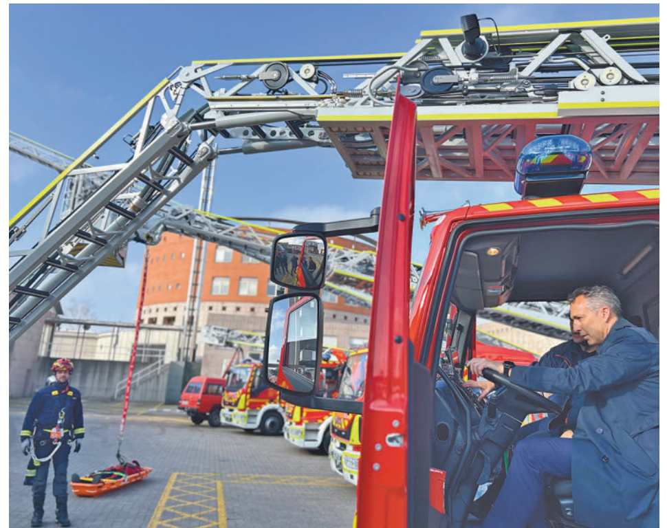
Uno de los nuevos vehículos con autoescalera

Esta semana se han presentado cuatro nuevas unidades en Las Rozas, que han costado casi 4 millones de euros ● Estos vehículos se utilizan sobre todo para el rescate de personas