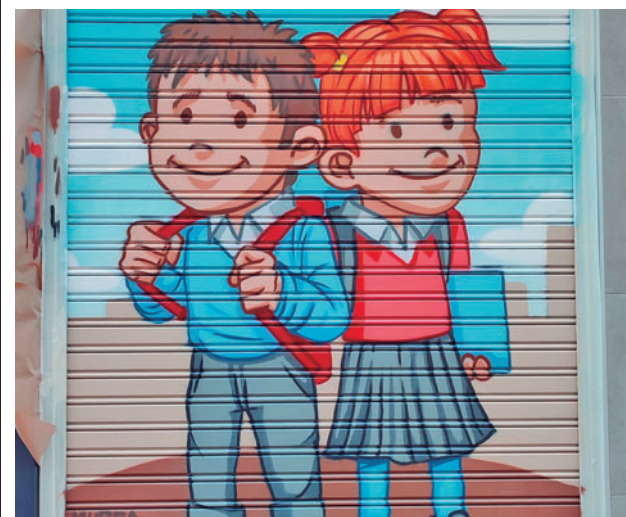
Cierre de la tienda Apolo Uniformes