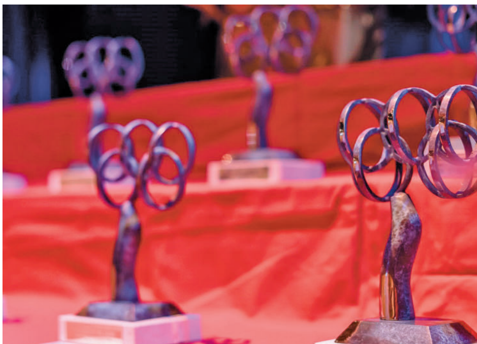
Estatuillas de ediciones anteriores