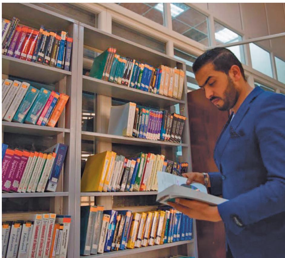
Los madrileños leen más que el resto de españoles

La UCI Pediátrica atiende cada año a más de 900 niños en estado crítico de todo el territorio nacional y con una gran complejidad médico-quirúrgica, como trasplantes, cardiopatías congénitas, politraumatismos, accidentes y oncología.