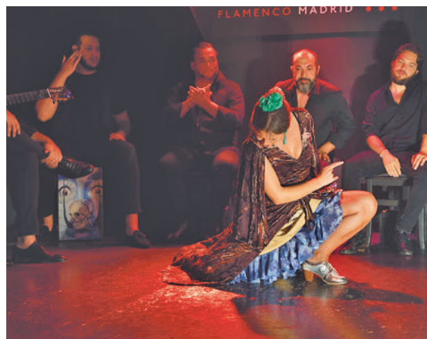
Espectáculo flamenco en Madrid

La presencia de los tablaos flamencos en Madrid también es destacada en la actualidad, recuerda la Comunidad, con el Corral de la Morería, Torres Bermejas, Tablao 1911 (antiguo Villa Rosa) y Tablao de la Villa (antiguo Café de Chinitas) como los más antiguos, preservando su estructura arquitectónica y su decoración original desde los años 50 y 60.