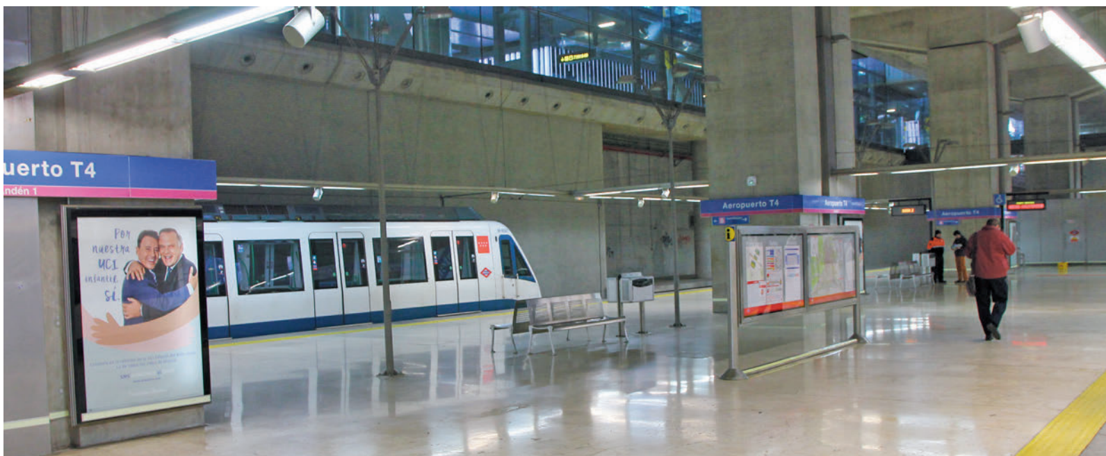
Actual andén de la Línea 8 de Metro en el aeropuerto de Barajas