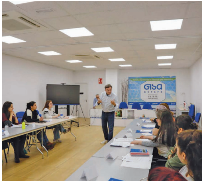
Formaciones anteriores AYUNTAMIENTO DE GETAFE

A las asistentes se les enseñará el proceso completo de creación del negocio, desde el desarrollo de la idea, hasta la constitución de cada uno de los proyectos empre-