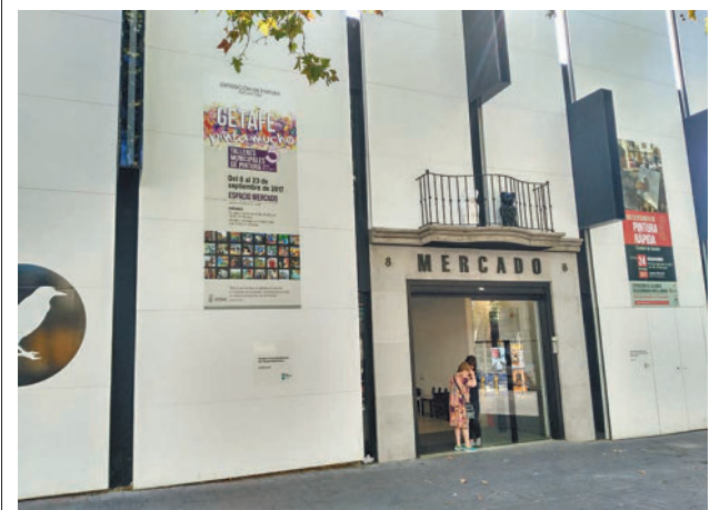
Fachada del Espacio Mercado GENTE

A las alumnas también se les da la información necesaria sobre los permisos y otras autorizaciones de las administraciones, las herramientas para conseguir e incrementar los ingresos, la realización de un Plan de Marketing, la comunicación para PYMES, los instrumentos financieros para el desarrollo del negocio; el emprendimiento en clave de género y la metodología de aprendizaje para el mundo de la empresa.