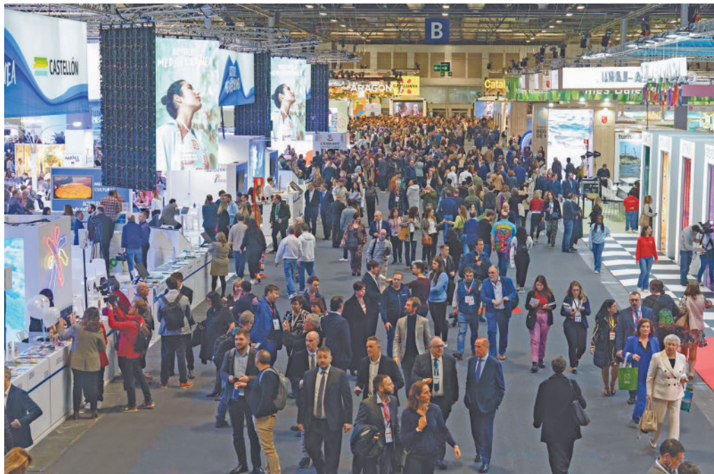
Pasada edición de Fitur

La feria ha destacado que el evento ha batido el récord de superficie de exposición con un total de nueve pabellones, uno más que en 2023, así como por la consolidación de su influencia global