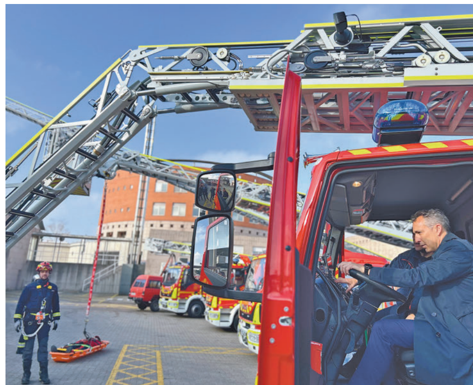
Uno de los nuevos vehículos con autoescalera

Esta semana se han presentado cuatro nuevas unidades en Las Rozas, que han costado casi 4 millones de euros ● Estos vehículos se utilizan sobre todo para el rescate de personas