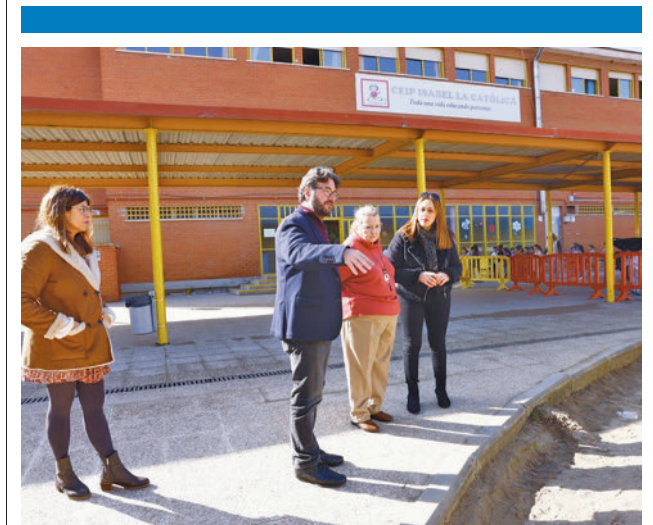
El alcalde visita las instalaciones