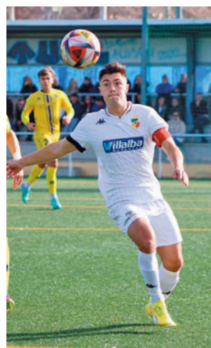
Triunfo vital en Alcorcón

En lo que respecta a la zona alta, el Real Madrid C dio un golpe de autoridad al golear a Las Rozas (6-0) antes de visitar el campo del penúltimo, el Trival Valderas. Segundo vuelve a ser un CD Móstoles que juega con el Moscardó.