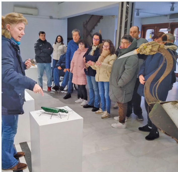
Visita del pasado viernes a la sala de exposiciones

La iniciativa comenzó el pasado viernes 26 de enero con la visita guiada que realizaron 16 personas mayores de 45 años usuarias del Centro Ocupacional Estrella de Elola a la sala de exposiciones Juan Prado. Las citas, de dos horas de duración, tendrán lugar una vez al mes hasta el próximo junio y la siguiente será un recorrido por la ermi-