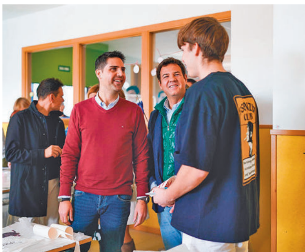
Visita a uno de los centros