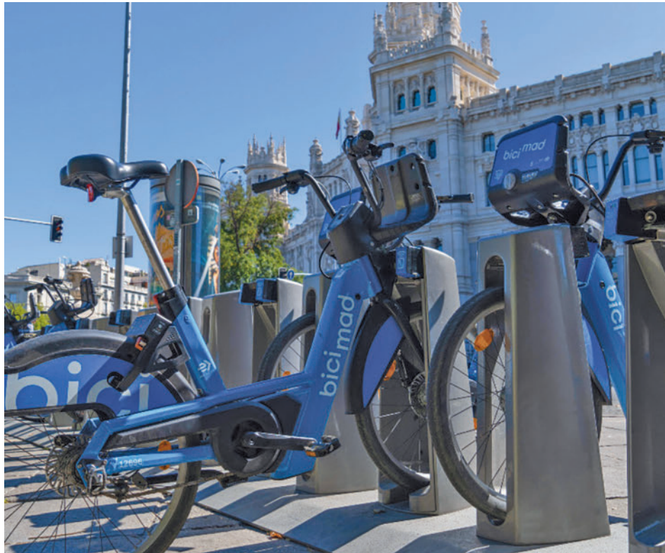
La base de Bicimad situada junto al Palacio de Cibeles

Desde Cibeles añaden que se trata de un contrato flexible, puesto que esta tarifa plana autorrenovable no exige permanencia y, una vez con-