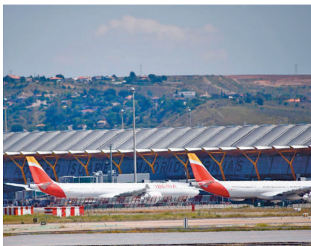
El Aeropuerto Adolfo Suárez-Madrid Barajas

"Vivimos en los años decisivos de la crisis climática, seguir aumentando la capacidad operativa de Barajas es una mala idea. Equivocarse en las prioridades, ahora, tiene un coste que no podemos pagar", denunciaron estos colectivos.