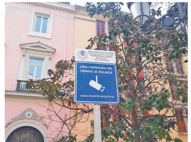
La señal que anuncia la presencia de cámaras de vigilancia

“No responde a una demanda de los vecinos, sino de la propia Policía Municipal cuando se iba a producir la remodelación de la plaza”, dijo.