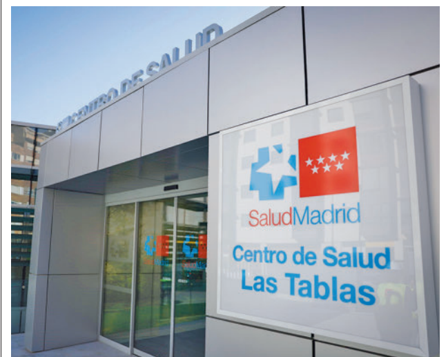
El nuevo centro de salud de Las Tablas

El concejal de Hortaleza se comprometió a repetir esta iniciativa el próximo año.