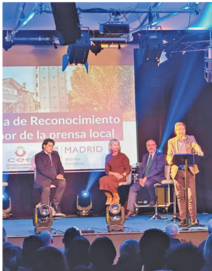
Un momento de la jornada

'La Información local a lo largo de dos siglos', Perspectivas de medios nacionales con enfoque local' y 'Explorando el futuro de la información local', donde estuvieron presentes destacados periodis-