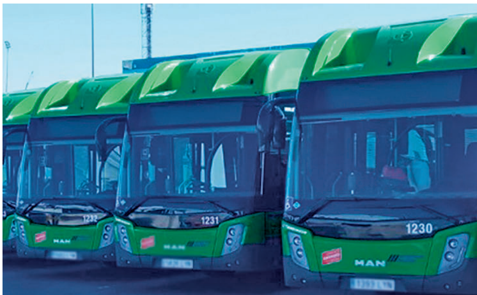
Autobuses del Grupo Ruiz GRUPO RUIZ

Toda la información de Fuenlabrada, en nuestra página web.