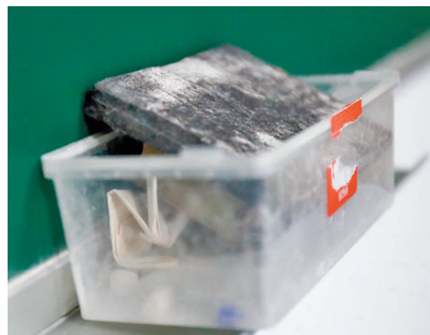
La LGTBfobia está presente en las aulas E.P.

Hasta el 25% de los alumnos que contestaron la encuesta, según ha explicado el colectivo, no se considera heterosexual, y un 1,5% manifestó haber sufrido acoso LGTBfóbico. Según la organización, estos datos reafirman la “imperiosa necesidad” de “garantizar entornos educativos seguros y respetuosos para todas las identidades”. También subraya “la importan-