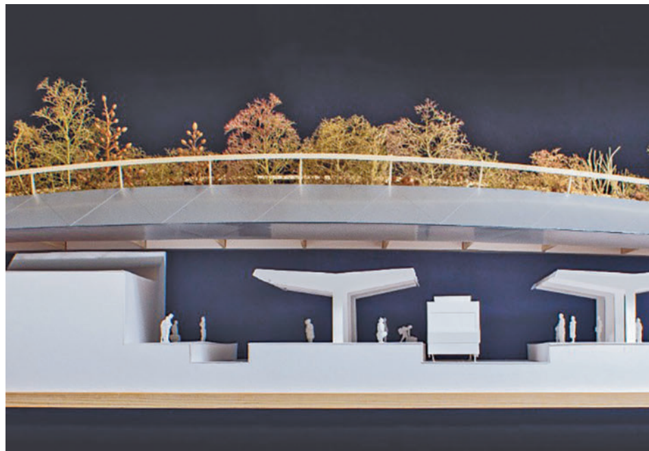
Así será el nuevo 'Parqueducto'

La pasarela tendrá una longitud de 68 metros y una anchura de 10 metros. Además, el proyecto incluye la remodelación de la plaza de