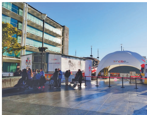
Jornadas sobre nuevas tecnologías INCIBE RRSS

ra a los asistentes para reforzar los niveles de ciberseguridad. La '#ExperienciaINCIBE' es un amplio espacio móvil que consta de tres zonas diferenciadas: una de gamificación para juegos 'online', donde los visitantes se acercarán a la ciberseguridad mediante minijuegos adaptados a cada edad; el espacio para las charlas y talleres; y un scape room.