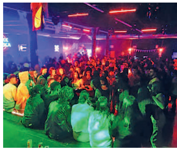
Una de las fiestas que se han celebrado en la Casa de la Música