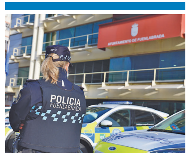
Una agente de la Policía Local AYUNTAMIENTO DE FUENLABRADA

En concreto, la Sala de lo Social ha estimado el recurso de casación para la unificación de doctrina interpuesto por CCOO Sanidad Madrid contra la sentencia dictada por el Tribunal Superior de Justicia de Madrid (TSJM) que permitía que el citado centro despidiera a una trabajadora interina de mayor antigüedad que otros contratados interinos para cubrir los puestos de los 410 opositores que consiguieron plaza fija en la Oferta Pública de Empleo (OPE) de 2019.