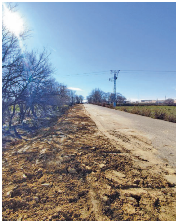
Uno de los lugares donde se han retirado los residuos