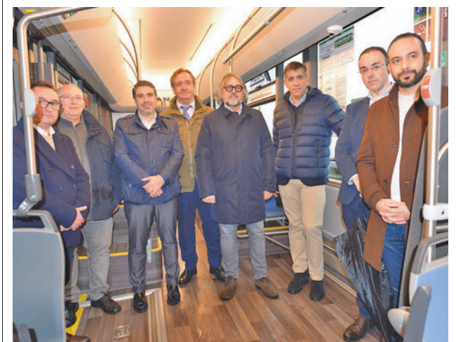
Presentación de los vehículos

Se trata, según fuentes municipales, de una medida refrendada por gran parte de los propietarios minoritarios del suelo, "miembros que se han dirigido al Ayuntamiento, unos de manera verbal y otros de manera escrita" para solicitar que sea el Consistorio, "como organismo de control y tutela" el que asuma la iniciativa. El Ayuntamiento de Parla espera que en esos casi 5,78 millones de metros cuadrados se puedan generar hasta 30.000 empleos en los próximos años.