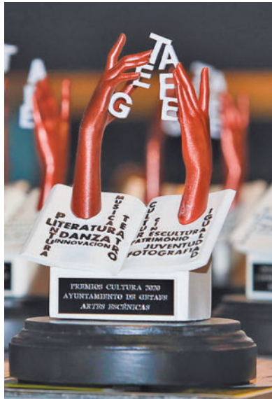
Premios de la Gala de la Cultura

Una trayectoria que el Partido Popular quiere que sea reconocida poniendo su nombre a un espacio público del municipio. También propone que se le otorgue un