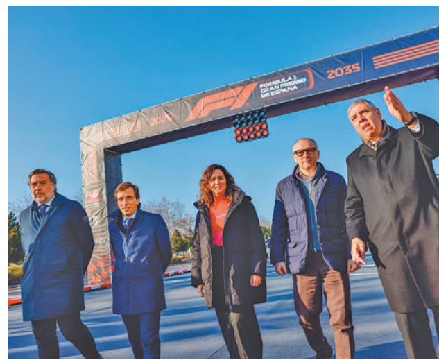
Presentación de la Fórmula 1 en Ifema