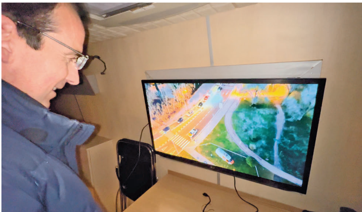
El alcalde visiona las imágenes tomadas por los nuevos drones de la Policía Local