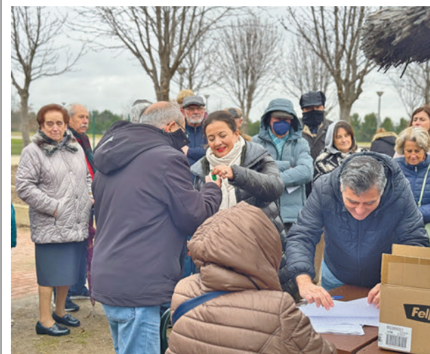
Entrega de los huertos

La última fase del proyecto, aún sin fecha, consistirá en que técnicos de Ecuador se desplazarán a España a continuar su formación e intercambio de experiencias profesionales en el Ayuntamiento de Leganés y en otros Consistorios como Alcobendas.