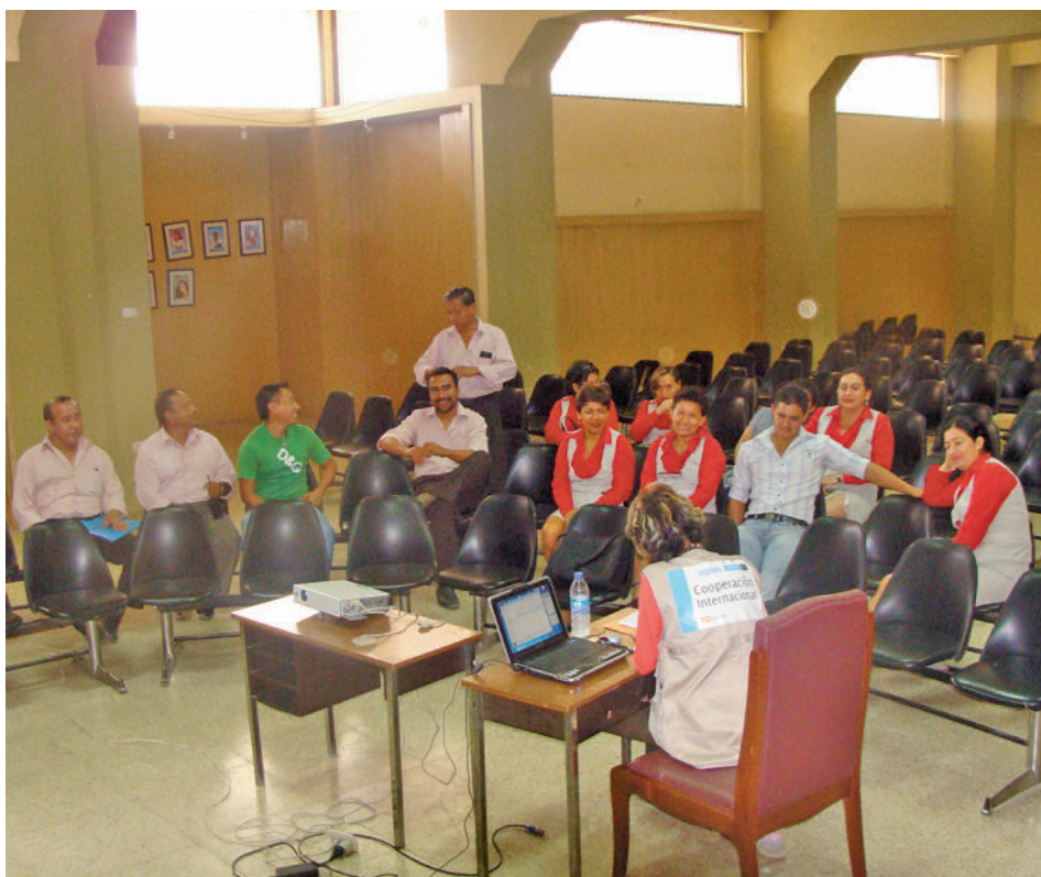
Entre las fases del proyecto se incluye una visita a la localidad ecuatoriana