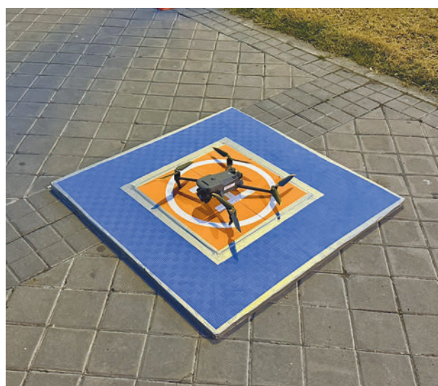
Uno de los drones de la Policía Local

Fuentes municipales han asegurado que, desde su puesta en funcionamiento, han permitido la tramitación de varias denuncias por vertidos ilegales de residuos en el término municipal, en dis-