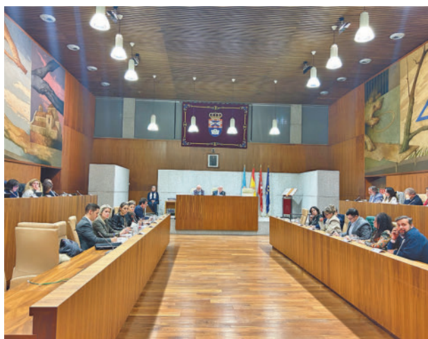
Pleno de Leganés