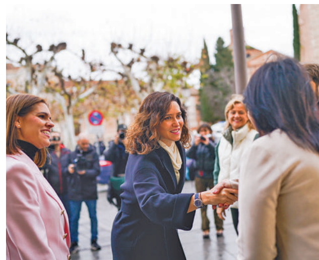
Díaz Ayuso, durante su visita a Alcalá