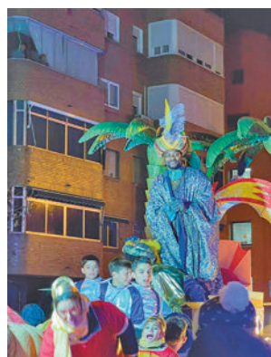
La carroza del Rey Baltasar