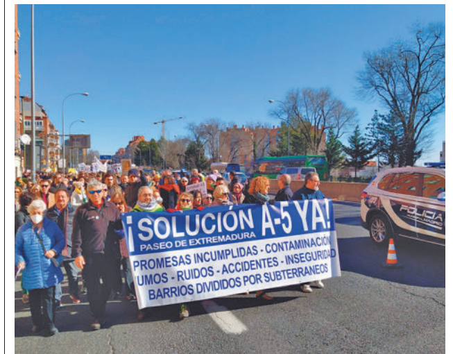
Una de las protestas vecinales a favor del soterramiento FRAVM

"Se va a dar continuidad a este tramo, de tal manera que se pueda remodelar también el enlace de la avenida de Los Poblados y llegar hasta la finalización de la Operación Campamento", dijo el edil.