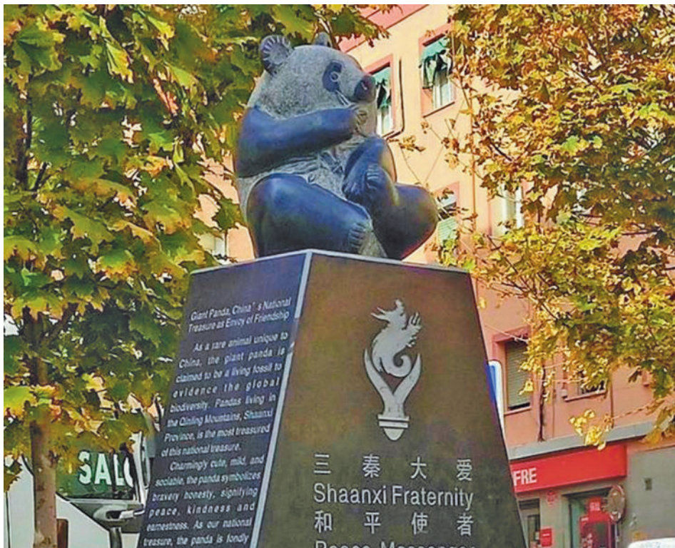
La escultura del Oso Panda Mensajero de la Paz, en la plaza del Hidrógeno @SOMBRADENADA