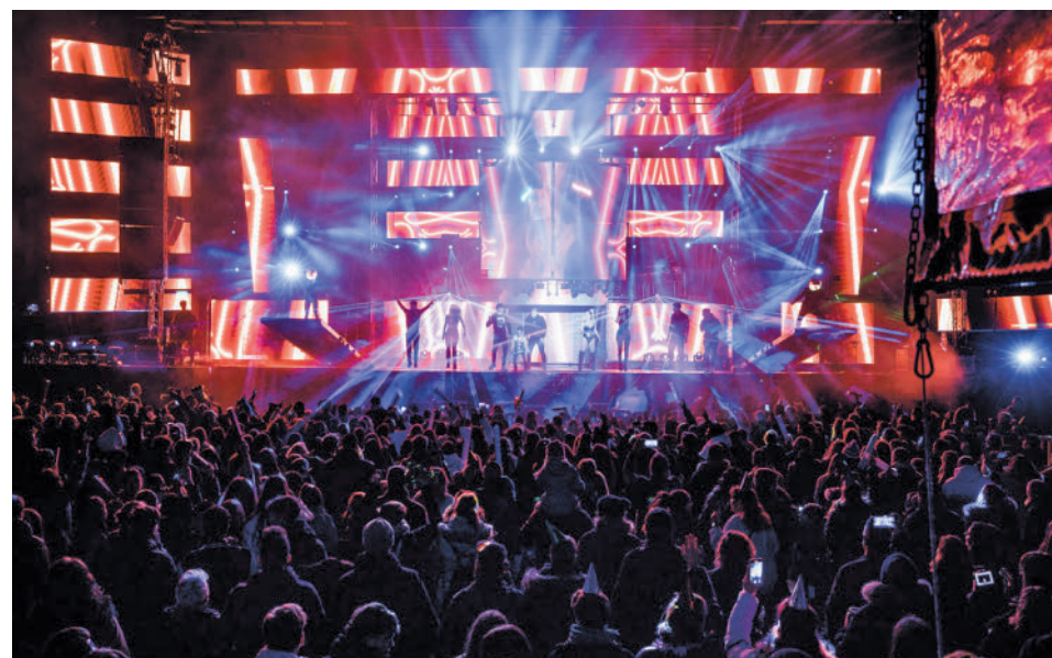
La fiesta de preuvas se celebrará el sábado 30 en Pinto

Durante los próximos días los vecinos de Parla tendrán espectáculos como 'Maestros de la magia' (sábado 23, Teatro Jaime Salom), las sesiones de circo callejero que se podrán ver los días 26, 27, 28 y 29 en varios emplazamientos de la ciudad como el Parque del Universo o las preuvas del