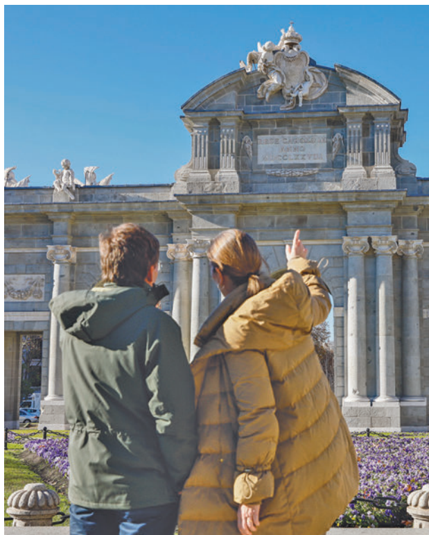
El alcalde, durante la visita al monumento

“De este modo, se ha podido comprobar la compatibilidad de los materiales, su durabilidad, resistencia al en-