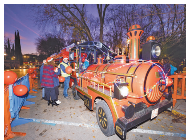
Tren de la Navidad en Pinto

Entre el viernes 22 y el domingo 24 un tren recorrerá todas las calles de la ciudad, mientras que durante toda la semana habrá actuaciones en el Teatro Francisco Rabal y en las bibliotecas. El sábado 30 habrá preuvas en el Recinto Ferial desde las 18 horas, mientras que el viernes 5 llegarán Sus Majestades de Oriente, que partirán a las 17:30 horas del Recinto Ferial.