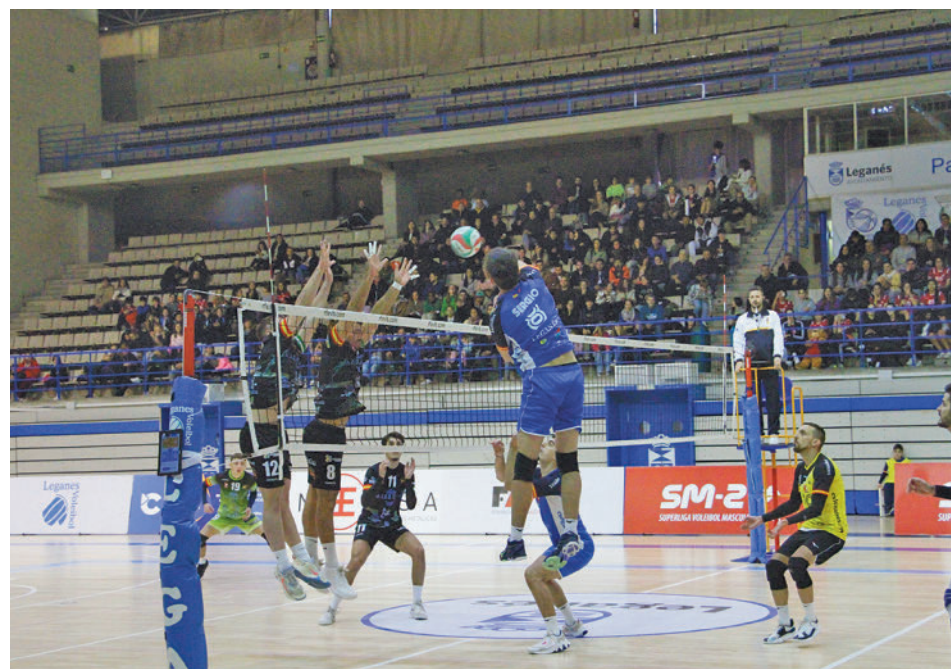
Nueva victoria como local del CVLeganes.com en Superliga Masculina 2

Puntos: Ambos equipos cierran la primera vuelta sin conocer la derrota