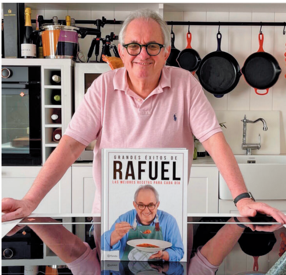
@Rafuel55 se ha 'colado' en miles de hogares con sus recetas