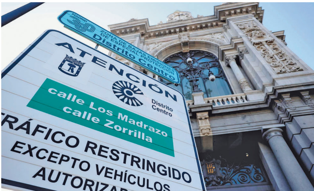
Señal de restricción en el centro de Madrid