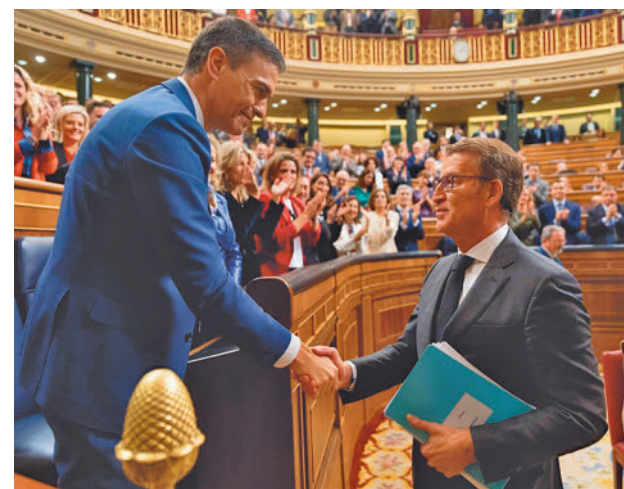
Sánchez y Feijóo se saludan en el Congreso

El presidente del Gobierno no ocultó que le había sorprendido esta propuesta porque es "inédito" que la reunión entre el presidente y el líder de la oposición no se celebre en Moncloa, pero ha decidido aceptar la condición. "No desisto a que en un futuro usted venga al Palacio de la Moncloa y le pueda recibir yo como jefe de la oposición", ha indicado a continuación.