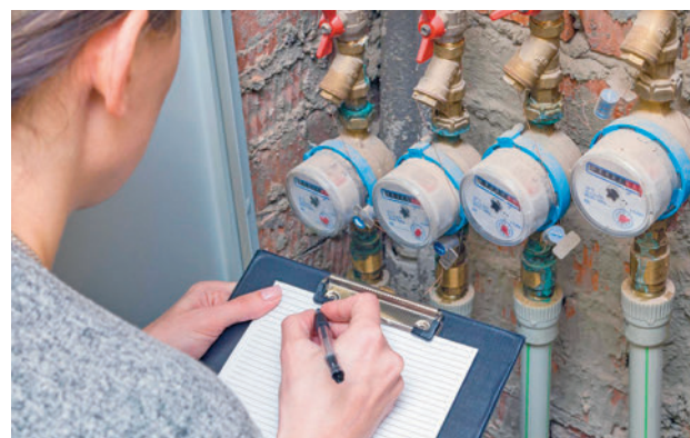
Contadores de agua

Además, si el usuario va a estar fuera de su domicilio