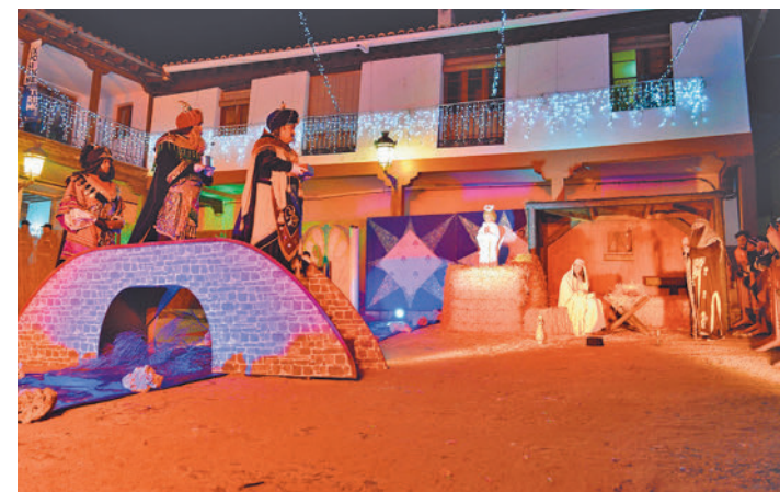
Los Reyes Magos, en Valdemoro