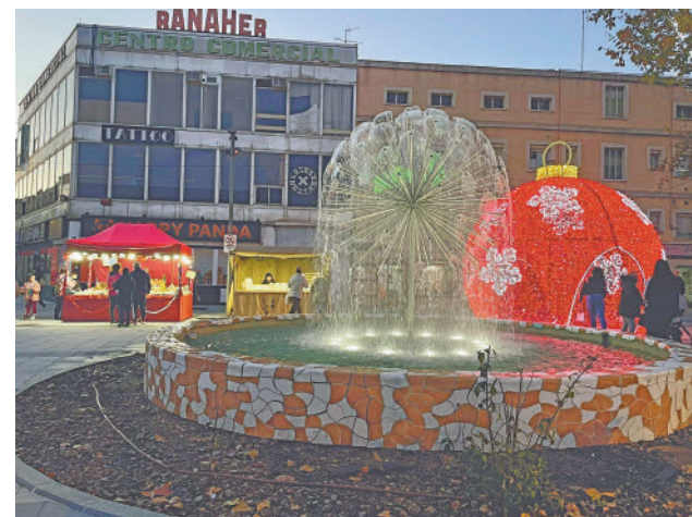
Iluminación navideña en Parla

Toda la actualidad de la zona Sur, en nuestra página web