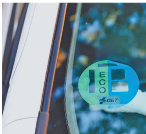
Vehículo con etiqueta ECO

EL PERIÓDICO GENTE NO SE RESPONSABILIZA NI SE IDENTIFICA CON LAS OPINIONES QUE SUS LECTORES Y COLABORADORES EXPONGAN EN SUS CARTAS Y ARTÍCULOS