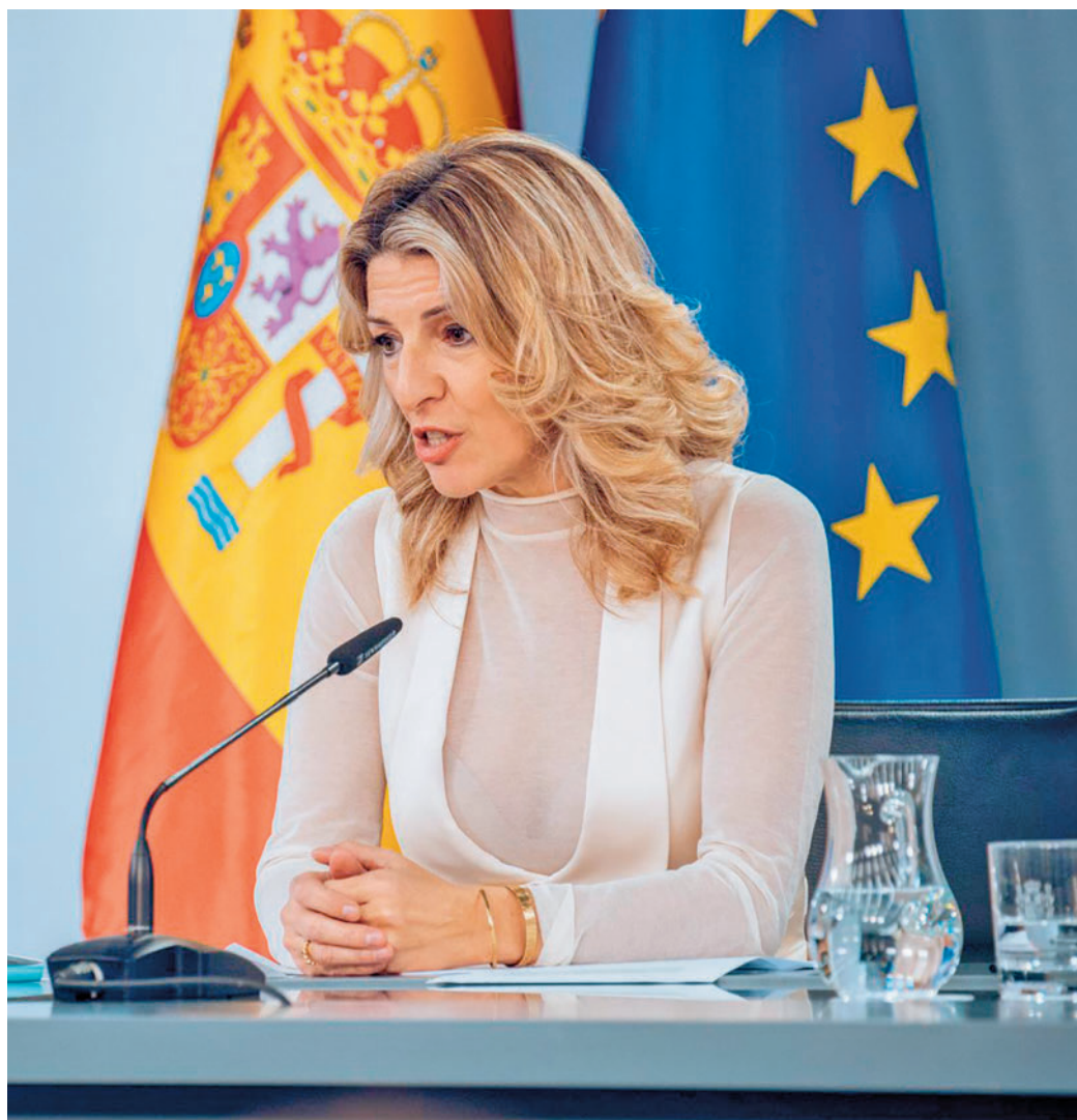
La ministra de Trabajo, Yolanda Díaz, durante el Consejo de Ministros

La norma también establece la posibilidad de compatibilizar el subsidio por cada nuevo empleo a tiempo completo o parcial durante los primeros 180 días sin pérdida de cuantía a través de la percepción de un complemento de apoyo al empleo, que irá desde el 5% hasta el 80% del Iprem en función del trimestre de percepción, de si el puesto de trabajo es a tiempo completo o a tiempo parcial y de las horas trabajadas. La ayuda estará vinculada a un itinerario personalizado de activación para el empleo.