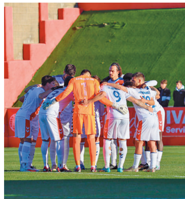
El Rayo Majadahonda está en una situación complicada