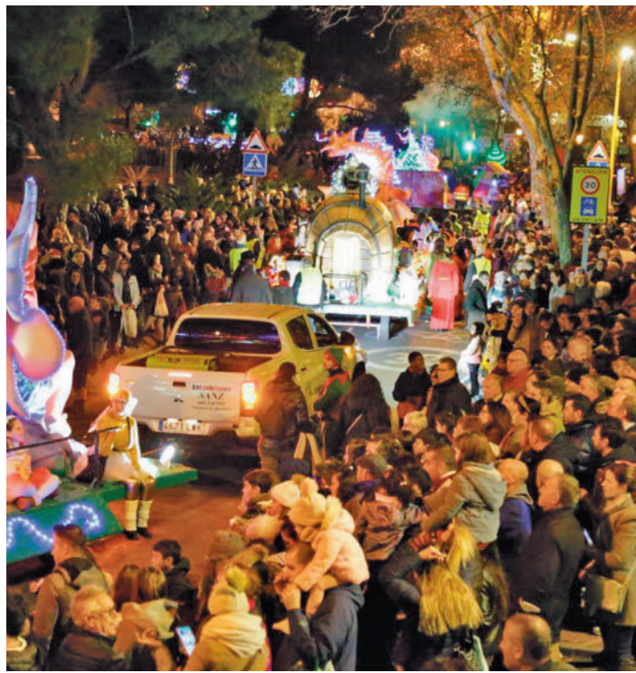
Imagen de archivo de la Cabalgata de 2022

Además, por primera vez, paseos gratuitos en tres globos aerostáticos, que estarán situados en el Parque Mayarí,