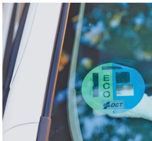
Vehículo con etiqueta ECO

EL PERIÓDICO GENTE NO SE RESPONSABILIZA NI SE IDENTIFICA CON LAS OPINIONES QUE SUS LECTORES Y COLABORADORES EXPONGAN EN SUS CARTAS Y ARTÍCULOS