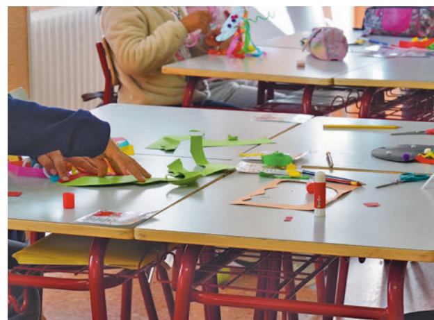
Imagen de archivo de campamentos anteriores

Toda la actualidad de Alcorcón, en nuestra página web