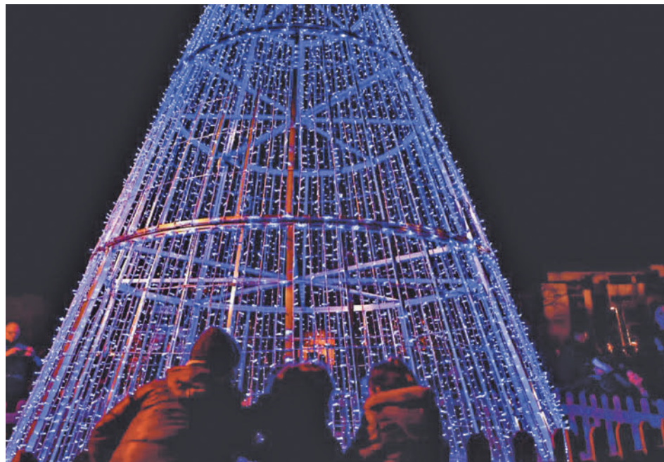
Iluminación navideña en Pinto

Contará con puestos artesanos y mercaderes, integrando a los comerciantes locales que ofrecerán sus productos de calidad (textil, perfumería, alimentación, ocio...) a los pinteños y turistas. Además, la programación diseñada por el área de Comercio