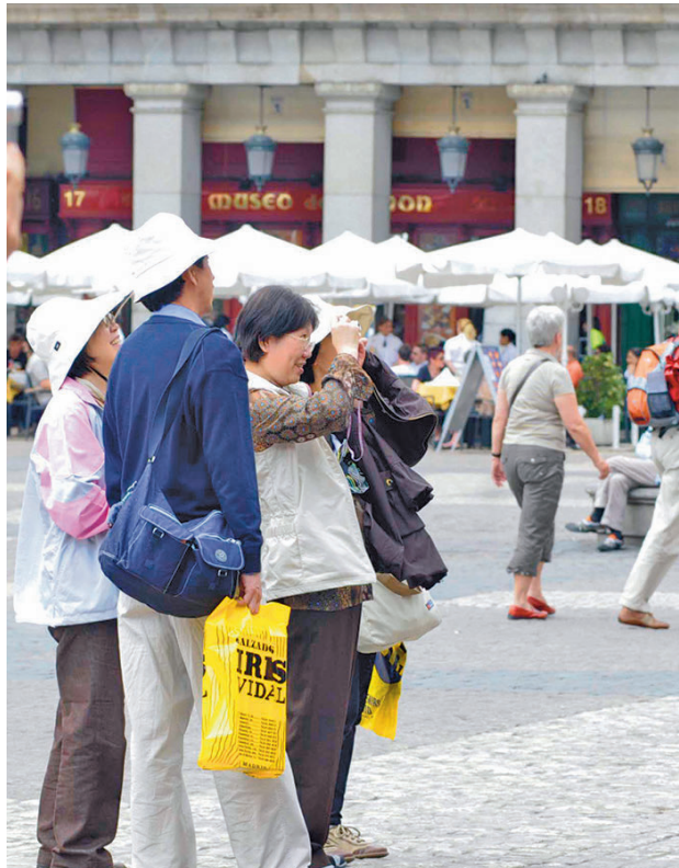
Varios turistas hacen fotografías en la Plaza Mayor

Esta lista se elabora teniendo en cuenta más de medio centenar de parámetros divididos en seis áreas: 'Competitividad económica y empresarial', 'Competitividad turística', 'Infraestructura turística', 'Política y atractivo turístico', 'Salud y seguridad' y 'Sostenibilidad'. Precisamente, Madrid es líder en esta última categoría, "por su apuesta y compromiso con el medio ambiente y su objetivo