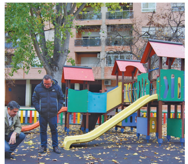
El alcalde visitó una de las zonas

Con cargo al contrato de conservación y mantenimiento de áreas infantiles, de mayores y circuitos elementales por un importe cercano al millón de euros y una vigencia de cuatro años, se han remozado ya 75 de ellas, "lo que garantiza unas condiciones de uso óptimas y adecuadas para que los menores disfruten con seguridad mientras