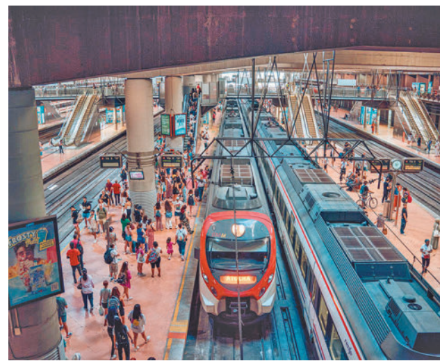
El túnel de Sol ya no sufrirá cortes