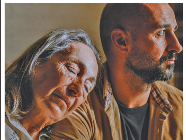
Fotograma del corto 'Paris 70', de Dani Feixas

Por segundo año consecutivo, los Premios Alcobendas Huella Cero están abiertos a todas las organizaciones de la ciudad comprometidas con la sostenibilidad y que quieran destacar sus contribuciones positivas al medio ambiente. Para consultar las bases completas, requisitos, y detalles de la presentación de propuestas deben dirigirse a la web www.alcobendashuellacero.org o mandar un correo a info@alcobendashub.org .