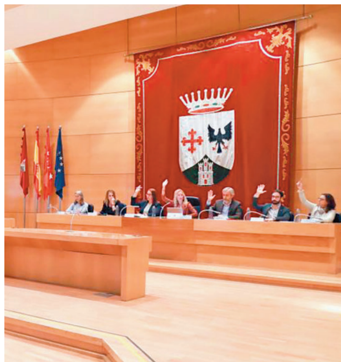
Un momento del pleno celebrado el pasado miércoles