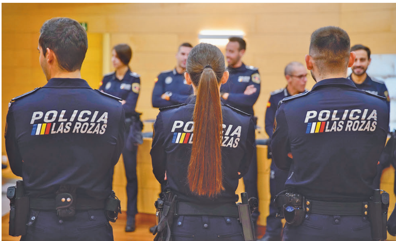
Algunos de los nuevos agentes que se han incorporado a la Policía Local