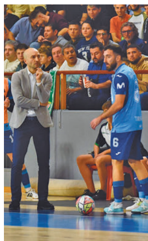
Triunfo vital en Córdoba

los triunfos ante Betis y Peñíscola, el equipo de Riquer cedía un empate ante Jimbee Cartagena (2-2) para reencontrarse con la victoria este