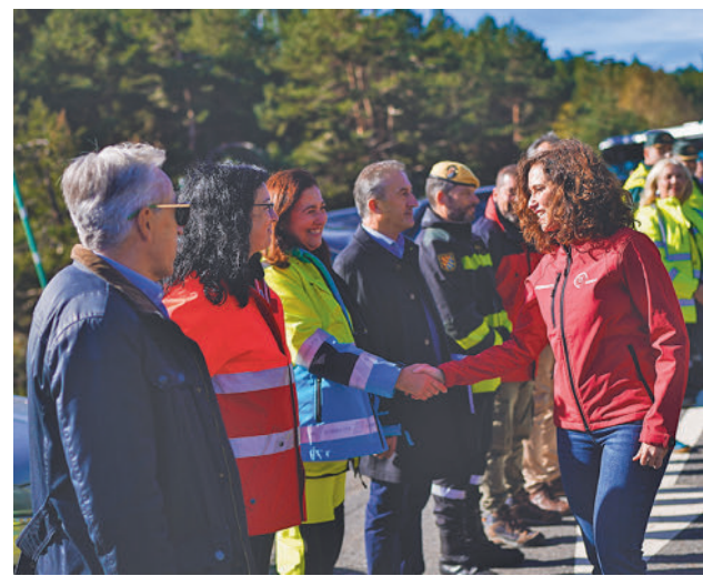
Acto de presentación del dispositivo en Rascafría