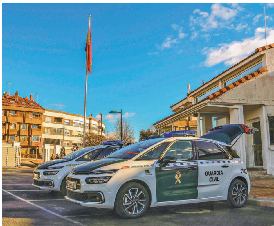
La investigación de la Benemérita comenzó en el segundo semestre de 2021

gentedigital.es La actualidad de los municipios del Noroeste, en nuestra web