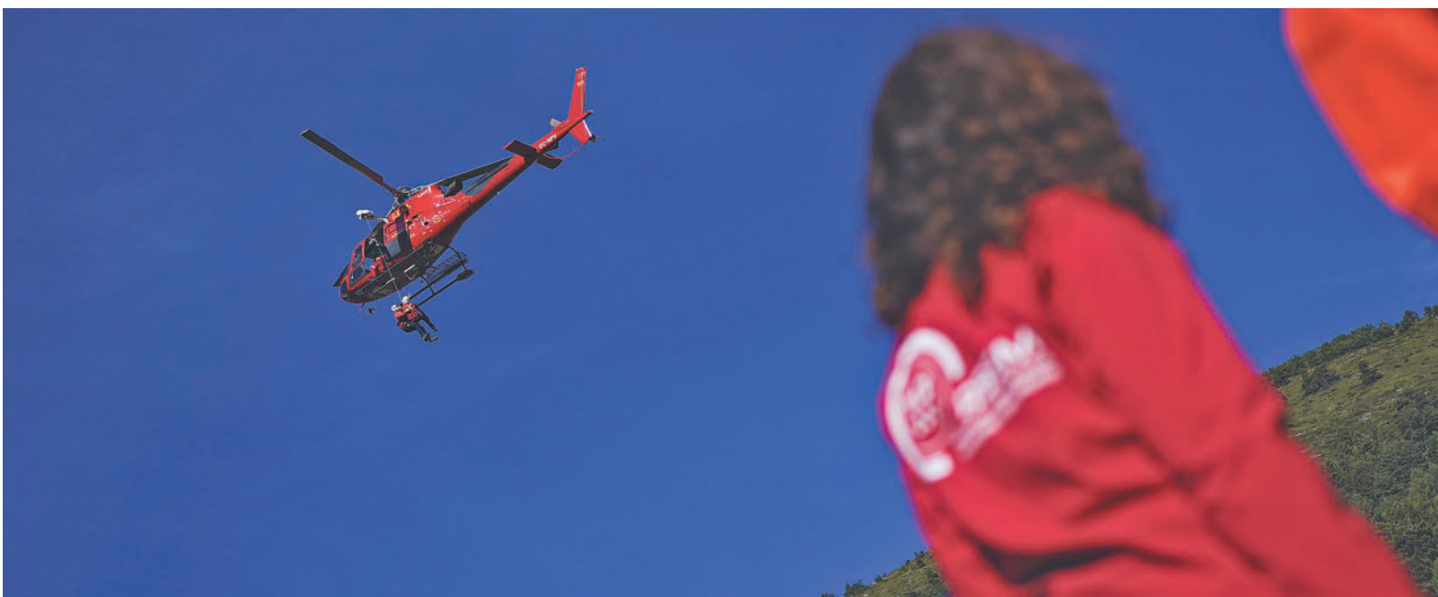
Isabel Díaz Ayuso observa uno de los helicópteros del dispositivo