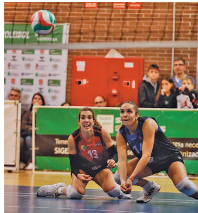
Sufrido triunfo en el Luis Buñuel

Esta buena noticia debería reforzar la moral de un Feel Alcobendas que, eso sí, visita este sábado 18 (19 horas) el Pavelló Municipal de Ciutadella, feudo de un Avarca Menorca que lidera la clasificación gracias a los 15 puntos conquistados hasta la fecha, a pesar de que en la última jornada sufría una derrota, la segunda del curso, en la casa de otro de los 'gallitos', el Hidramar Gran Canaria.