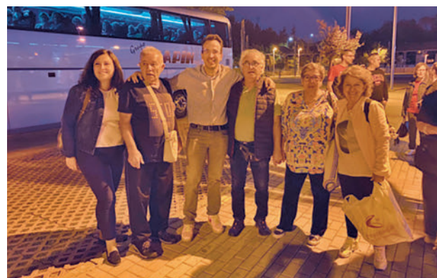
El alcalde, junto a algunos de los viajeros

En los estos días los participantes están recibiendo una carta con una sencilla encuesta para que puedan valorar