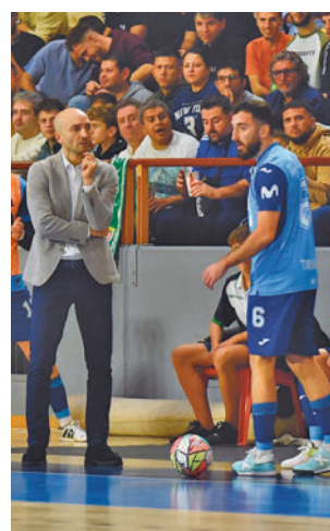
Triunfo vital en Córdoba