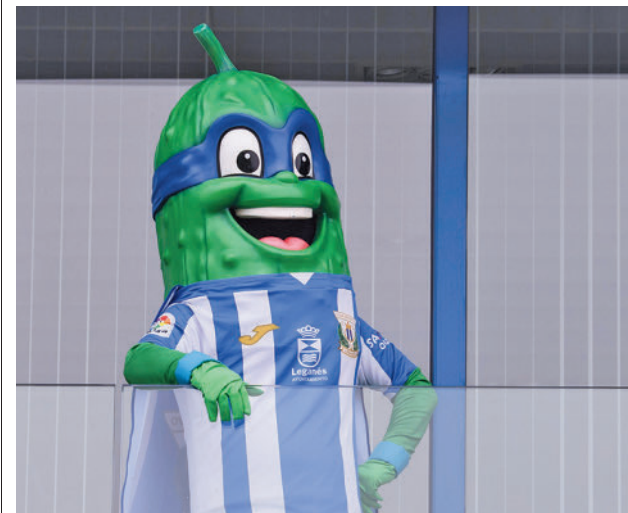
La mascota del CD Leganés CD LEGANÉS

Las entradas tienen un precio de 5 euros, que se rebaja a 3 euros para los socios del CD Leganés. Se pueden adquirir en la página web del club pepinero o en las oficinas del Estadio Municipal Butarque en horario de lunes a viernes de 10 a 20 horas. Antes del show habrá actividades para todos los públicos.