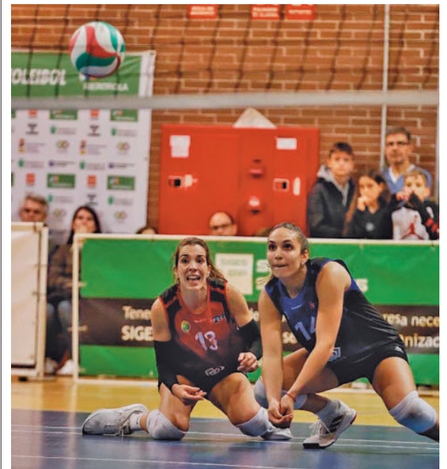
Sufrido triunfo en el Luis Buñuel

Esta buena noticia debería reforzar la moral de un Feel Alcobendas que, eso sí, visita este sábado 18 (19 horas) el Pavelló Municipal de Ciutadella, feudo de un Avarca Menorca que lidera la clasificación gracias a los 15 puntos conquistados hasta la fecha, a pesar de que en la última jornada sufría una derrota, la segunda del curso, en la casa de otro de los 'gallitos', el Hidramar Gran Canaria.