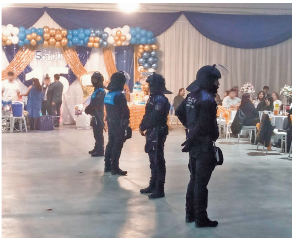
Los agentes entran a una de las naves industriales