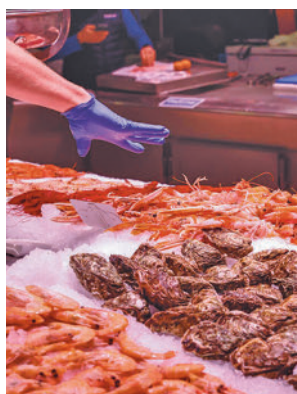
Marisco gallego E. P.

El evento se desarrollará en el Parque del Milenio y la Pulpería Archi será la empresa encargada de la parte gastronómica. Además de la de-