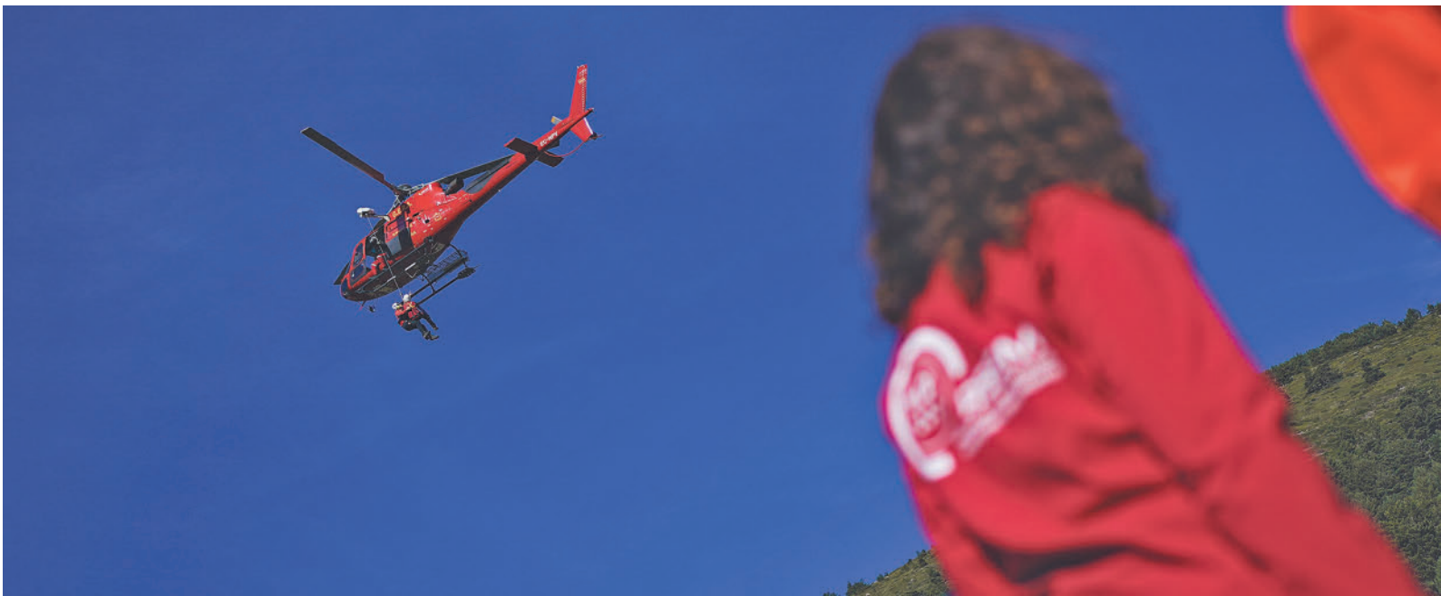
Isabel Díaz Ayuso observa uno de los helicópteros del dispositivo