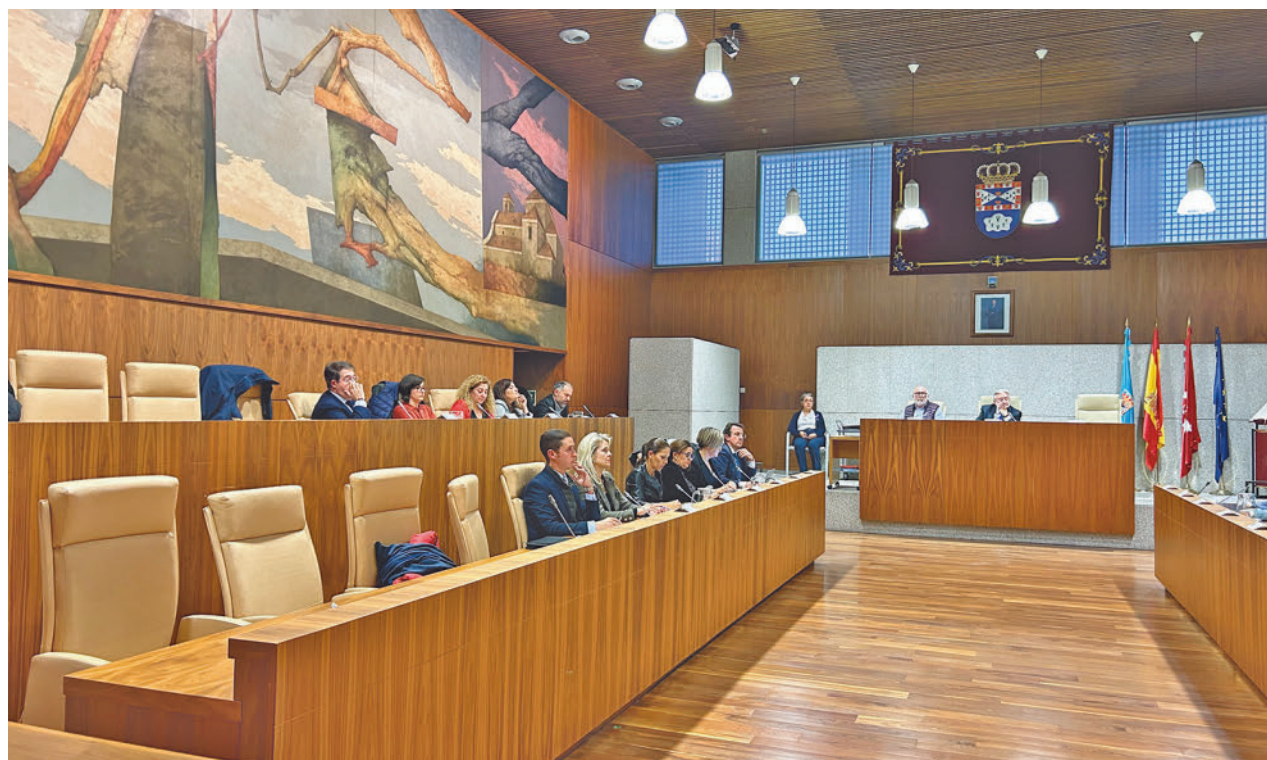
Un momento del pleno en el que se realizó la votación

A finales de mes, responsables de Discapacidad de la Comunidad de Madrid visitarán la residencia. “Lo que esperamos es que conozcan lo que estamos haciendo y que vean los avances. Viendo eso, que sepan que necesitamos apoyo y que busquen una solución todo los definitiva y urgen que se pueda”, esgrime la directora.