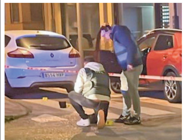
Lugar donde se cometió el robo

También se podrán descubrir los misterios y enigmas ocultos en los libros de 'El Juego de Mortadelo y Filemón', otra de las actividades de esta semana.