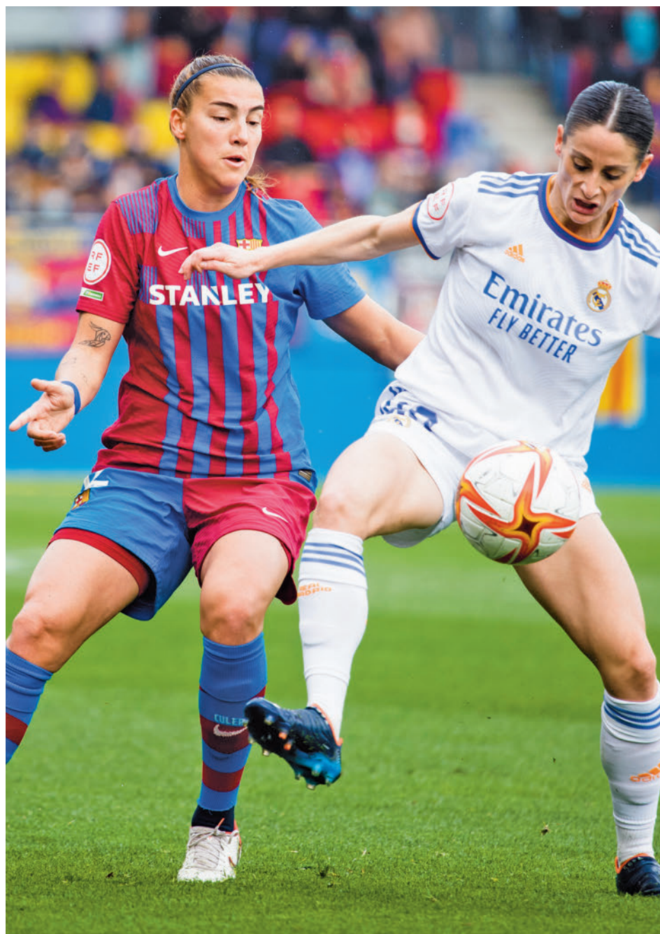
Patri Guijarro y Esther González, en un partido de la temporada 2021-2022

Las locales, que en la jornada previa se impusieron por 1-2 al Athletic, defienden la tercera posición, de la que se han hecho acreedoras gracias a los 18 puntos conquistados hasta la fecha, dos más que las colchoneras, que la semana pasada daban buena cuenta del Eibar: 3-0.