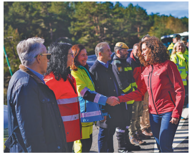
Acto de presentación del dispositivo en Rascafría