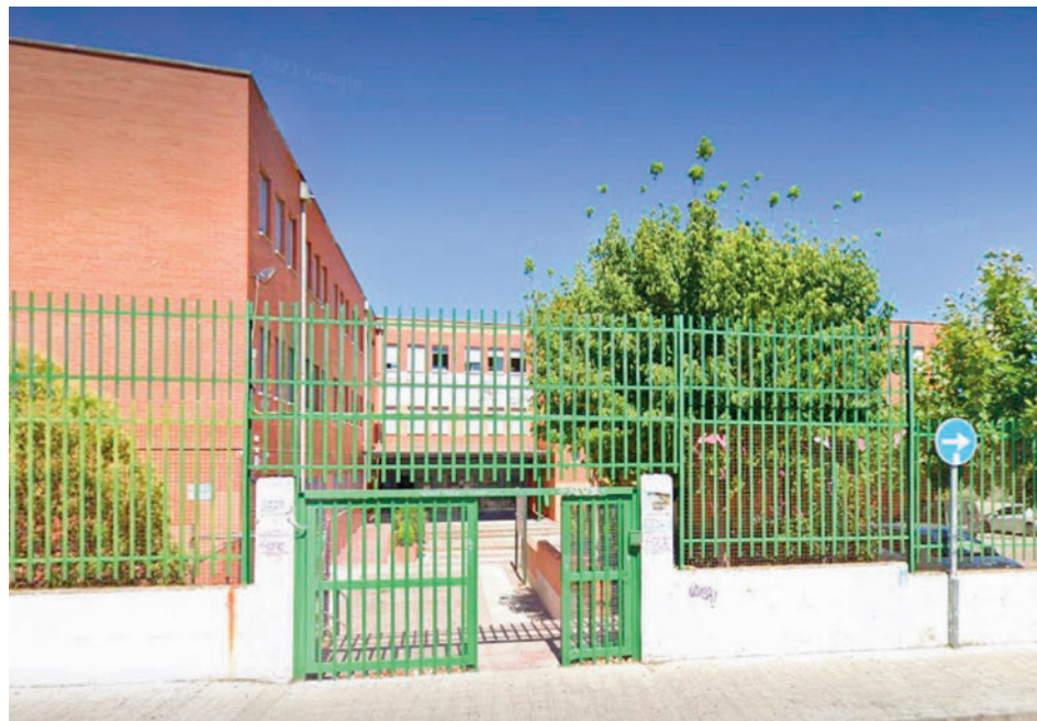
Entrada del IES La Laguna de Parla

Los hechos tuvieron lugar el pasado jueves 9 en el Instituto de Educación Secundaria La Laguna durante un recreo. Unos estudiantes llevaban tiempo molestando a la víctima, a la que no dejaban sentarse en un banco del centro. Pero ese día el acoso llegó a mayores y le agredieron con puñetazos y patadas. Los docentes le quitaron de encima a los agresores y llamaron a la Policía Nacional, que no ha realizado de momento, detenciones pero sí está investigando el caso, aunque