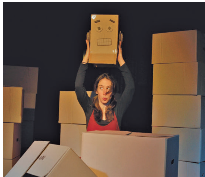
Obra de teatro 'Mi Nave Espacial' OKINA TEATRO

● Como novedad, en esta ocasión se han descentralizado los eventos, con el fin de que lleguen a todos los vecinos