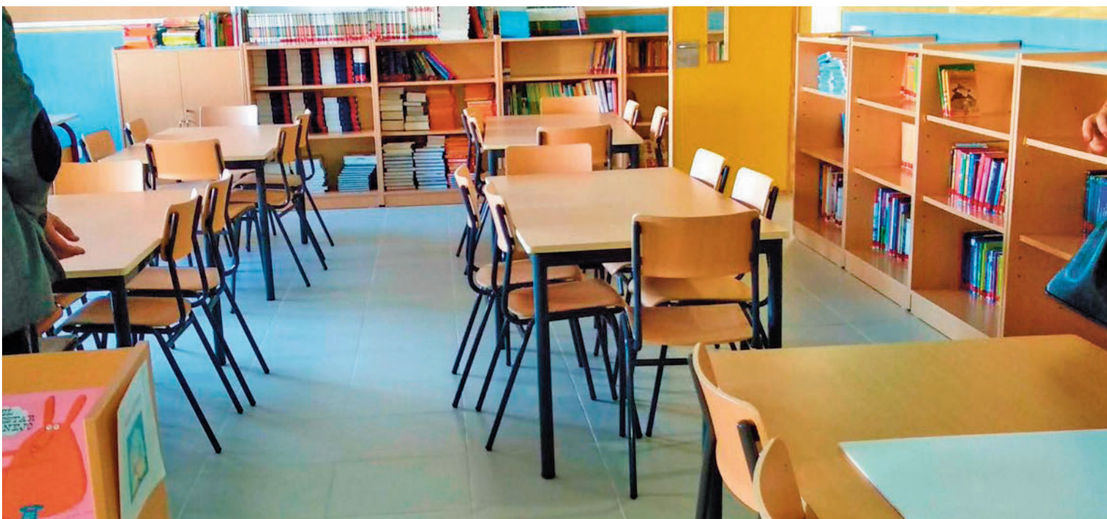
Los profesores siguen sufriendo agresiones por parte de sus alumnos en las aulas