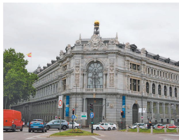
Banco de España

De acuerdo con el informe, el porcentaje de población vive en hogares cuyos gastos han superado a los ingresos es más elevado entre los individuos con menores recursos, como aquellos con un nivel de educación inferior a bachillerato (32%), los desempleados (43%), quienes residen en hogares con rentas menores de 15.000 euros