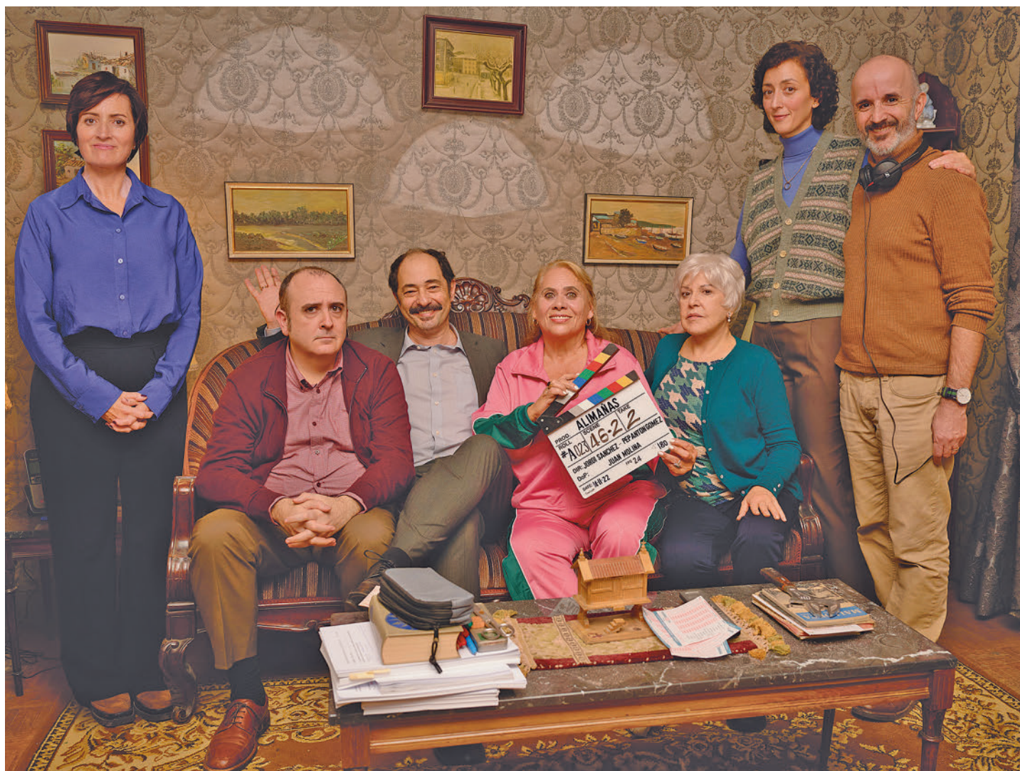
Foto de familia del elenco durante el rodaje

— Jordi Sánchez: No, porque la obra tiene 400 años (entre risas). La escribimos hace 20 años, por lo que el elenco en ese momento no lo teníamos en la cabeza. A las vecinas las incorporamos cuando hicimos el guion cinematográfico, porque en la obra de teatro original no existían. De lo que estamos muy contentos es que nos dijeran sí a la primera, estamos muy sorprendidos y agradecidos por el elenco que es.