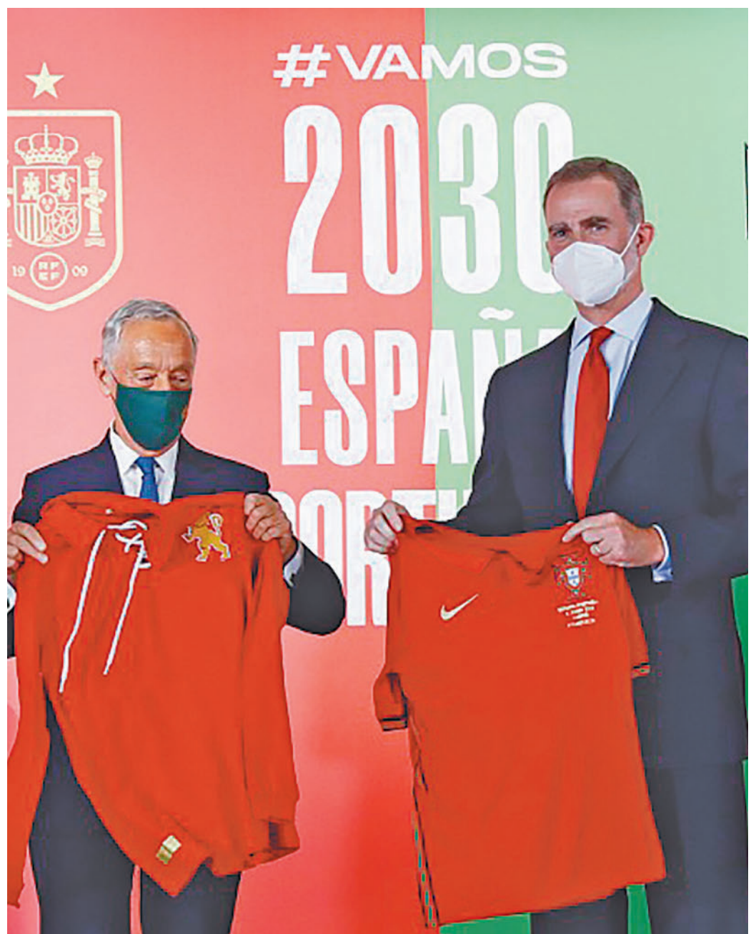
Presentación oficial de la candidatura inicial de España y Portugal

En lo que respecta a los estadios españoles, Madrid ofrecería dos, el Santiago Bernabéu, que ya acogió la final del Mundial de 1982 y cuya remodelación estará acabada en 2024; y el Metropolitano, que se convirtió en casa del Atlético de Madrid en 2017, contando ya en su haber con una final de Champions League, la de 2019. Otro de los estadios que está en