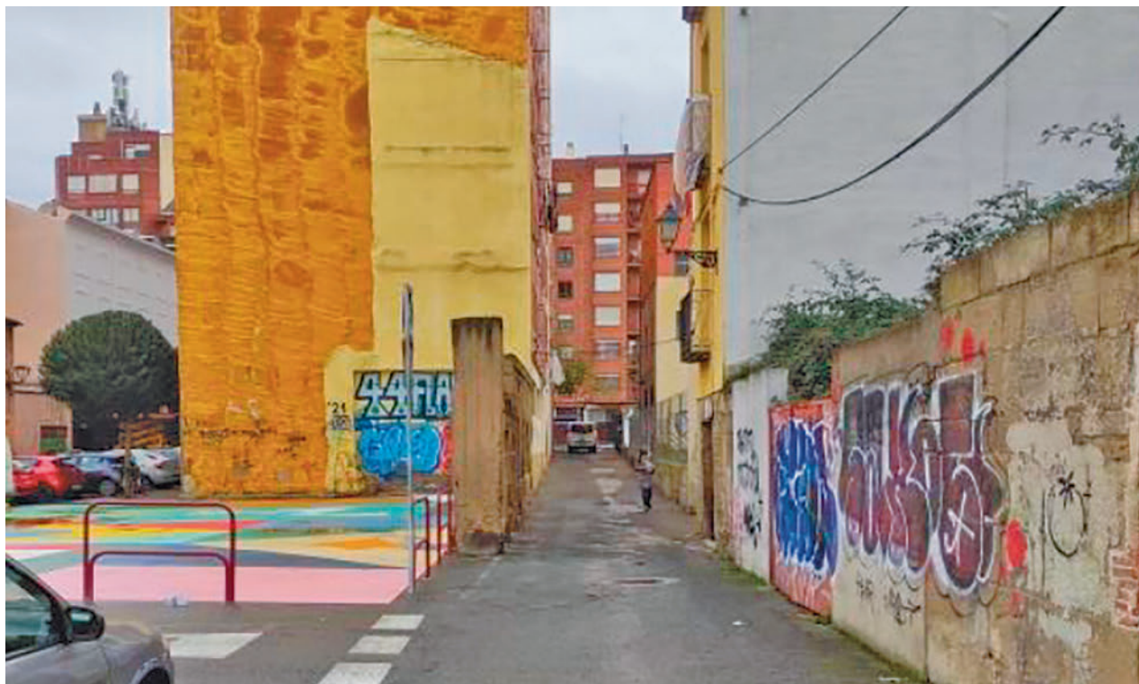
Aspecto anterior a las obras de la calle La Brava

El objeto de la actuación actual de ambas vías es su rehabilitación y su adecuación