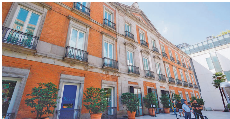
Edificio del Museo Nacional Thyssen-Bornemisza

en la exposición permanente del Museo Nacional Thyssen-Bornemisza. Las obras han sido aseguradas en un total de 27.080.654,05 euros, según publica el Boletín Oficial del