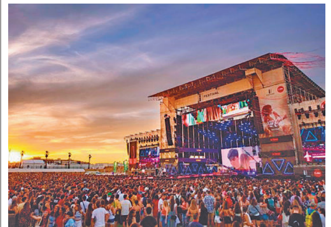
Los espectáculos en vivo, los mejor parados

El estudio, que ha analizado más de 154.000 espectáculos en vivo y 3,22 millones de sesiones cinematográficas, revela que las artes en vivo recaudaron en 2022 un 89% más que en 2021, pero la recuperación sigue sin ser completa en el campo de las artes escénicas, la música clásica y el cine, con una pérdida cercana al 40% de la recaudación respecto a 2019. La SGAE celebra que también se recupere la música popular.