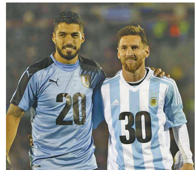
Suárez y Messi promocionaron la candidatura

Esta decisión salomónica ha dejado un gran damnificado por el camino. Chile formaba parte de la candidatura conjunta que presentaron cuatro países sudamericanos, pero es la única que finalmente se quedará sin albergar un solo encuentro de esta edición.