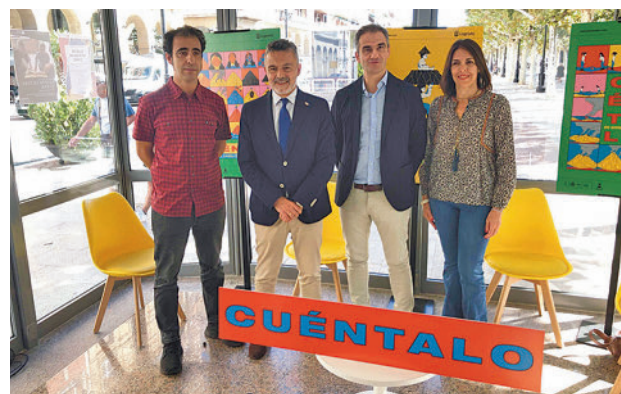
Un momento de la presentación del programa CUÉNTALO