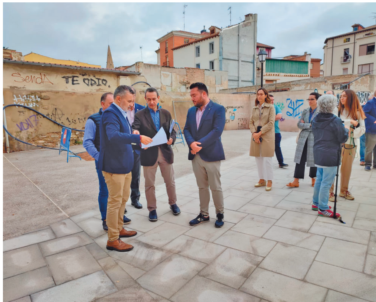
AYUNTAMIENTO DE LOGROÑO